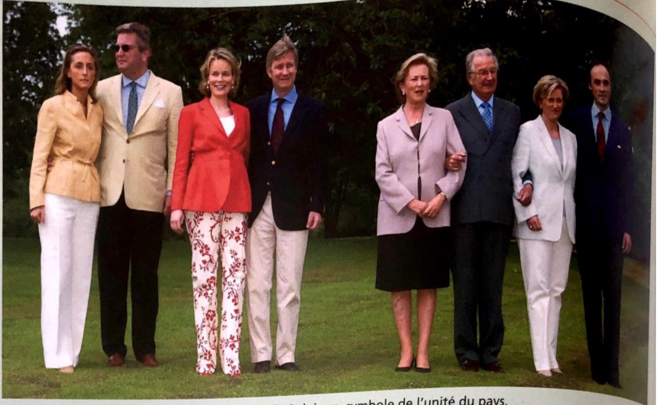
La famille royale de Belgique, symbole de l'unité du pays.