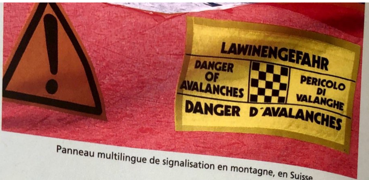
Panneau multilingue de signalisation en montagne, en Suisse.