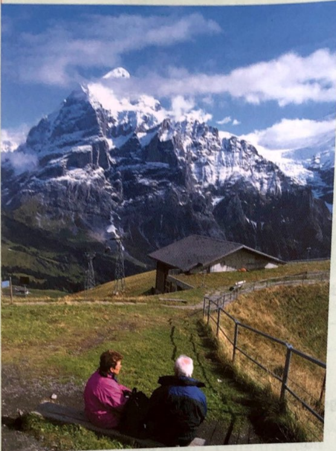
Les Alpes suisses en été.