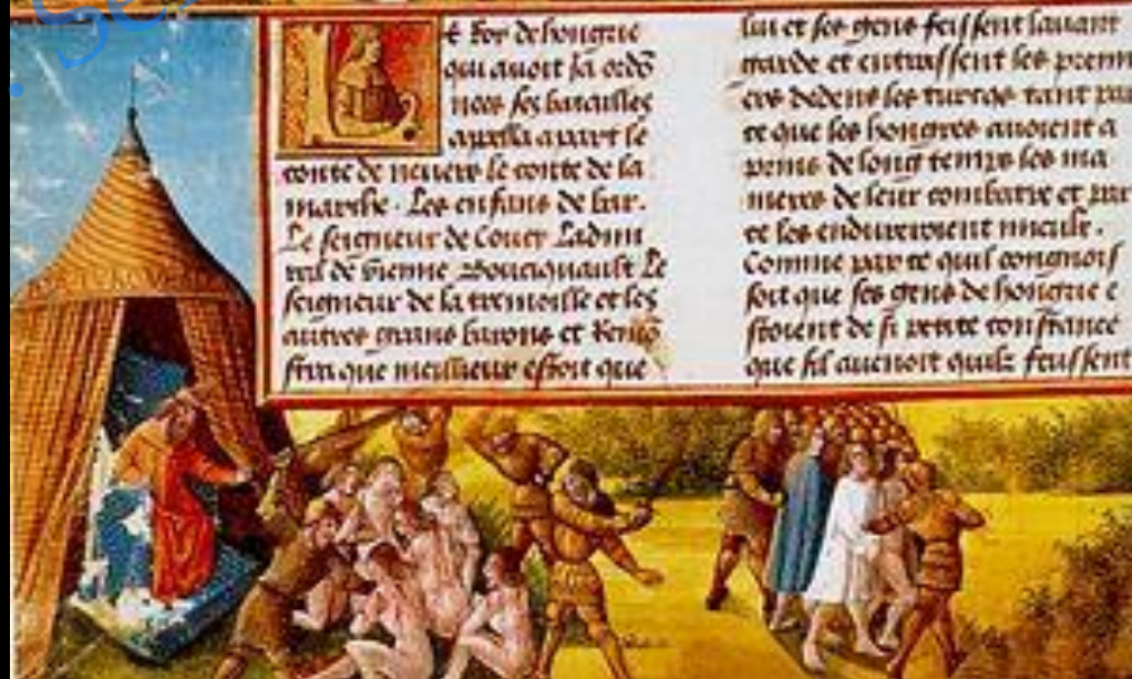
Niğbolu (Nikopolis) Muharebesi, (1396)

lui et ses gens feissent sauant maide et entrassent les premi ers dedens les turcs tant par re que les honores auoient a pens de sonz temys les ma nieres de leur combatre et par ce les endurement maile. Comme par ce quil conuons fort que ses gens de honore e stoient de si uert confiance que sil auenoit quilz feussent