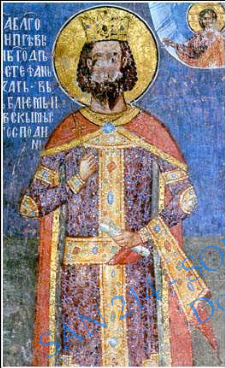
Lazar Hrebeljanovic (1371-1389)