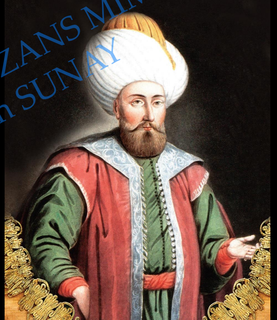
I. Murad Hüdavendigâr (1362-1389)