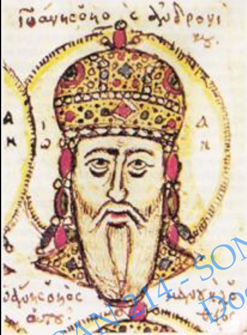
V. Ioannes (1341-1391)