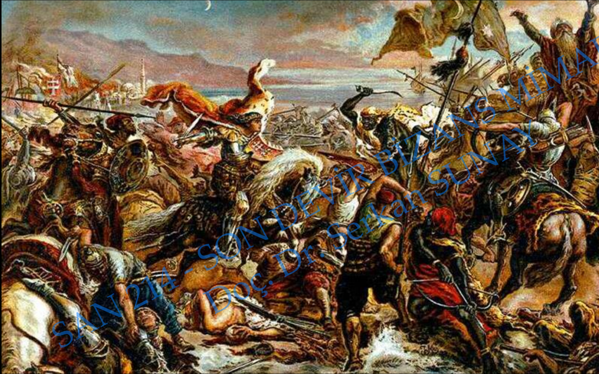
Varna Muharebesi (10 Kasım 1444)