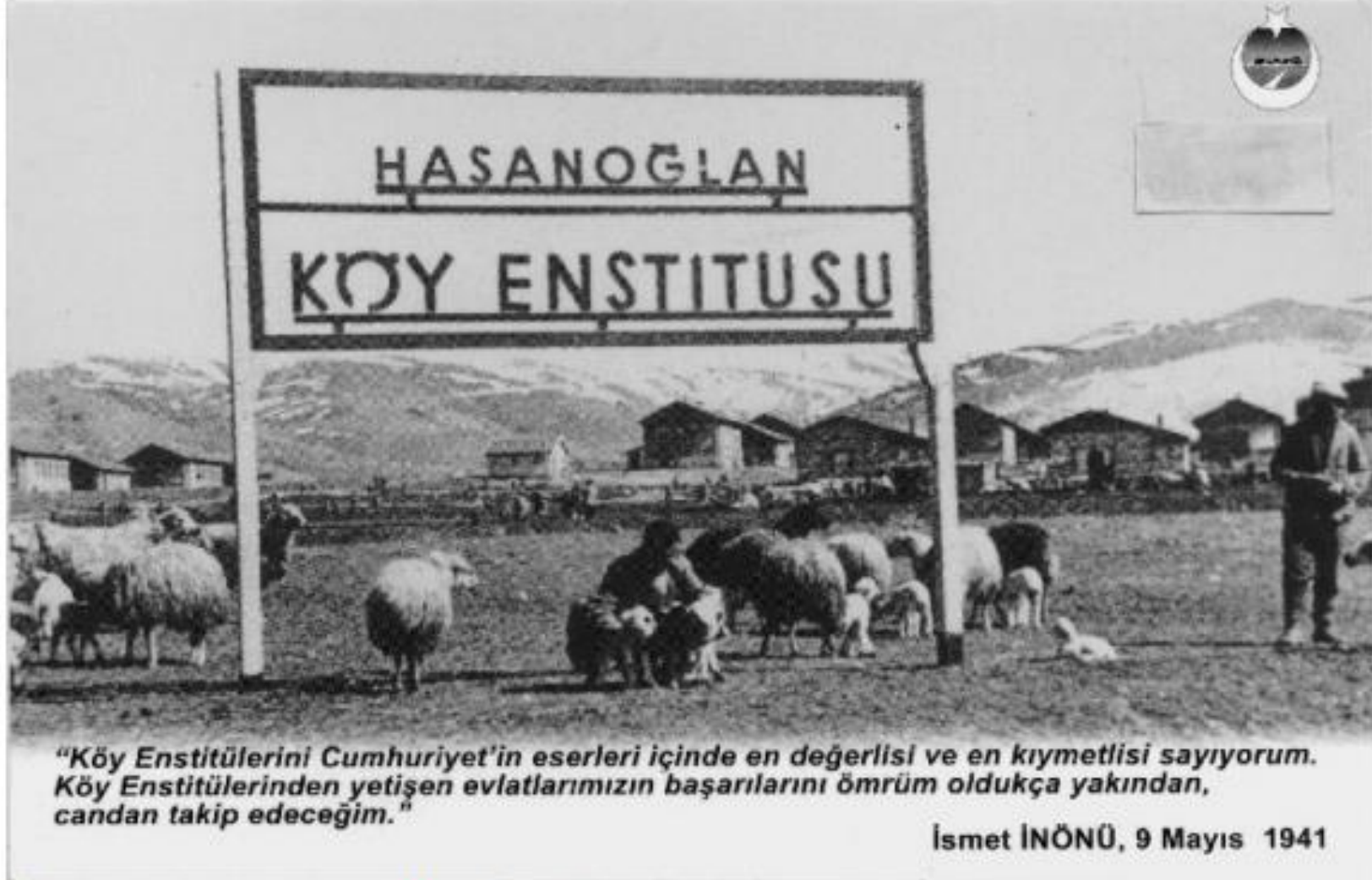
Resim 33:Hasanoğlan Köy Enstitüsü