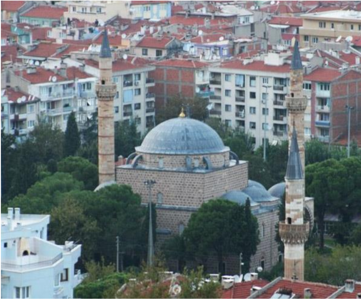
Manisa Ulu Camii