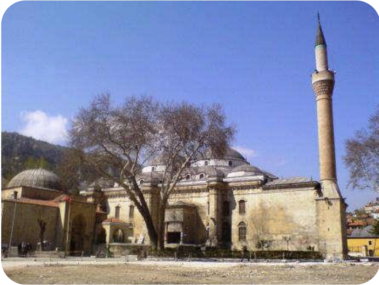
Vacidiye (Demirkapı) Medresesi.(Kütahya)