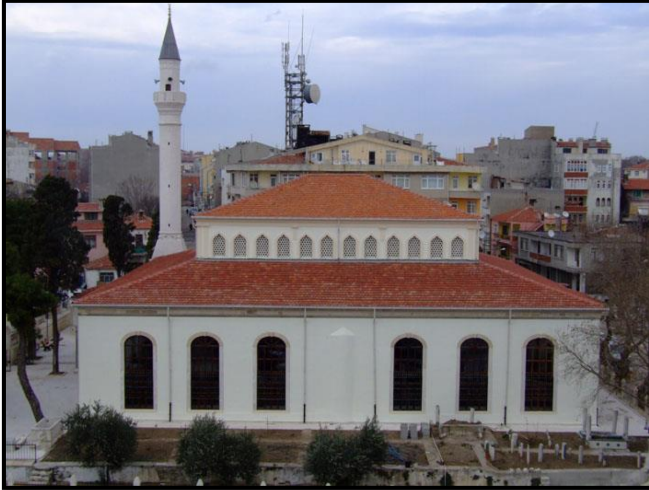
Gazi Süleyman Paşa Camisi (Safranbolu)