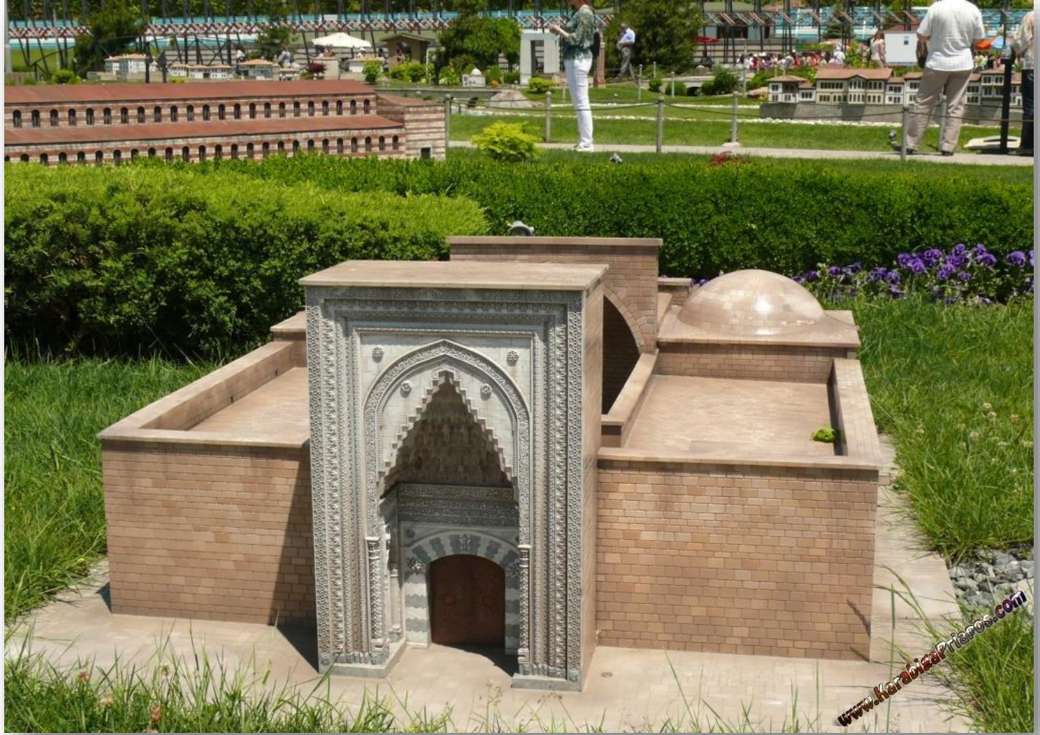
○ Hatuniye Camii minyatürü.(İstanbul)