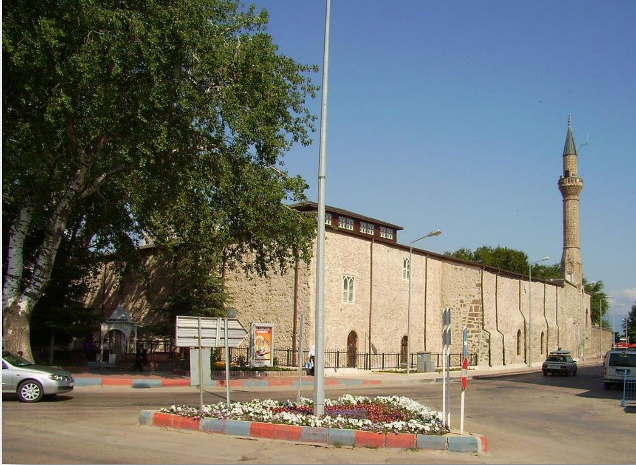
Eđirdir'deki Dündar Bey Medresesi