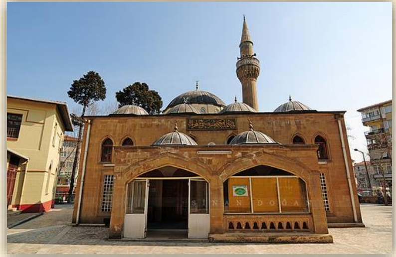
BOSTANCI KULOĞLU CAMİİ , İSTANBUL