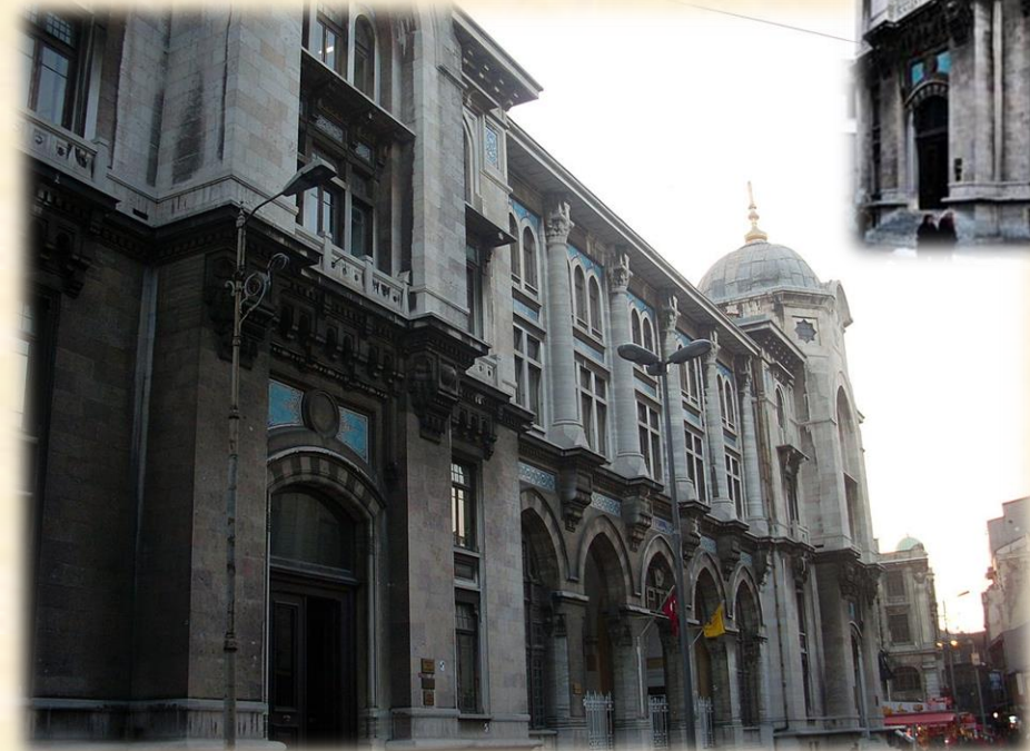
BÜYÜK POSTANE , SİRKECI