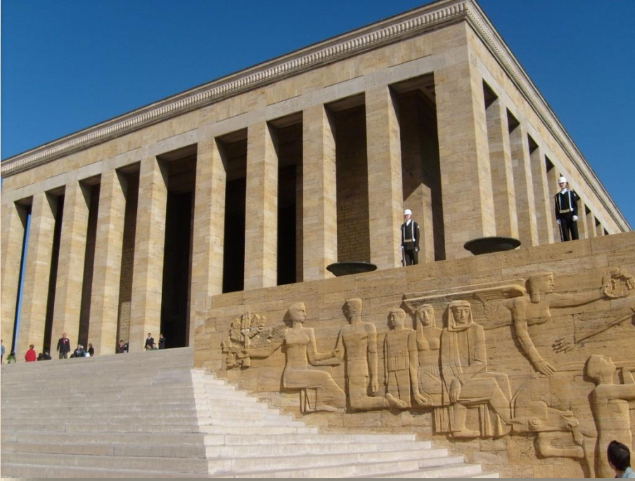
Anıtkabir (Emin Onat, Orhan Arda, yarışma, 1942)