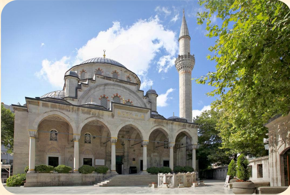
Şişli Camisi (Vasfi Egeli, 1945-49)