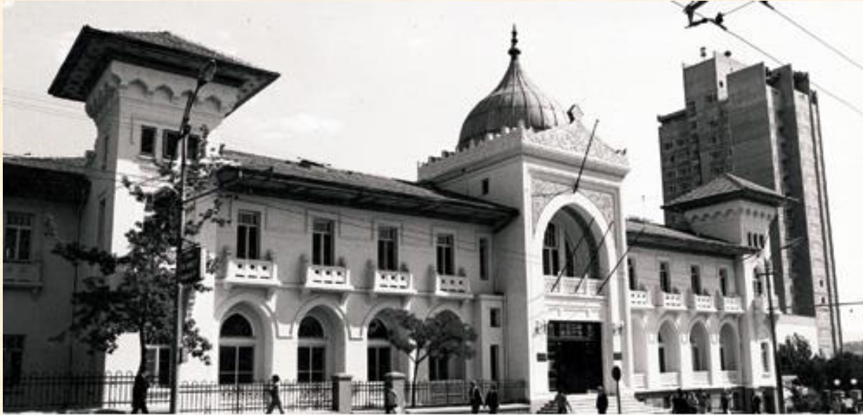
VAKIF OTELİ -ANKARA PALAS-