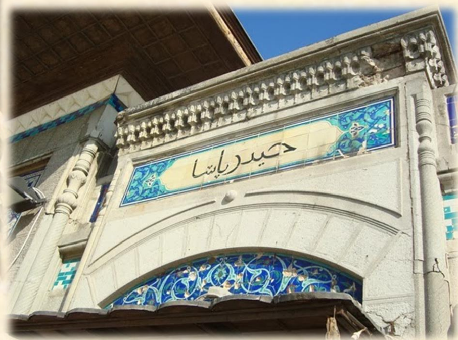
HAYDARPAŞA İSKELESİ, İSTANBUL