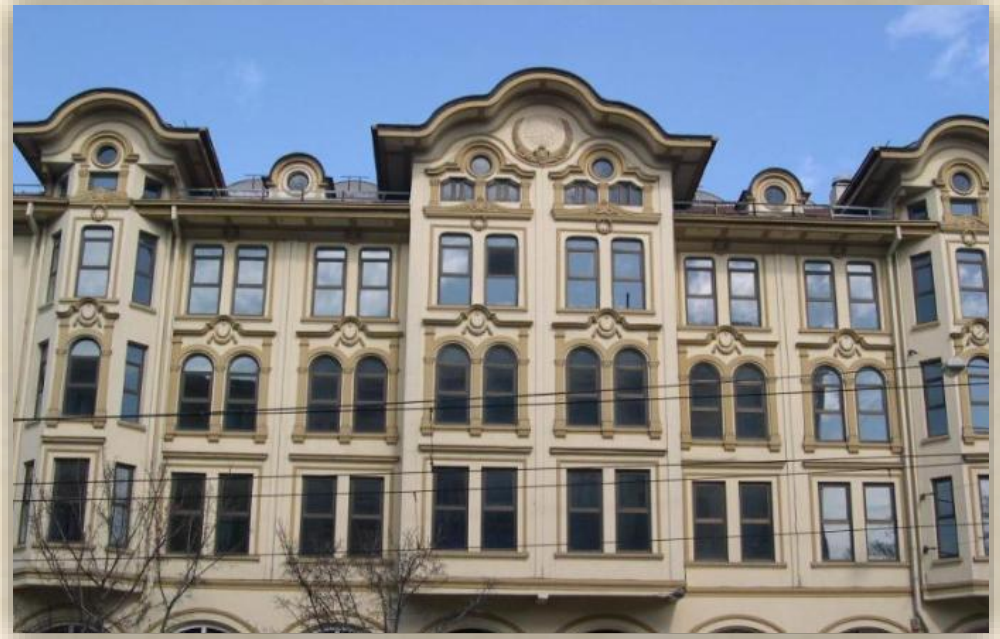
TAYYARE APATMANLARI , LALELI- İSTANBUL