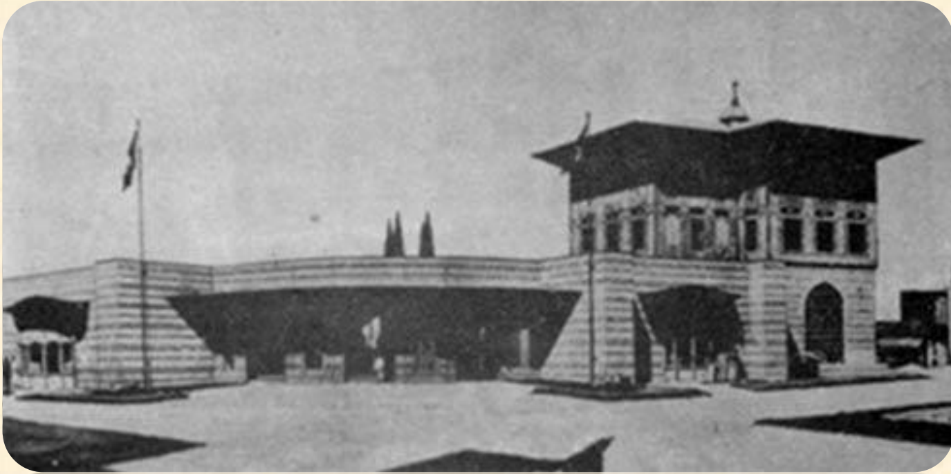
1939 Uluslararası New York Sergisi'ndeki ,Türkiye Pavyonu SEDAD HAKKI ELHEM