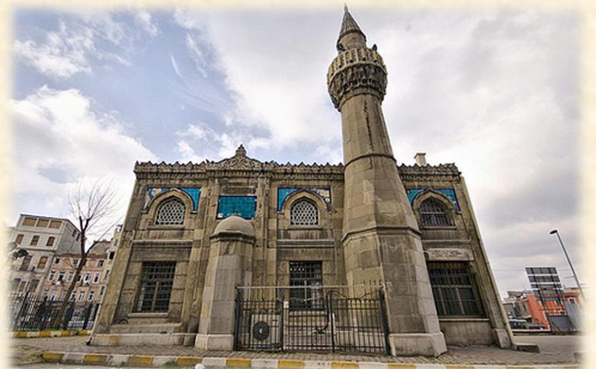
KAMER HATUN CAMİİ , BEYOĞLU