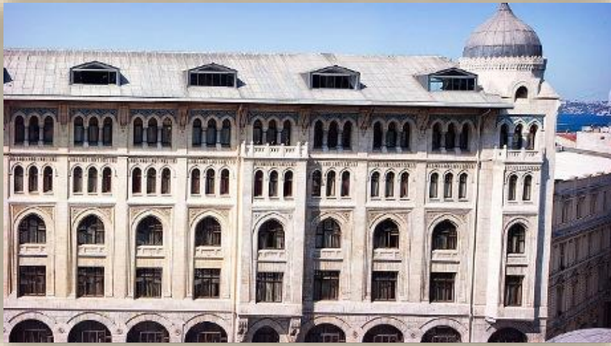
VAKIF HAN , İSTANBUL