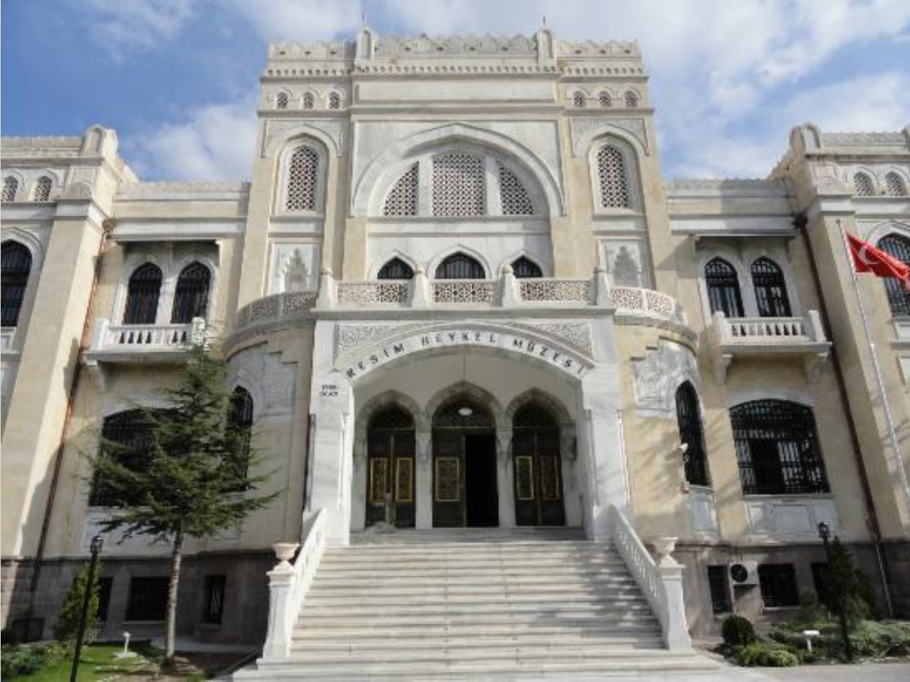
Türk Ocağı (Bugün Devlet Resim ve Heykel Müzesi), ANKARA