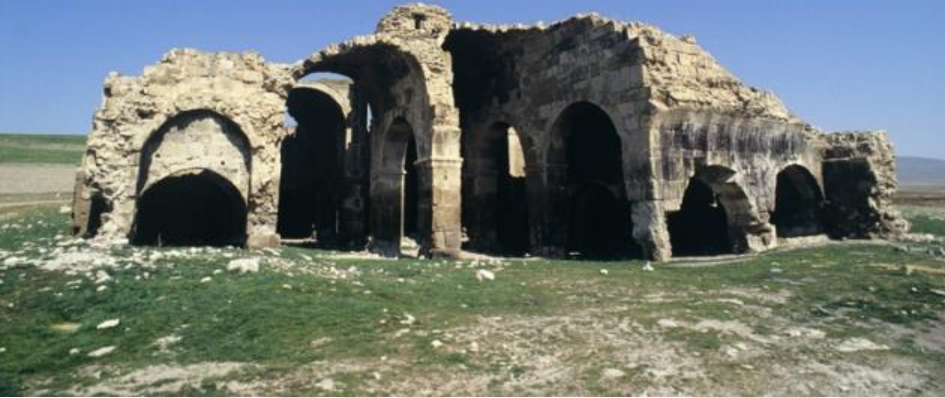
Evdir Han (Antalya)