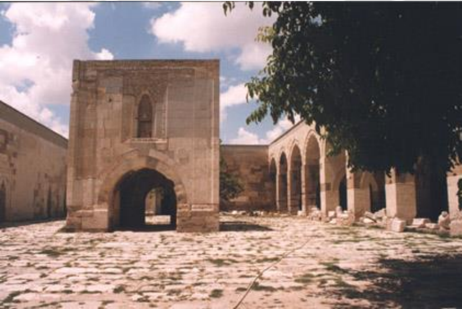
Sultan Han (Kayseri)