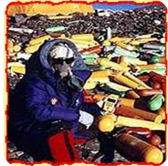
Foto 2. Everest Tepesi'nde oksijen tüpü yığımları arasında bir dağcı