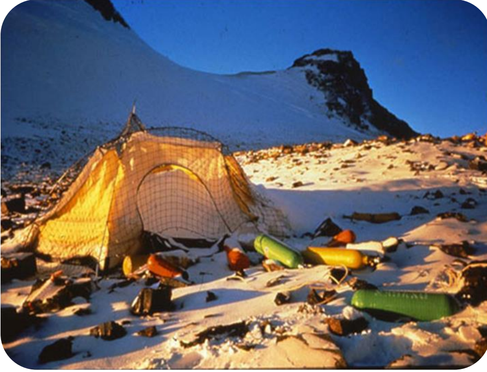
Foto 1. Everest Tepesi'nde terk edilmiş bir kamp yeri