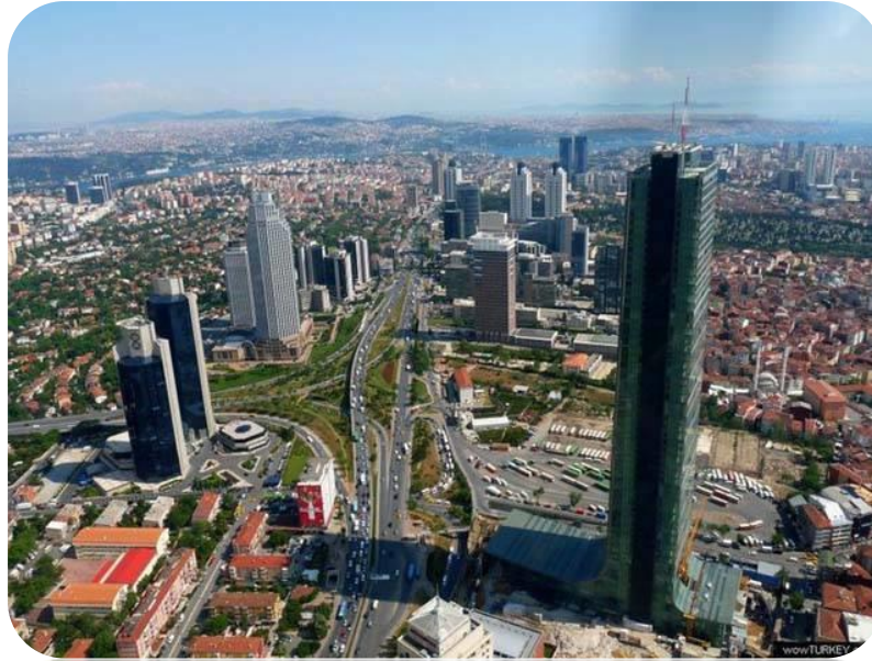
Şekil 15.Yapay Çevre/ Şehir Merkezleri

✓Yapay çevre ise; insanın bilgi ve kültür birikimine dayanarak, doğal çevresinde bulmuş olduğu yer altı ve yer üstü zenginliklerini kullanarak yarattığı çevreye denir. Temel özelliği, tümünden insan elinden çıkmış olmasıdır (Olhan 2012).