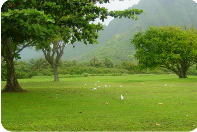
Şekil 23. Doğal Çevre

✓ Milke (Kiemstedt ,1985) çevreyi ; belli bir yaşam birliğine , bireye, topluma veya yaşam ortamına etki eden dış faktörlerin tümünün ekolojisi olarak kabul etmektedir (Arslan 2012).