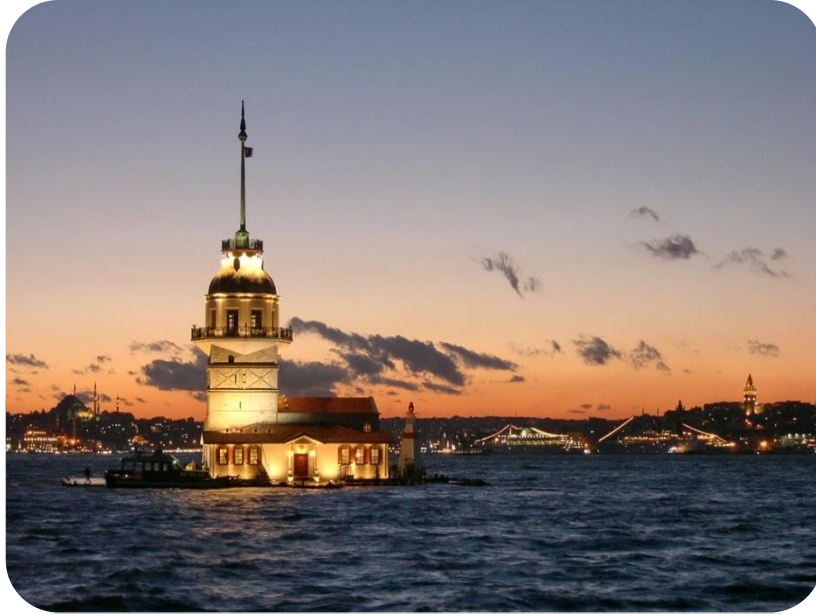
Şekil 10.Kültürel Çevre/ İstanbul

✓ Kültürel çevre ile kastedilen tümü insan eliyle üretilmiş çevre değerleridir. İnsanlığın tarih boyunca geliştirdiği uygarlıkların ürünleri kültürel çevre varlıklarını oluşturur ve doğal çevre değerleri ile bir bütünlük içindedirler. Kültürel çevre değerleri de doğal çevre değerleri gibi kirletilebilen ve yitirelebilen değerlerdir (Anonim 2013).