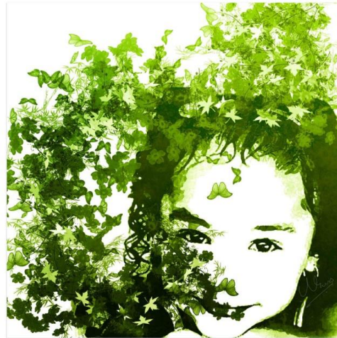
Şekil 24. İnsan ve Çevre

4-Uexküll (biyolog) ise duyu organlarıyla algılanan, değiştirilebilen ruhsal çevre olarak tanımlar(Arslan 2012).