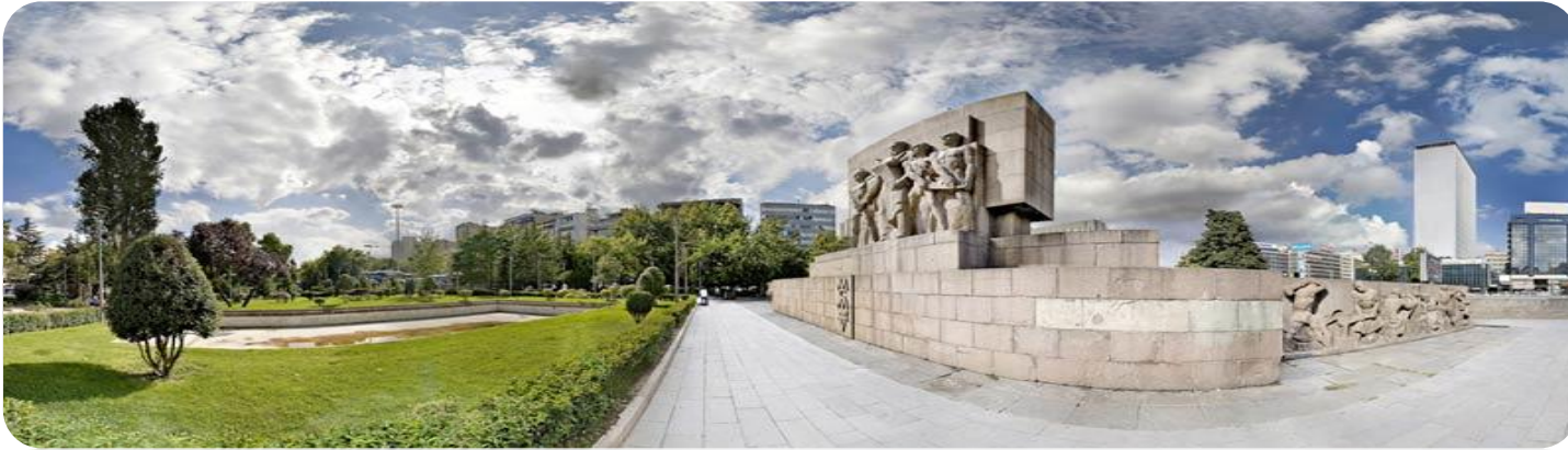
Şekil 16.Yapay Çevre/ Şehir Merkezleri

Kentsel ya da kırsal özelliğine bakılmaksızın yerleşim yerleri yapay çevreyi oluşturur. Yapay çevre yapıldığı dönemdeki toplumların bilgi, teknolojik ve toplumsal değerlerini yansıtır ve yapay çevre üretildiği zamanın toplumsal gereksinimlerine ve sosyo-ekonomik sistemine göre biçimlenir. Örneğin; kentleri süsleyen anıtlar, evler, yollar, hep yapay çevrenin birer parçasıdır (Olhan 2012).