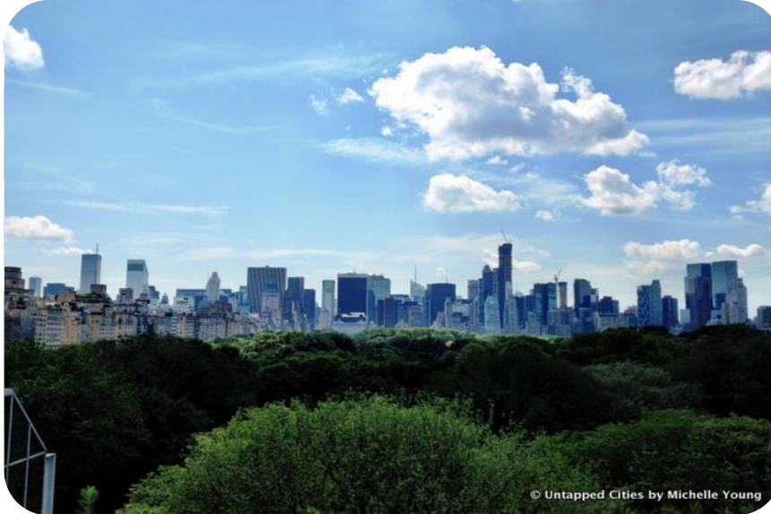
Şekil 5.Yapay Çevre

✓ Fiziksel çevre doğal ve yapay çevre olarak iki gruba ayrılır (Olhan 2012).