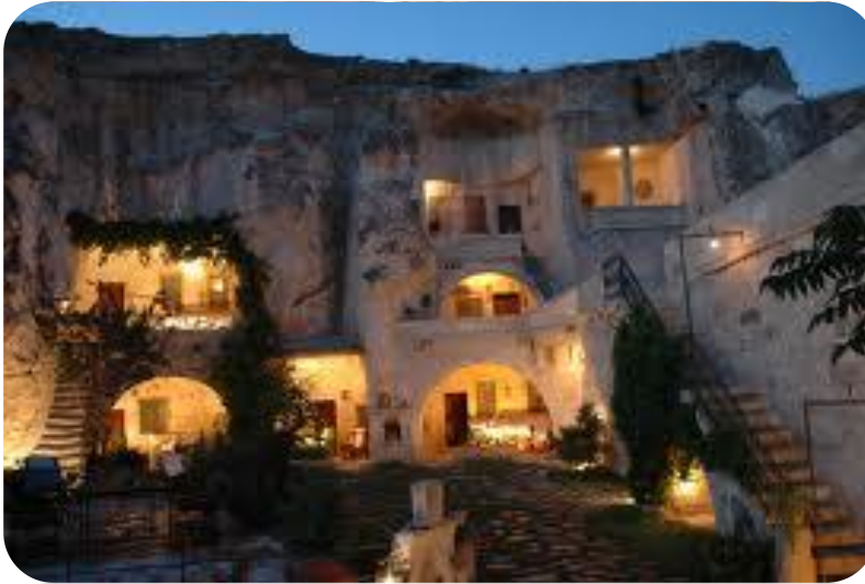
Şekil 14.Kültürel Çevre/ Kapadokya

Doğal, tarihi ve kültürel değerleri bünyesinde barındıran ve bu değerlerin bütünleştiği, bir arada doku oluşturduğu çevrelerdir. İçerdiği doğal oluşumlar ve kültürel varlıklar ile Kapadokya bölgesi aynı zamanda doğal ve kültürel çevre olarak Örnektir (Uslu 2013).