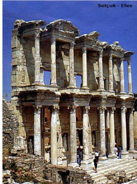
Şekil 12. Kültürel Çevre/ Efes

✓ Bu konuya ilişkin ulusal mevzuatımızın temelini 2863 sayılı Kültür ve Tabiat Varlıklarını Koruma Kanunu oluşturmaktadır (Anonim 2013).