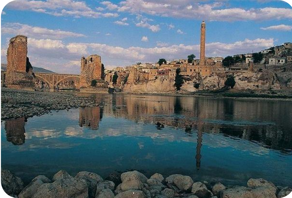
Őekil 13.K lt rel  evre/ Urfa

✓ Bu konuya ilişkin ulusal mevzuatımızın temelini 2863 sayılı K lt r ve Tabiat Varlıklarını Koruma Kanunu oluřturmaktadır (Anonim 2013).