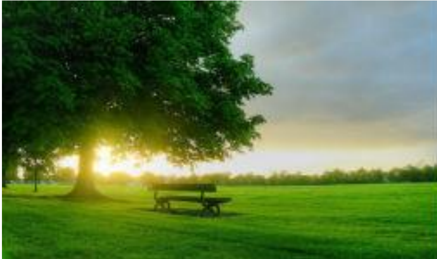
Şekil 19. Yaşam Ortamları

✓ İnsanların ve diğer canlıların yaşama ortamını oluşturan hava, toprak ile birlikte denizler,göller, akarsular, bataklıklar, kumsallar, ormanlar, tarım alanları, dalyanlar, kırlar, dağlar korunması gerekli çevreyi oluşturan alanlardır. Bu alanlar tüm canlıların üreme ve beslenme ortamlarını oluşturur (Uslu 2013).