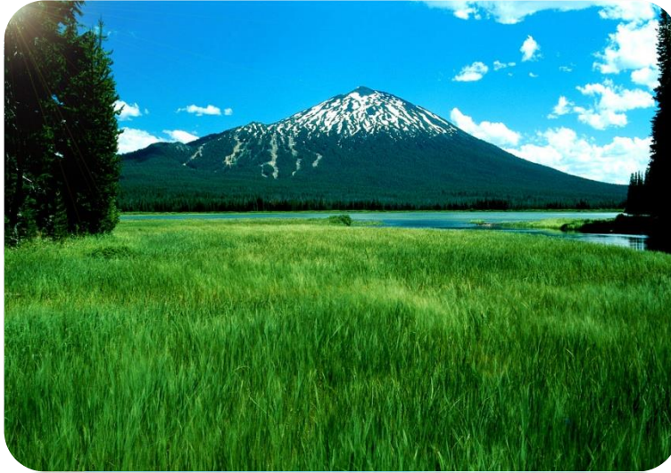
Şekil 7. Doğal Çevre

✓ Doğal çevre insanın oluşumuna katkıda bulunmadığı hazır bulunduğu çevredir. Aslında insan da bu çevrenin bir parçasıdır (Olhan 2012).