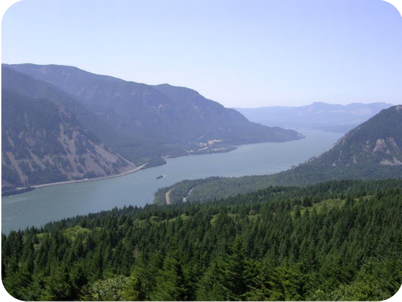
Şekil 8.Doğal Çevre