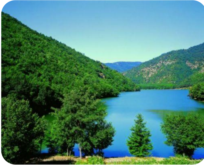
Şekil 4. Doğal Çevre

✓ Çevre; insanı etkileyen fiziksel, kimyasal ve biyolojik tüm sistemleri kapsamaktadır. Çevre genel anlamda fiziksel çevre ve toplumsal çevre olarak ele alınabilir.