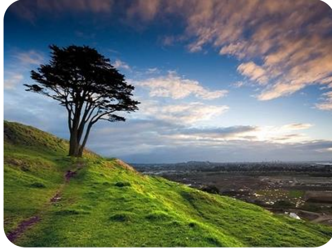
Şekil 22. Doğal Çevre