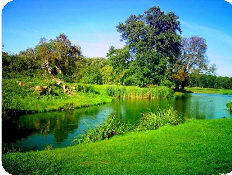
Şekil 9. Doğal Çevre

✓ Doğal çevre bileşenleri canlı ve cansız olmak üzere iki grupta toplanır ve insan, bitki ve hayvan toplulukları canlı öğeleri, canlıların yaşamlarını sürdürebilmeleri için gerekli olan hava, su, toprak ile yer kabuğunu oluşturan katmanlar, yer altı kaynaklar ise cansız öğeleri oluşturur (Anonim 2013).