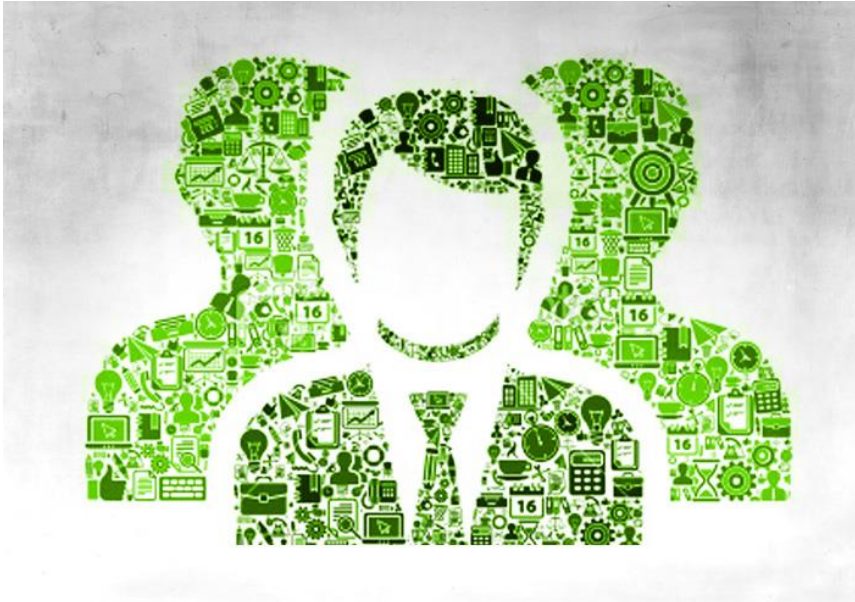
Şekil 20. Sosyal Çevre

✓ Çevre canlı ve cansız her şeyi kapsamakta, biyofiziksel, sosyal ve kültürel unsurları içermektedir. Bunlardan birincisi insanın biyolojik ve fiziksel yanını, ikincisi ise insanın ekonomik, politik ve entelektüel aktivitelerini kapsamaktadır. Bu iki unsur birbirleriyle ilişkili ve birbirinin ayrılmaz parçasıdır. Dolayısı ile insan çevresinden etkilendiği gibi çevresini de büyük oranda etkileyebilmektedir.