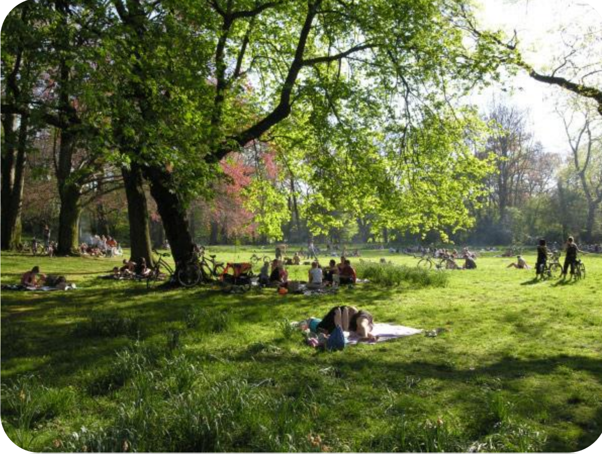
Şekil 3. İnsan ve Çevre