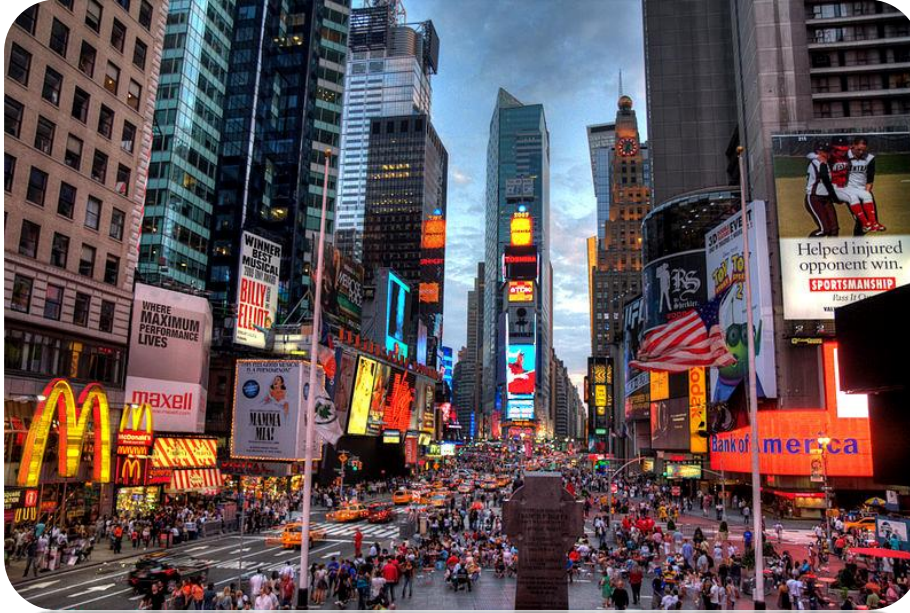
Şekil 18. Şehir Merkezi ve İnsanlar

✓ Çevre için yapılan pek çok tanım vardır. Toplum bilimcilerine göre çevre çok genel anlamıyla, insanların bir arada yaşamasının sonucu olarak oluşan insan kümesini yani toplumu dolaylı veya dolaysız olarak etkileyen şartlar bütünüdür.