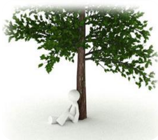
Şekil 21. Çevre ve İnsan

✓ Çevre tanımlarının farklı olmasının nedeni, çevre kavramının ne kadar kapsamlı olduğunu göstermektedir. insan merkezli, farklı disiplinlerden değerlendirildiklerinde çevrenin canlı ve cansız varlıkları etkilediği gibi etkilenebilen, zaman boyutu ile de ele alınması gereken bir kavram olduğu unutulmamalıdır (Uslu 2013).