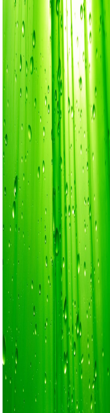
Şekil 17. Doğal Çevre