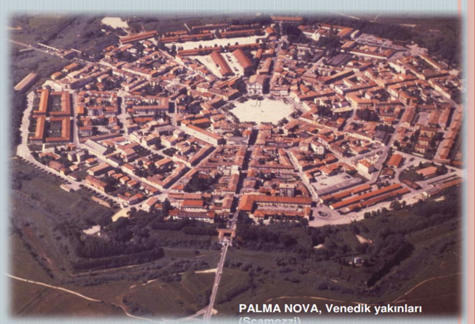
PALMA NOVA, Venedik yakınları (Scamozzi)

•Mekansal kimlik kazanmış kentler;Bu kentler belirli özellikli mekanlar baz alınarak, kent o mekanın çevresinde oluşur.Örnek olarak Almanya'nın Volterra kenti örnek verilebilir.