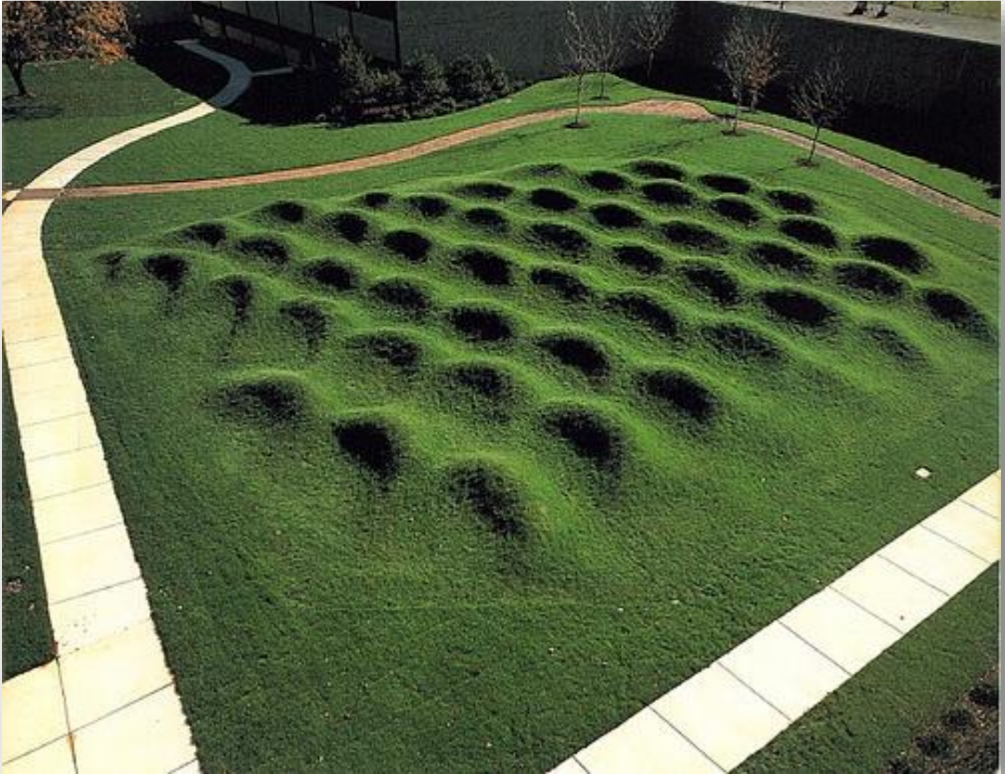
Land Art Akınımın yakın tarihteki örneklerinden biride mimar ve sanatçı Maya Lin tarafından yapılmıştır.