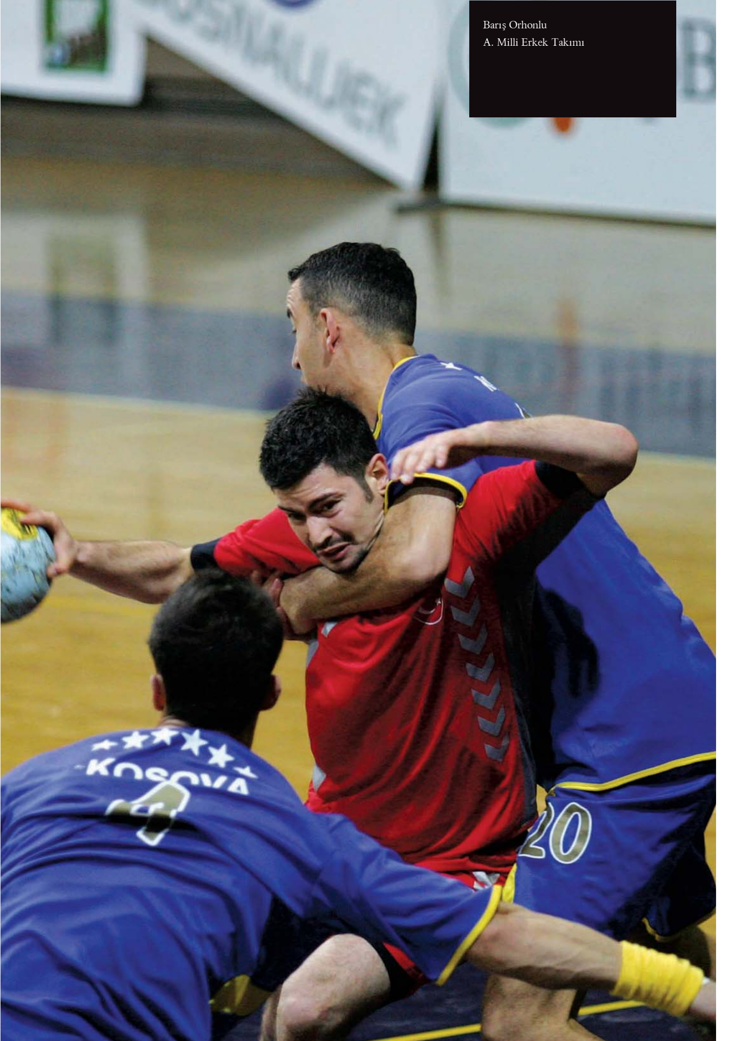
Bariř Orhonlu A. Milli Erkek Takımı