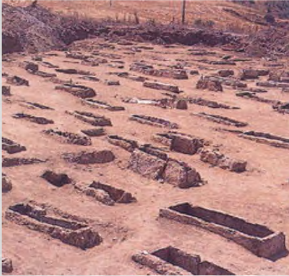
Agia Paraskevi Cemetery