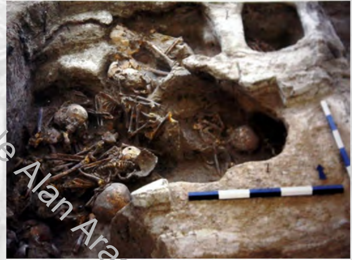
Çatalhöyük yapı tabanının altındaki gömütler