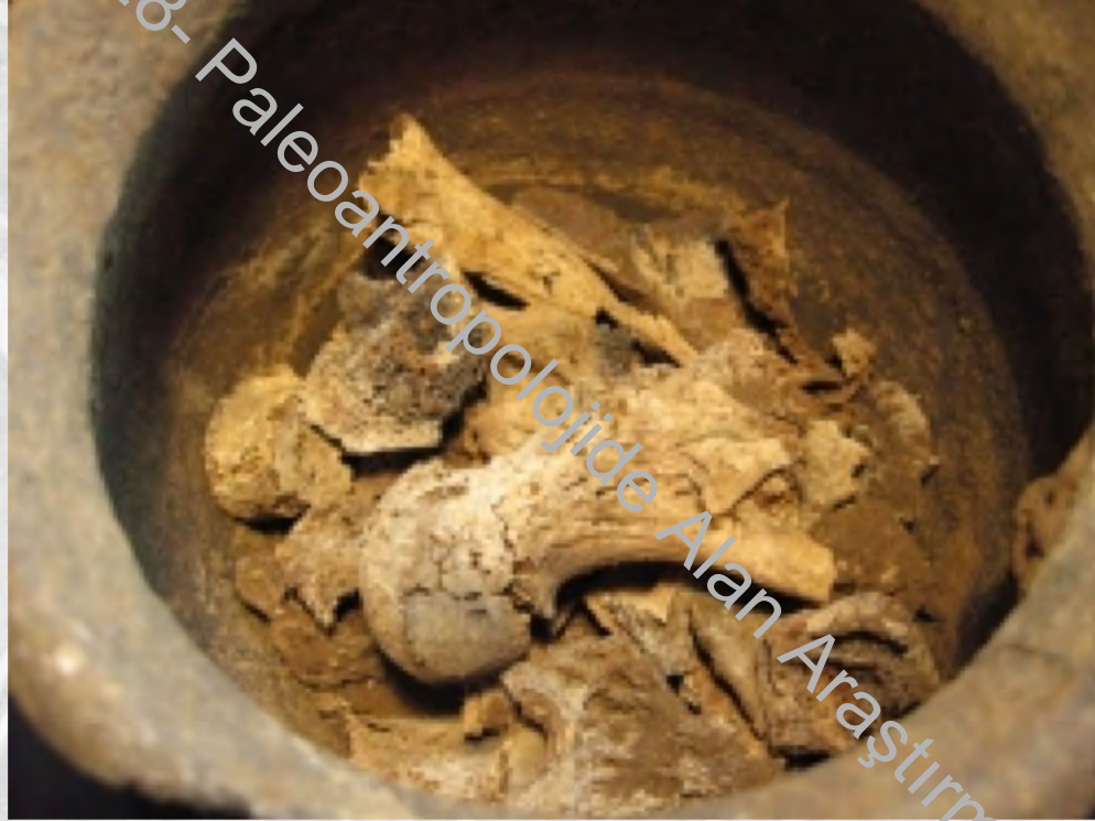
Cremated bone in Roman urn

ANT428- Paleoantropolojide Alan Araştırması