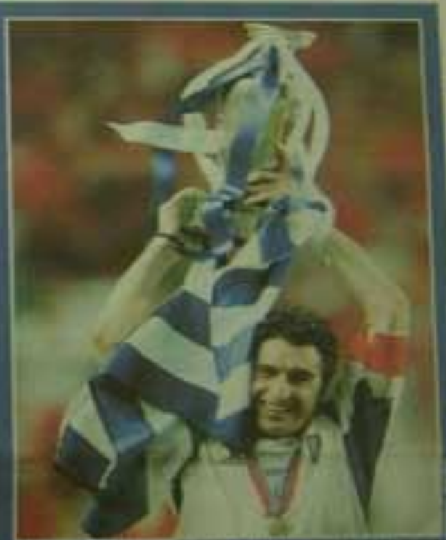
Yunanistan'da bugün düzenlenen Yunanlar Günü kutlamaları sırasında bir Yunan erkek, Yunan bayrağını bir kadın ile birlikte kaldırarak kutlamalara katıldı.