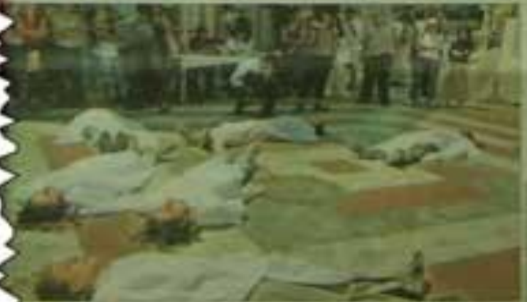
İşini ihanet gerekçesiyle öldüren erkeğin cezası 24 yıldan altı yıla indirildi; sürekli dayak atan eşini öldüren kadın ise 24 yıl ceza aldı