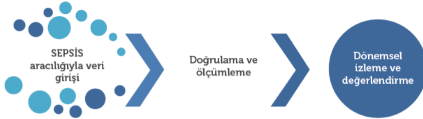
Şekil 3. 2016-2019 Ulusal e-Devlet Stratejisi ve Eylem Planı İzleme Dönemi Faaliyetleri