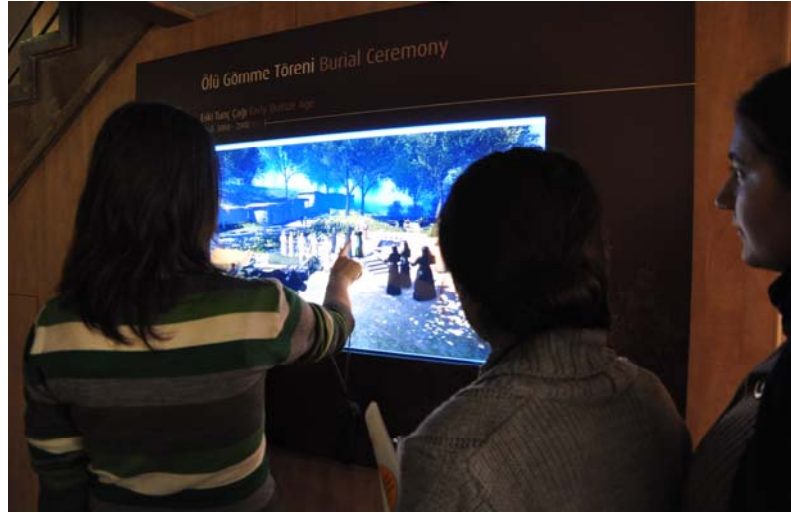
Resim 2. Eski Tunç Çağı Alacahöyük Mezarı Dokunmatik Ekranlı İnceleme

arasında Çorum Müzesi'nde konaklamış ve müze eğitimi etkinliklerine katılarak Hitit Uygarlığı hakkında ayrıntılı bilgi edinmiştir. Bu uygulama Türkiye'de bir müzede gerçekleştirilen ilk yatılı müze eğitimi uygulamasıdır. Amerika Birleşik Devletleri ve Avrupa müzelerinde sıkça görülen yatılı müze eğitimi uygulamaları Çorum Müzesi için bir sosyal sorumluluk projesidir ve müze, dünya müzelerinin aksine bu hizmeti öğrencilere ücretsiz olarak sunmaktadır.