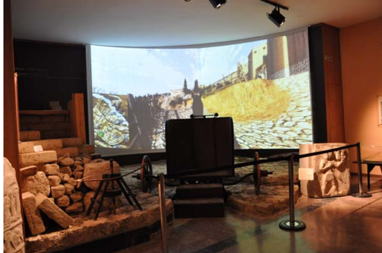
Resim 1. Hattuşa Ören Yeri Sanal Gezisi (Hitit Savaş Arabası Simülâtörü)

Çorum Müzesi Müdürlüğü 26 Kasım 2011 tarihinde Çocuk Eğitim Atölyesi ’ni hizmete açmıştır. Eğitim Atölyesi, ziyaretçilerin Hititlerin gündelik yaşamını uygulamalı olarak öğrenebilecekleri Hitit Evi ve Yaratıcı Drama Salonu’nu da kapsayan bir müze birimidir. Ayrıca müzenin bir bölümü de 10 yataklı kız öğrenci ve 10 yataklı erkek öğrenci yatakhanelerinden oluşan konaklamalı müzeye dönüştürülmüştür. Çorum Valiliği ve Çorum Müzesi tarafından hazırlanan Herkes Müzeye projesi kapsamında Çorum Sevgi Evleri ve yatılı bölge ilköğretim okullarından seçilen 20 ilköğretim öğrencisi, 27 – 28 Kasım 2011 tarihleri