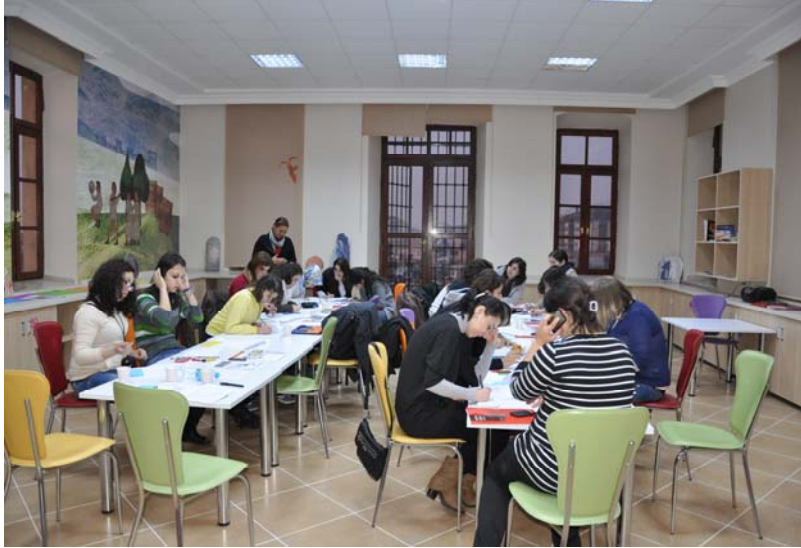
Resim 5.Çorum Müzesi Eğitim Atölyesi

Öğrenciler, Çorum Arkeoloji Müzesi'nde gördükleri ve etkilendikleri bir nesneyi seçerek bir eser tanıtım kartı hazırlamış ve esere ilişkin kendi duygularını yazarak bir mektup haline getirmişlerdir. Her iki etkinlikte de istasyon yöntemi kullanılmış ve her iki grubunda etkinliklere dönüşümlü ve aktif katılımı sağlanmıştır. Sikke ve Mühür Tasarımı ve İngiltere'den Mektup Var etkinliklerinde öğrenciler tarafından tasarlanan çalışmalar müze atölyesinde sergilenmiştir. Çorum Müzesi inceleme gezisi, ikinci gün gerçekleştirilen Alacahöyük Ören Yeri ve Alacahöyük Müzesi, Boğazköy Ören Yeri ve Boğazköy Müzelerinin ziyaret edilmesiyle noktalanmıştır.