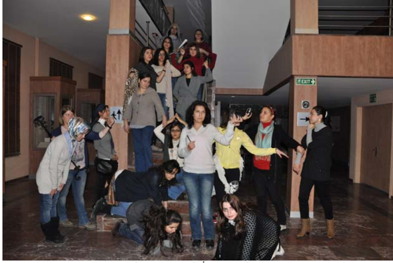
Resim 4. Donuk İmge Çalışması