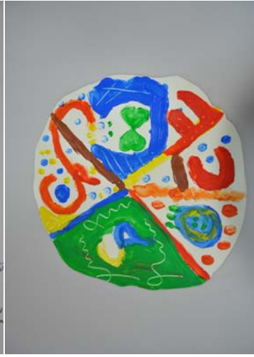
Resim 8. Mühür Tasarımı

Çorum Müzesi'nde Bir Şeyler Oluyor Projesi kapsamında 09-13 Nisan 2012 tarihleri arasında Ankara Üniversitesi Müze Eğitimi Anabilim Dalı'nın liderliğinde Müze Eğitimi konferansı ve müzede yaratıcı drama, performans sanatları ve küratörlük eğitimleri verilmiştir. Eğitimlere Türkiye genelindeki 15 müzeden 45 müze uzmanı ve Çorum Milli Eğitim Müdürlüğü'ne bağlı 60 resim ve müzik öğretmeninden oluşan 105 kişi katılmıştır.