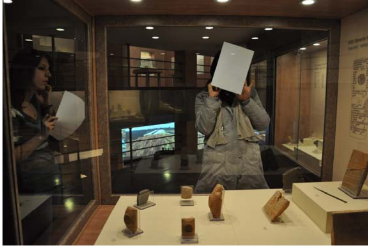
Resim 3. Ara-Bul Çalışması

öğrenmiş ve arkadaşlarına aktarmışlardır. Müze uzmanı süreç boyunca öğrencileri müze ve nesnelere hakkında bilgilendirmiştir.