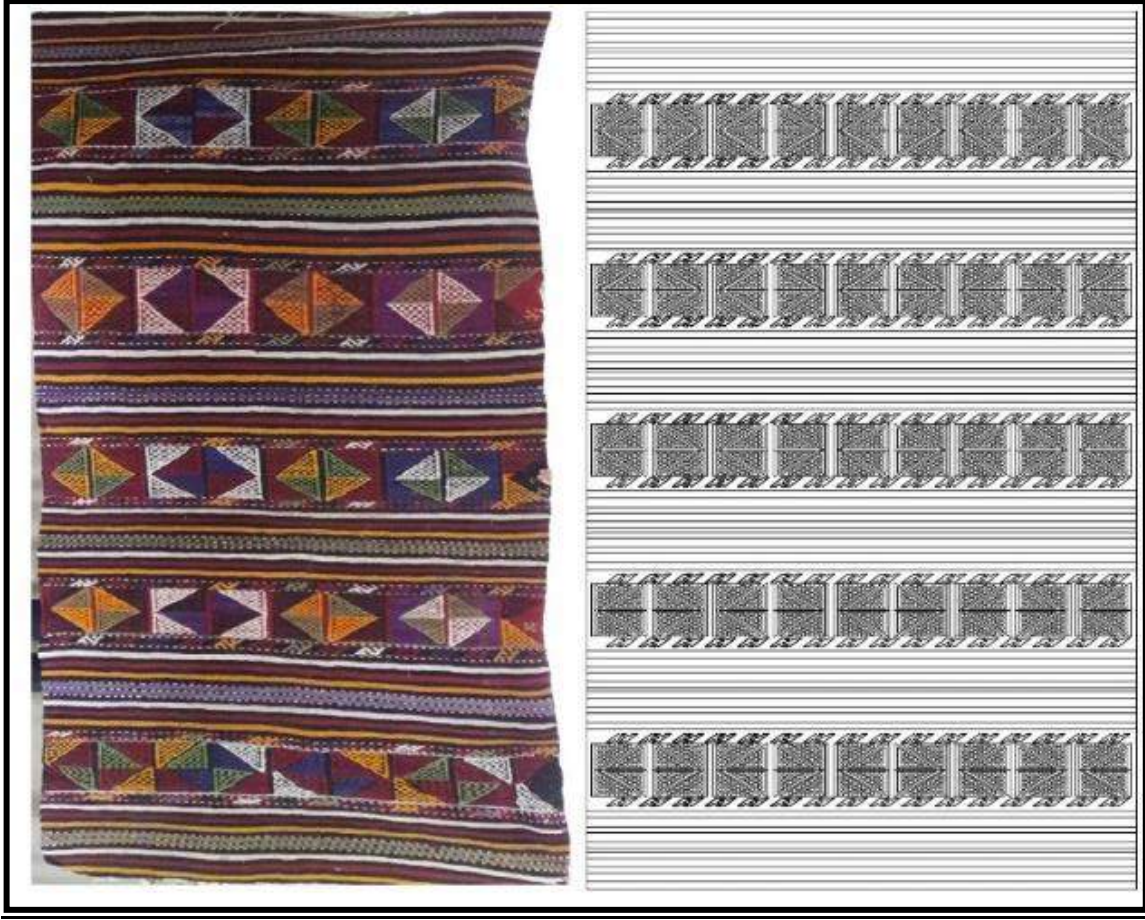
Resim 5. İğsıran (Isıran) Kilimi

Kilimlerde kırmızı, bordo, mavi, lacivert, pembe, turuncu, sarı, hardal sarısı, siyah, beyaz ve yeşil tonları genellikle yüze eşit bir şekilde dağılmıştır. Çan kilim dokumalarının kompozisyon özellikleri ve teknik özellikleri bir biri ile benzer özellikler taşımaktadır. Kilimlerin boyutları kullanılacak alana göre değişiklik göstermektedir. Yaklaşık 10 yıl öncesine kadar koridorlar için yolluk boyutlarında kilimlerin dokunduğu ve hala günümüzde kullanıldığı bilinmektedir.