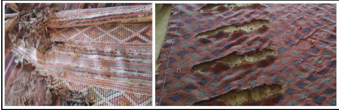
Resim 1. Rutubetten çürümüş düz dokuma örnekleri (Kalburcu Köyü, Çan, Yarmacı, 2016)

Kültür, varlığımızın ilişkilerini belirleyen, sosyal süreçte öğrendiğimiz uygulama ve inançların, maddi ve manevi öğelerin tamamıdır (Güvenç, 1984:101). Bir toplumun kültürü, o toplumun tarihi geçmişini, bireylerin hayatını, çeşitli zamanlardaki eylemlerini, geçinme ile ilgili ekonomik ve sosyal faaliyetlerini içermektedir (Hünerel ve Er,2012:180). Ulusların geçmişlerini, geleceğe bağlayan en önemli köprülerden birisi de kültür varlıklarıdır. Maddi kültür varlıkları arasında dokumacılık büyük bir yere sahiptir. Dokumacılık sanatı içinde düz kirkitli dokumalar, kendi arasında teknik açıdan, kilim, cicim, sumak, sili (zili) isimlerle çeşitlilik göstermektedir. Genellikle çadır, ev, saray, cami tabanlarında, eşyaların üzerinde, kapı ve pencere önlerinde yaygı ve örtü olarak kullanılmışlardır. Çoğunlukla koyunyünü, keçi kılı, deve yünü, pamuk ve bazen bunların arasında keten, ipek, sırma ipliklerinden oluşan atkı, çözü ve desen ipliklerinin çeşitli şekillerde birleşmesi ile meydana gelen dokumalardır. Kendine has teknikleri, renk ve kompozisyon özellikleri bakımından zengin olan bu dokumalar, kullanılan doğal hammadde özelliklerinden dolayı rutubet etkisi altında çürümeye maruz kalmakta ve zamanla kullanılamaz hale gelmektedir (Resim 1). Bu nedenle düz dokuma yaygılar halı kadar dayanıklı olmadığı ve çabuk yıprandığı için eski örnekleri günümüze kadar ulaşmamakta, tarihi aydınlatabilecek çok eski örnekleri yok olup gitmektedir (Aytaç, 1989:36).