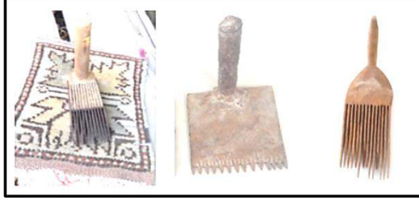
Resim 3. Çan yöresinde kullanılan kirkit örnekleri

Dokuma sırasında çözümlerin arasından geçirilen atkı ipliklerini sıkıştırmak için, yörede tamamen ağaç veya metal ve tutma yeri ağaç, dişli kısmı metal olan kirkitler kullanılmıştır (Resim 3).