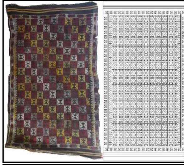
Resim 7. Zülüfçük çul kompozisyon çizimi

Çul dokumaların kompozisyon özellikleri ağırlıklı olarak geometrik şekiller içermektedir. Dokumanın yüzeyi baklava dilimi gibi motiflerle bezenebildiği gibi; kare, dikdörtgen, altıgen, çubuk ve vev motif dizilimine de rastlanmaktadır (Resim 8). Çul dokumalarda kullanılan renkler, kilim dokumalarda kullanılan renklerle benzerlik göstermektedir.