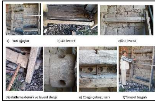
Resim 2. Çan yöresi ıstar tezgâhı (Karakoca Köyü, Yarmacı,2017)

Çan düz dokumalarında evde, açık ya da kapalı ortamlarda kolayca kurulabilen ve oldukça basit bir dokuma prensibine sahip olan ıstar tezgâhı kullanılmaktadır. Bölgedeki bu tezgâhlar iki yan tahta (a) ve bu yan tahtalardaki alt ve üst oyuklara yerleştirilen iki levent (b,c), bir çözgü gücüsü, bir ağızlık gücüsü ve bir varan gelenden (f) oluşmaktadır. Yörede kullanılan tezgâhlar ahşap malzemeden yapılmıştır (Resim 2).