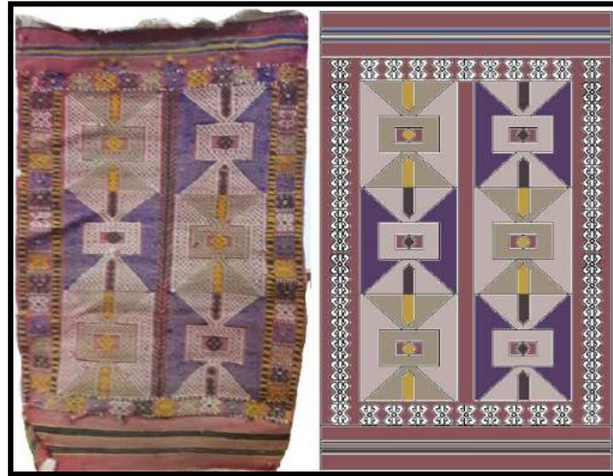
Resim 16. İğsıracık seccade ve kompozisyon çizimi

Seccade Dokumalar: Çan bölgesindeki çoğu eski dokumalar tüccarlar tarafından yerine naylon halı, kilim verilerek toplanmıştır. Bu sebeple ulaşılmış örneklerin halkın elinde kalan ve daha yakın tarihte dokunmuş örnekler olduğu bilinmektedir. Fakat seccade dokumalar, genellikle kuşaktan kuşağa aktarılması, miras olarak kalması geleneği sayesinde bu değişimde tamamen yok olmamıştır.