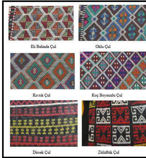
Resim 8. Farklı çul motifleri örnekleri

Çul dokumaların kompozisyon özellikleri ağırlıklı olarak geometrik şekiller içermektedir. Dokumanın yüzeyi baklava dilimi gibi motiflerle bezenebildiği gibi; kare, dikdörtgen, altıgen, çubuk ve vev motif dizilimine de rastlanmaktadır (Resim 8). Çul dokumalarda kullanılan renkler, kilim dokumalarda kullanılan renklerle benzerlik göstermektedir.