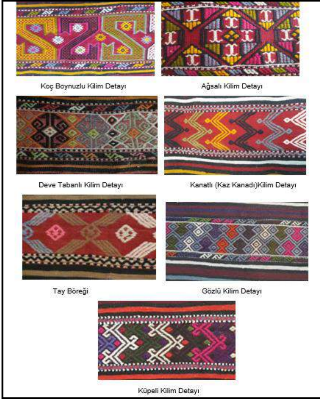
Resim 6. Çan yöresi kilim motifleri örnekleri

Çul Dokumalar: Çan yöresinde atkısı çözüğü keçi kılı, ilave desen atkısı yün olan dokumalara “çul” adı verilmektedir. Bu dokumalarda sık/seyrekleme ve düz, çapraz zili teknikleri kullanılmıştır. Çul dokumaların kompozisyonlarında baş ve son kısımlarında geniş bordür, kenar kısımlarında ince bordür bulunmaktadır.