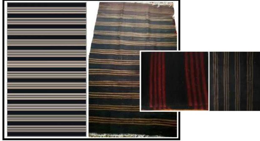
Resim 15. Kıldan dokuma ve kompozisyon çizimi

dokumalarda ağırlıklı olarak siyah, ince çubuklarda ise koyu kırmızı, koyu kahverengi vb. gibi kırı daha az gösteren renkler kullanılmıştır.