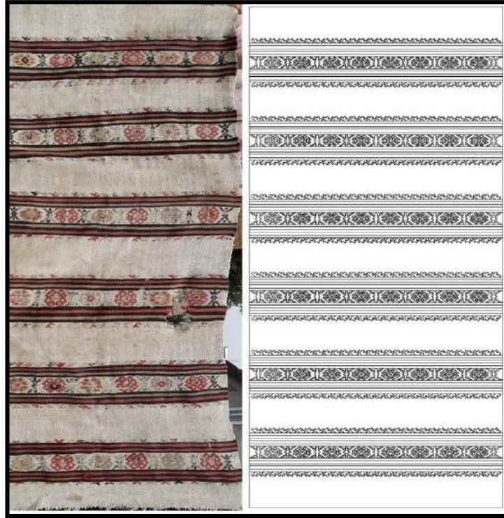
Resim 11. Çöpten dokuma ve kompozisyon çizimi (Başaran,2017)

Çöpten Dokumalar: Çan bölgesi düz dokumalarında kullanılan ipliklerin, günlük ihtiyaçlardaki kullanım alanına göre özenle seçildiği sahada yapılan inceleme sonucu elde edilen sonuçlar arasındadır. Dağlık bir araziye sahip bir bölgede yaşayan halk ihtiyaçlarını kendi yöntemleri ile karşılamıştır. Buğdaylarını yıkayıp kurutarak değirmenlerde un yaptırmışlardır. Buğday yıkama işlemini dere kenarlarında yaptıkları için suya dayanıklı ve nemi emen yaygılara ihtiyaç duyulmuştur. Bu ihtiyaç doğrultusunda ürettikleri, çözgüsü pamuk ve keten karışımı veya sadece pamuk, atkısı keten, yün ve ilave desen atkısı yün olan düz dokumalara yörede “çöpten” denmektedir.