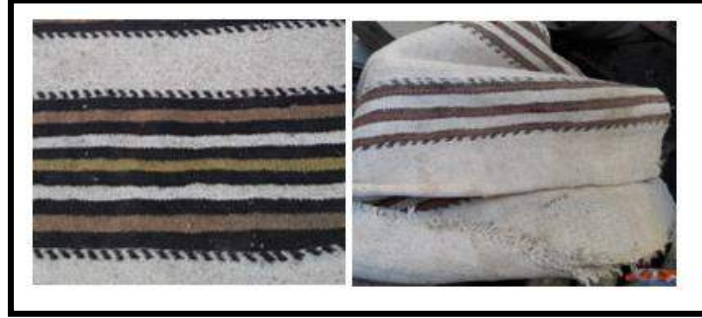
Resim 13. Çöpten dokuma örnekleri

Yörede kilim tekniği ile dokunmuş dokumalar da mevcuttur (Resim 16). Bu dokumalar geçmişte yöre deyimleriyle dışarı işleri için dokunmakta ve evlerin içinde yaygı olarak kullanılmamaktadır.