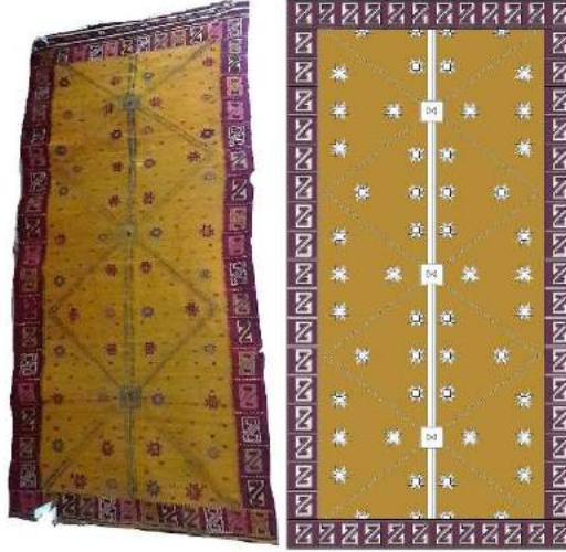
Resim 9. Sarı siisana kompozisyon çizimi (Yarmacı,2017).

ve taraklı siisanada kullanılmış olup mavi, kırmızı ve parmaklı siisanalarda bu tekniğe rastlanmamıştır.