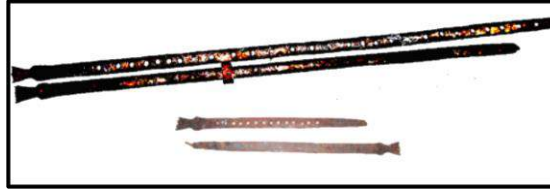
Resim 4. Çan yöresinde kullanılan çimbar örnekleri

Dokumanın eninin daralmaması ve dokuma esnasında kıvrılma olmaması için değişik boyutlarda ayarlanabilen metalden yapılmış araçlara birçok yörede olduğu gibi Çan bölgesinde de “çimbar” denmektedir (Resim 4).