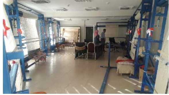
Resim 17. Çan Halk Eğitim Merkezi atölyesi