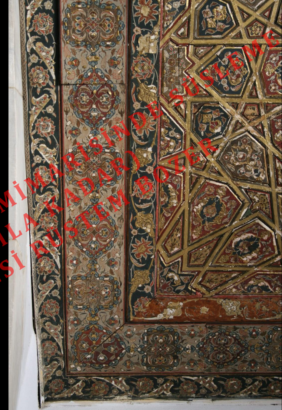
Manisa Muradiye Cami