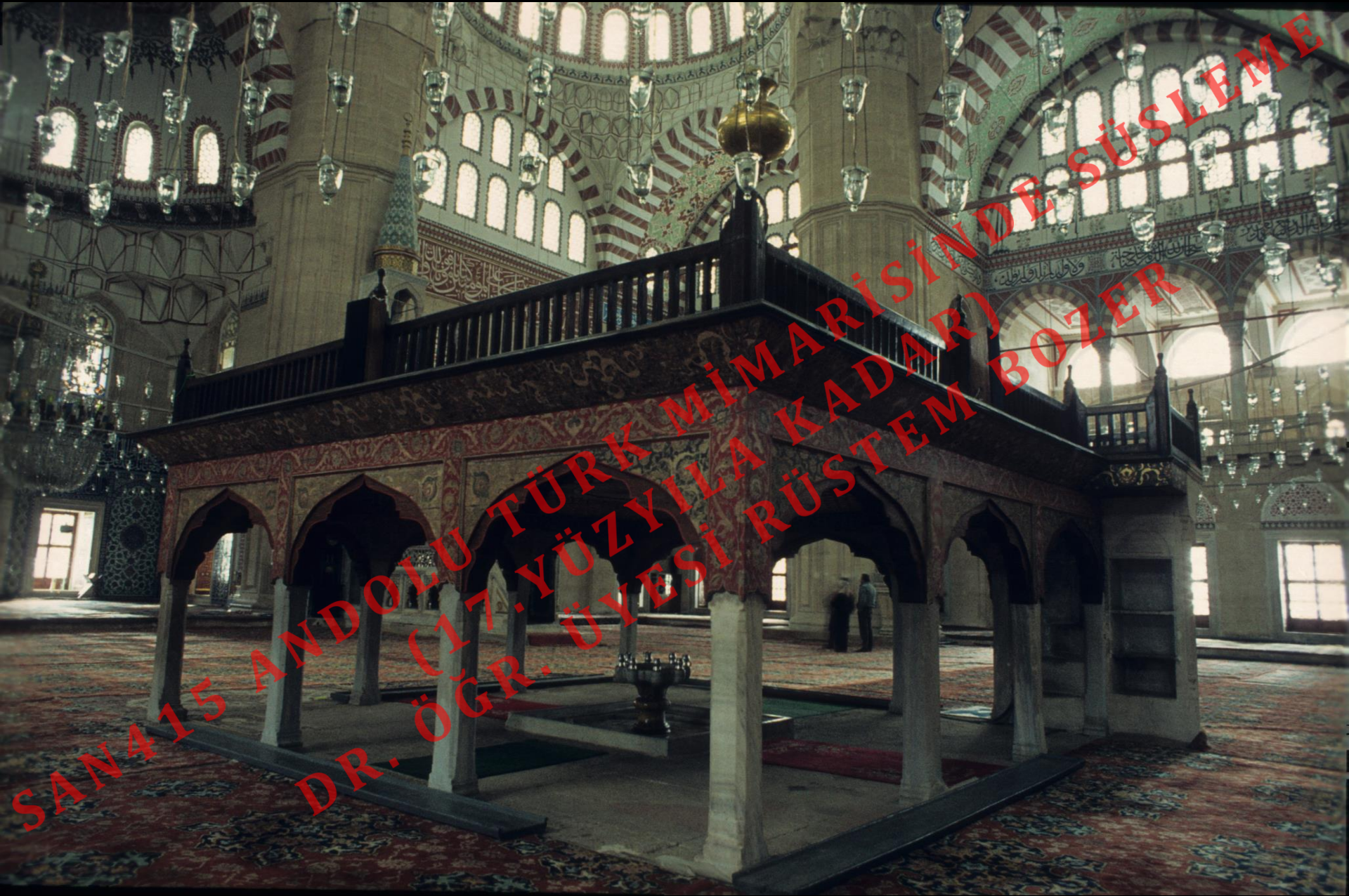
Edirne Selimiye Cami