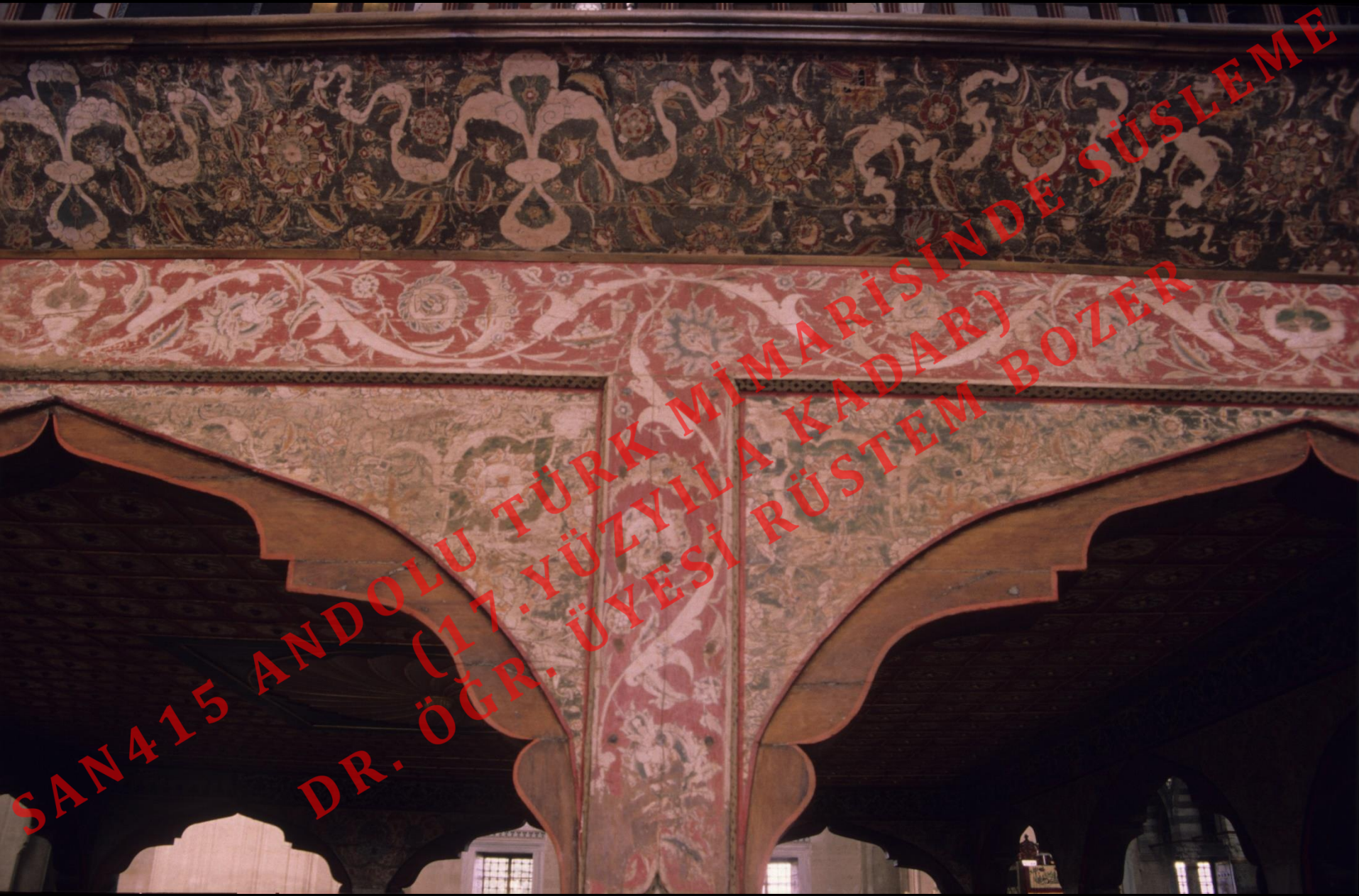
Edirne Selimiye Cami