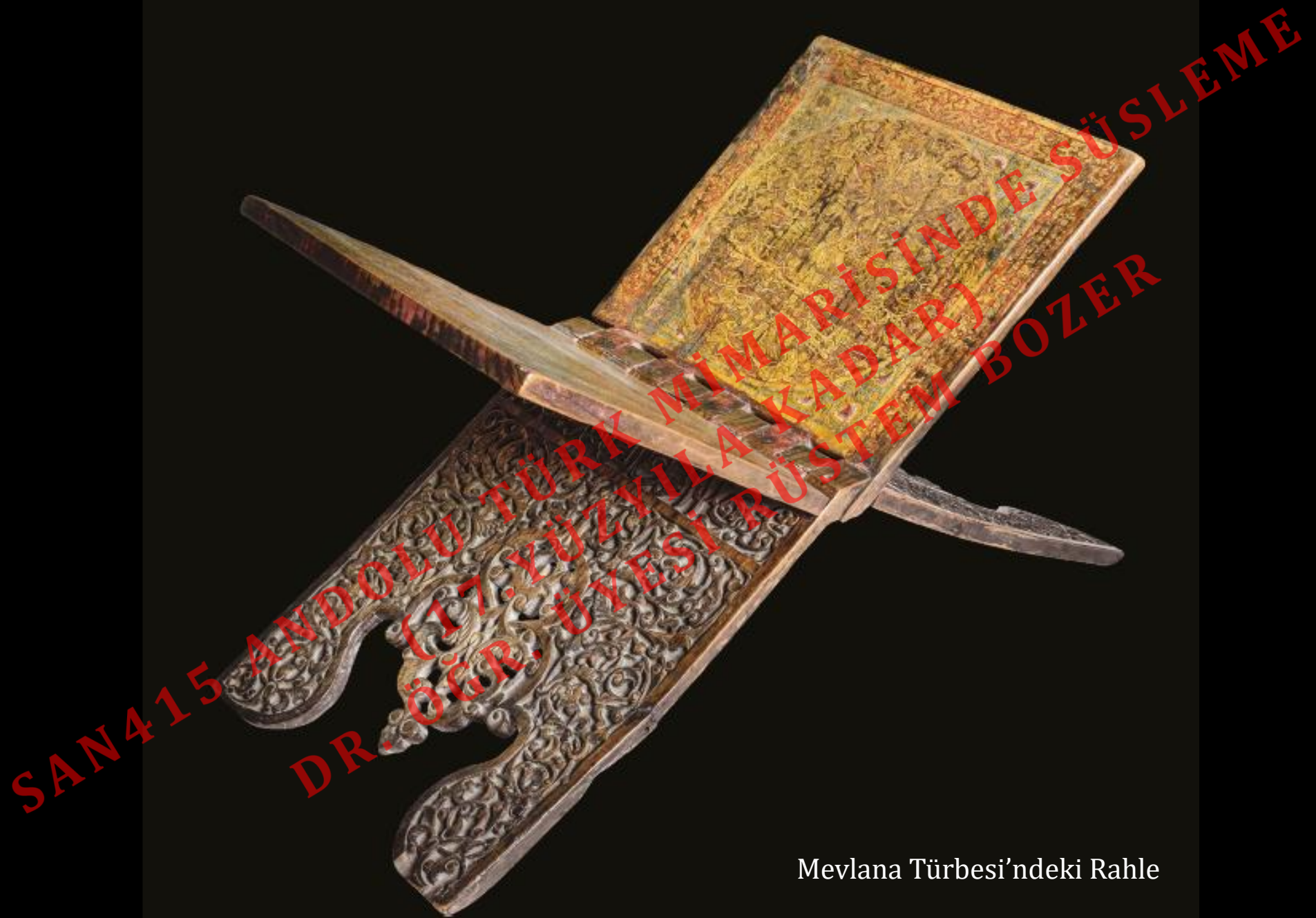
Mevlana Türbesi'ndeki Rahle