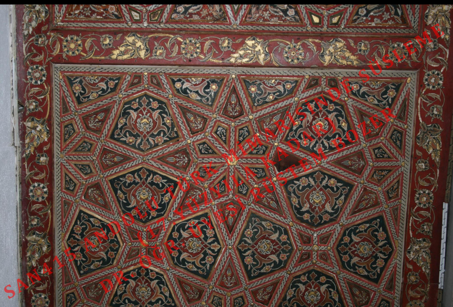
Manisa Muradiye Cami