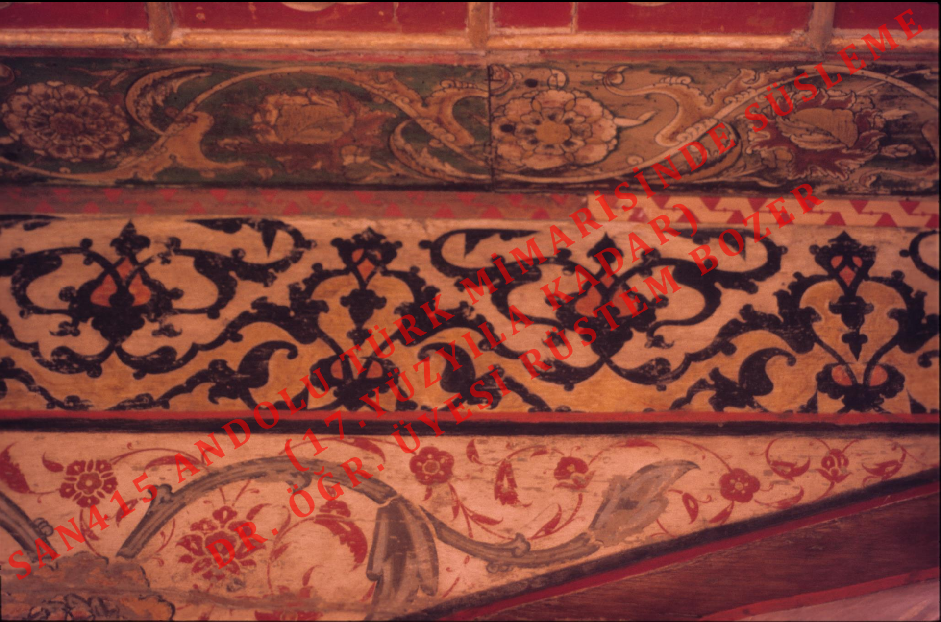
Edirne Selimiye Cami