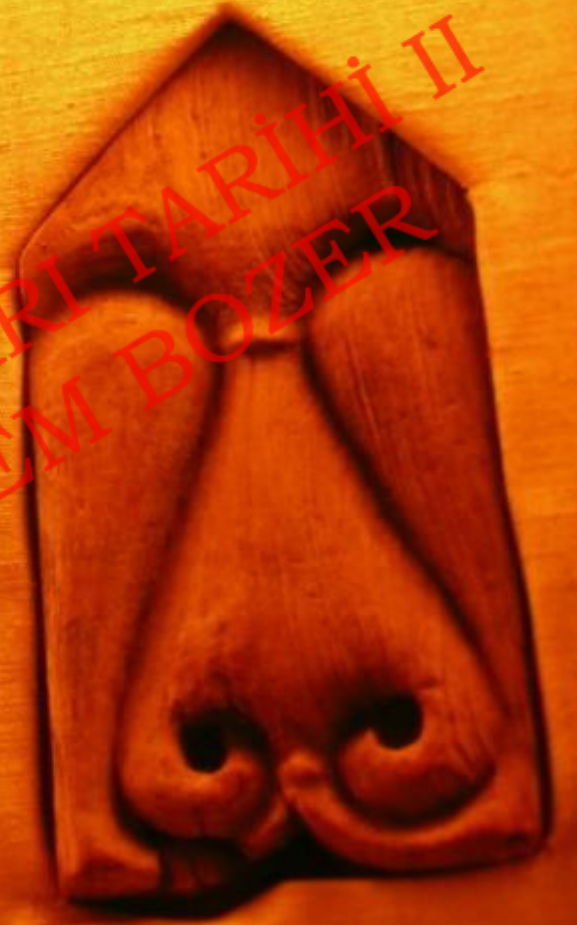
Eđri Kesim Tekniđi