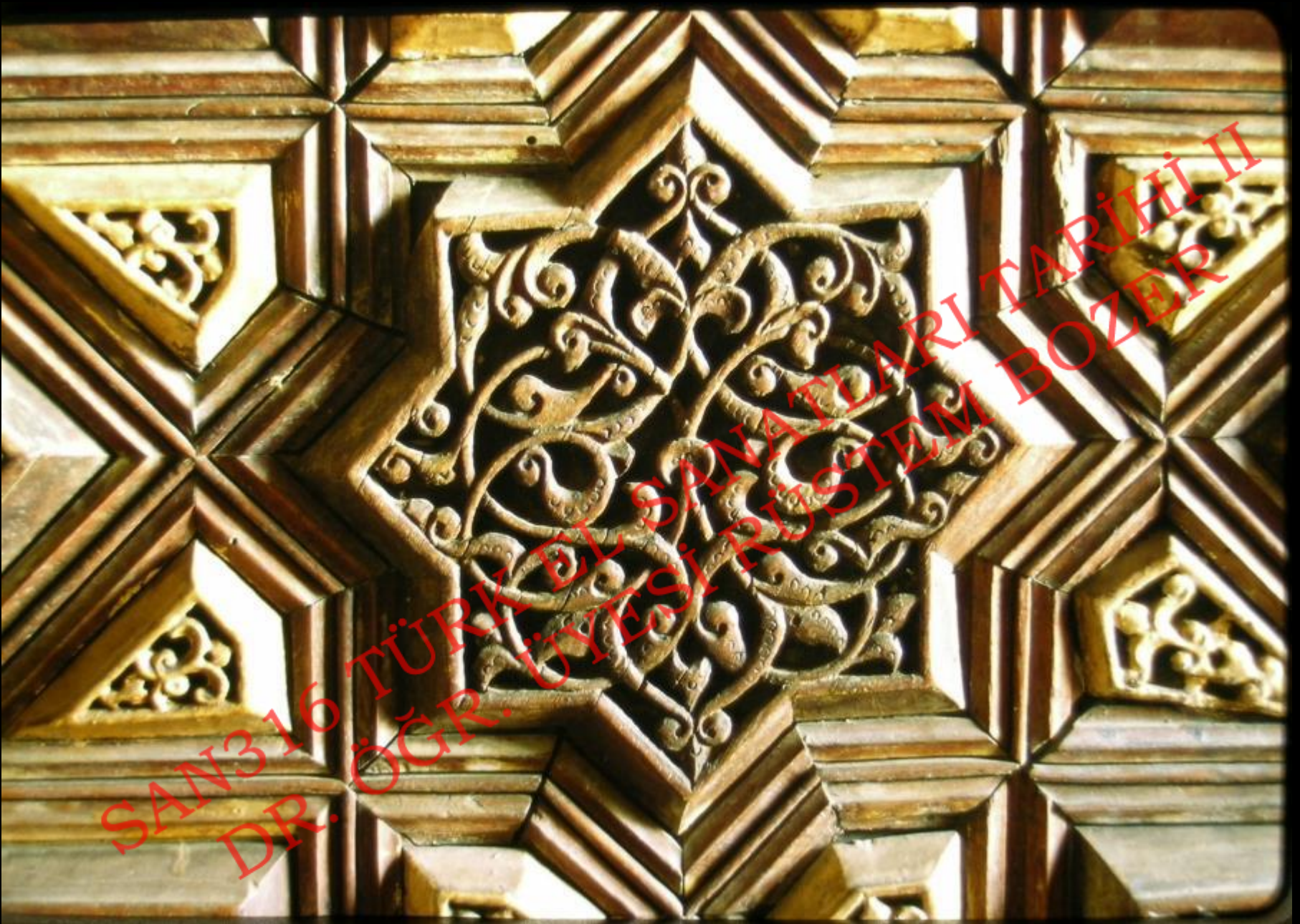
Yuvarlak Satırlı Oyma Tekniği