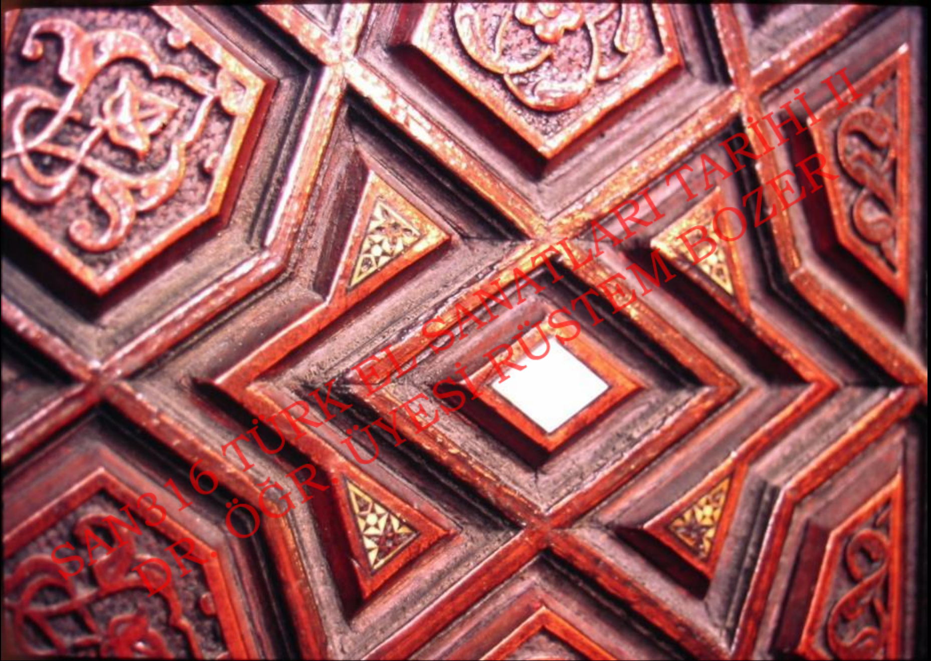
Kakma ve Tarsî Teknikleri