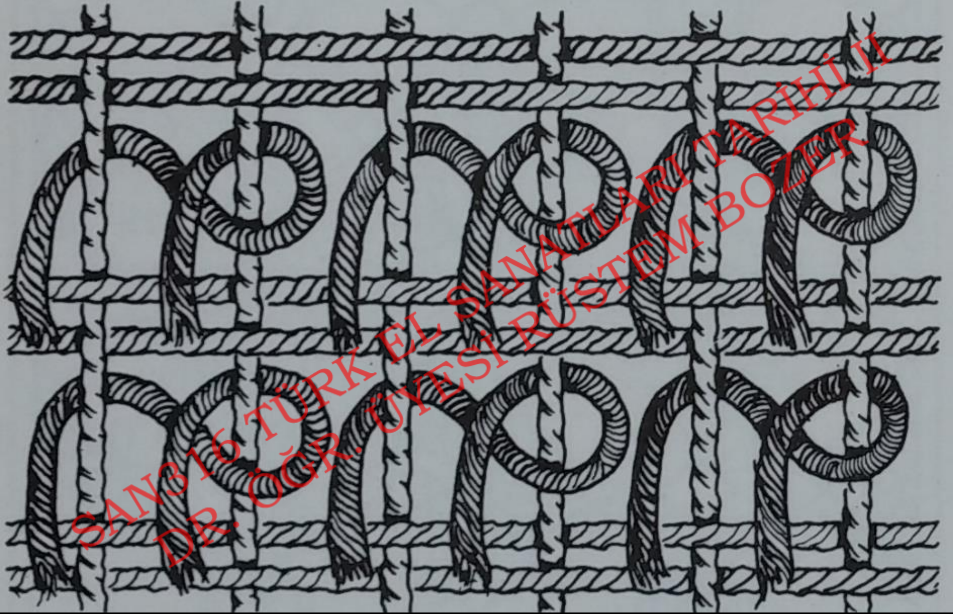
Sine Düğümü (Sağa Doğru)