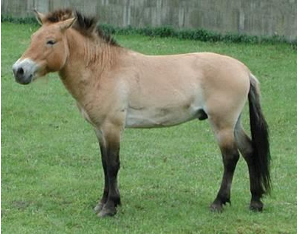
Przewalski's horse ( Equus caballus przewalskii )