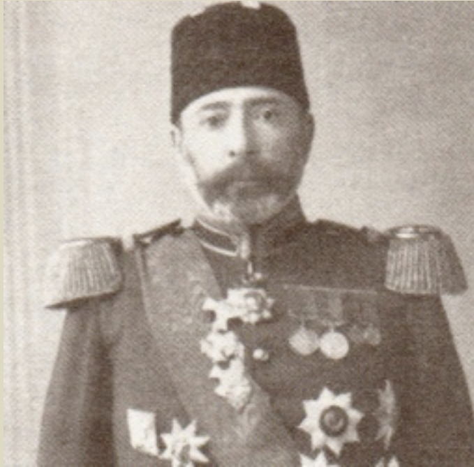
Sadrazam Ali Paşa

16.yy.'dan itibaren Saray'ın silah deposu olarak kullanılan Aya İrini Kilisesi'nin, Tophane Müşiri Fethi Ahmet Paşa tarafından düzenlenerek 1846 yılında ziyarete açılması, genellikle Türk Müzeciliğinin başlangıcı olarak kabul edilir. Müze, 1873 yılında, Aya İrini'den Çinili Köşk'e taşınır. Böylece, müzecilikte " toplamacılık " dönemi sona ermiş, " sergileme/inceleme " dönemi başlamıştır.