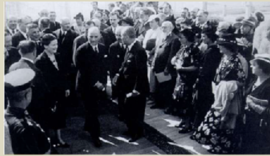
Dolmabahçe Sarayındaki Resim ve Heykel Sergisi'ne Geliş, 20 Eylül 1937