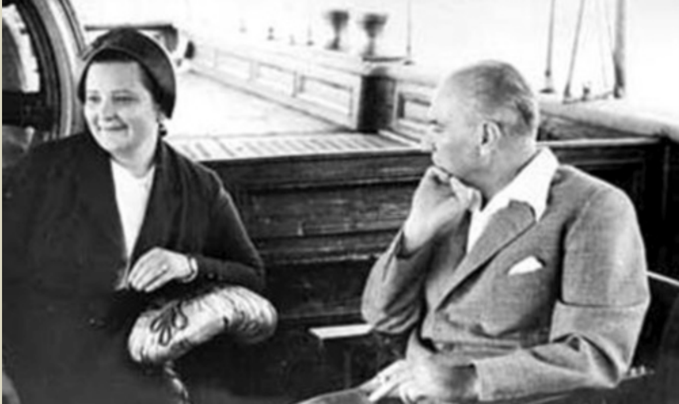
AFET İNAN İLE BİRLİKTE