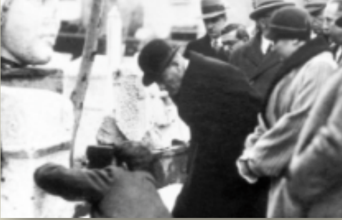
10 Şubat 1933, Topkapı Sarayı