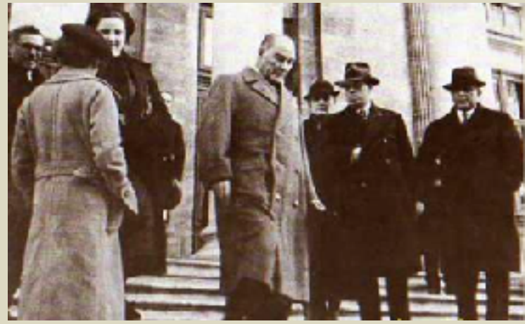
İstanbul Arkeoloji Müzesi Merdivenlerinde