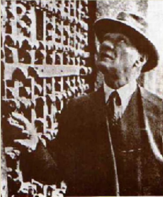
Diyarbakır'da Urfa Kapısı, 16 Kasım 1937