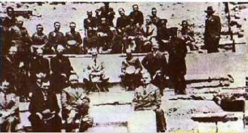
Bergama, 13 Şubat 1934