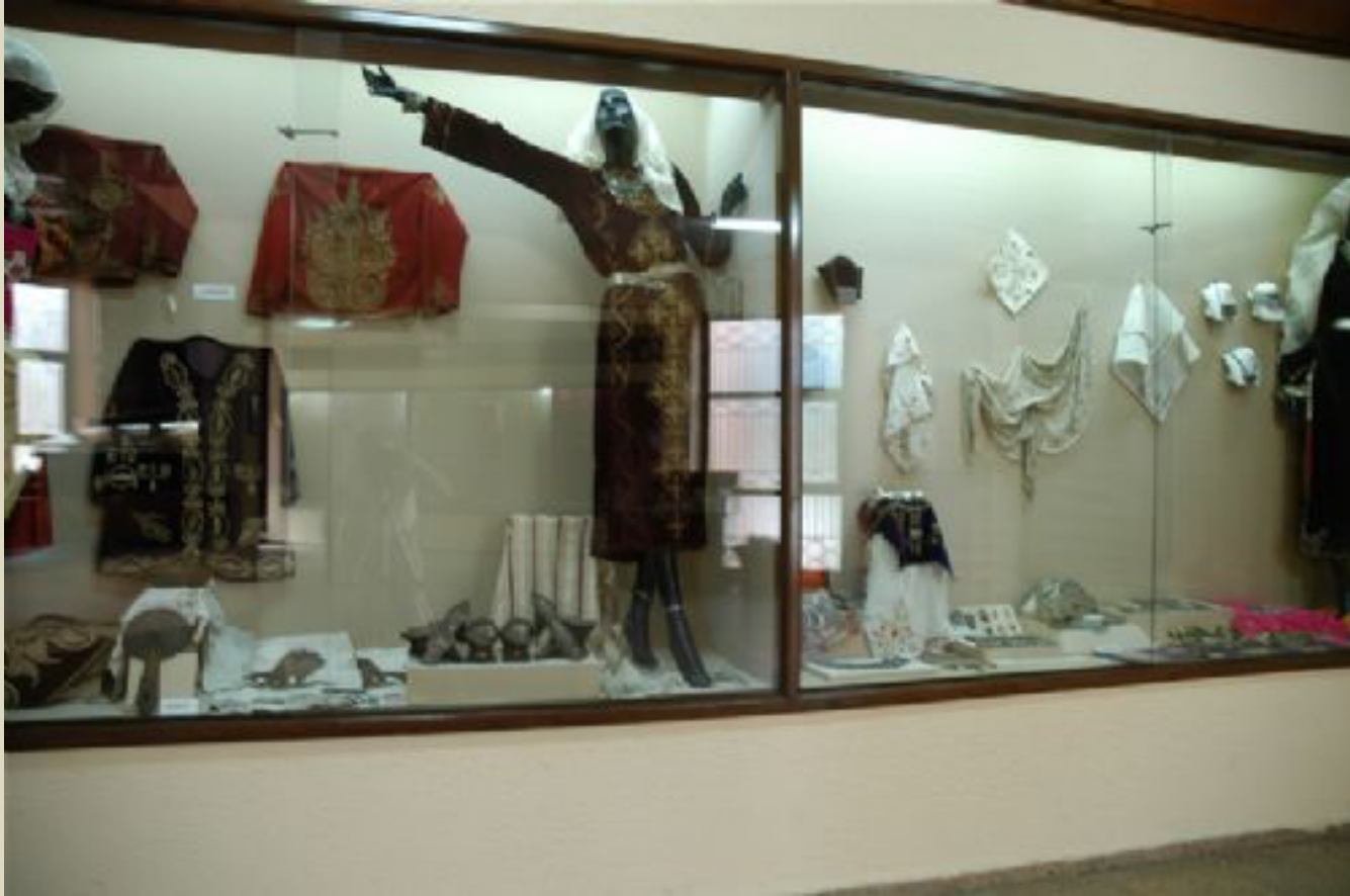
Ankara Etnografya Müzesi