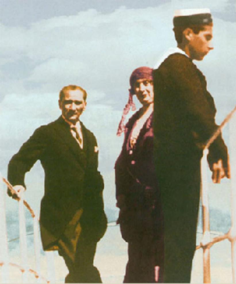
Yalova İskelesi, 15 Haziran 1930