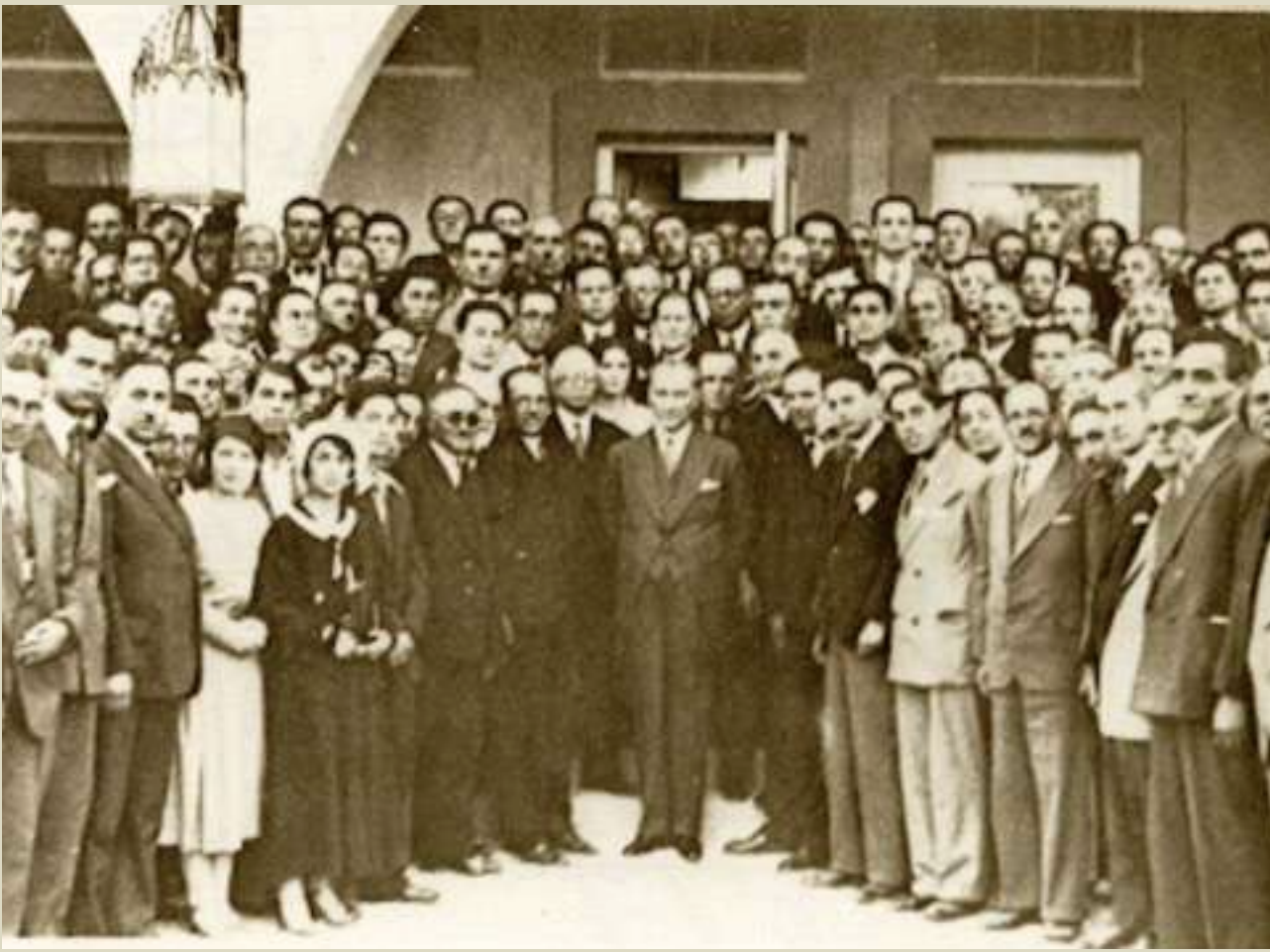
I. Türk Tarih Kongresi, Ankara, 8 Temmuz 1932