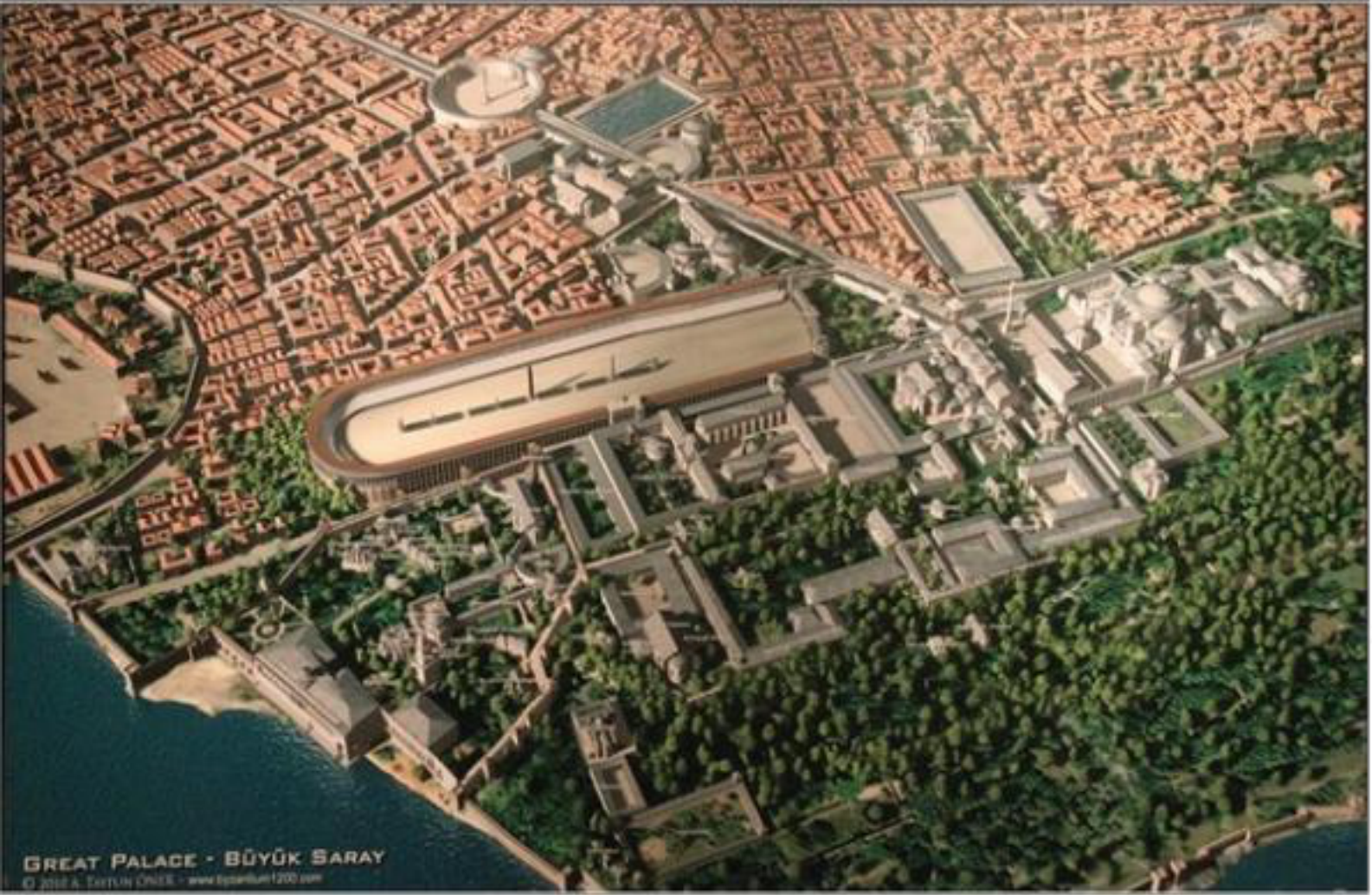
İSTANBUL HİPODROM TAMAMLAMA