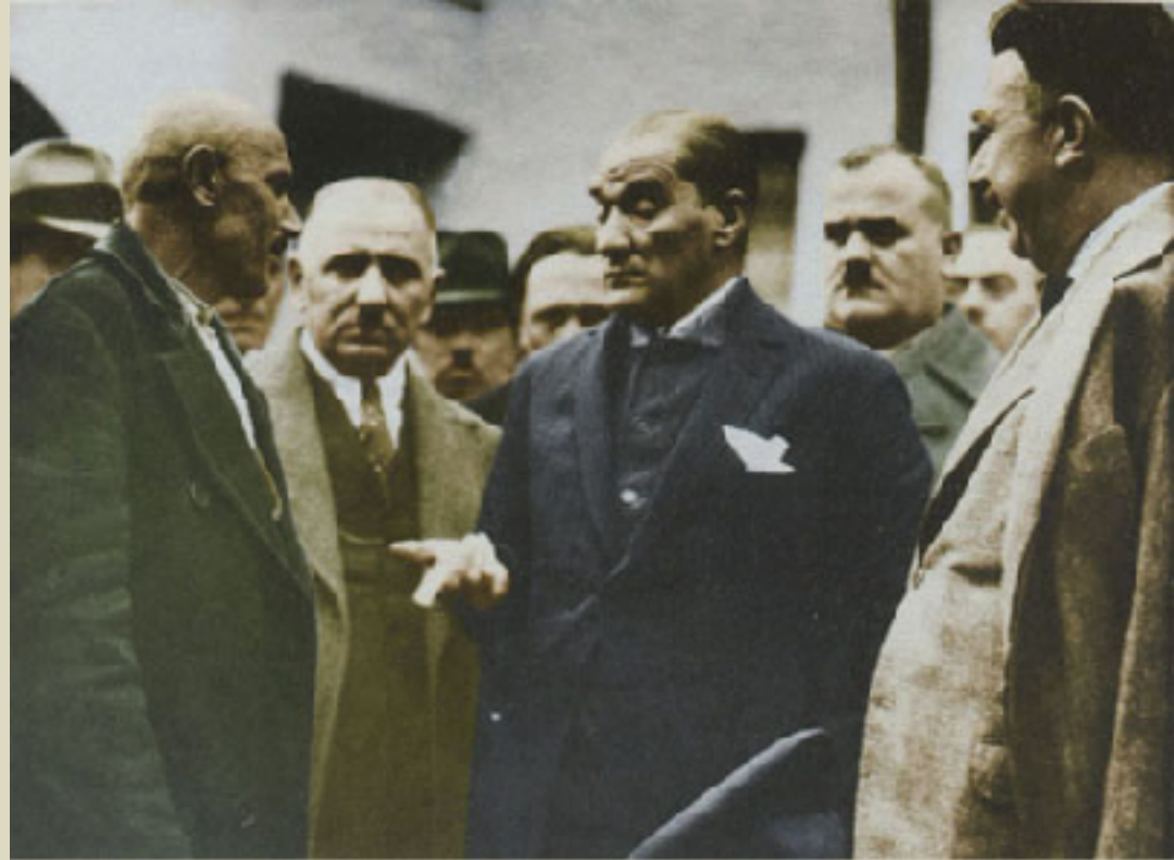
Kuzeydoğu Anadolu gezisinde Amasya'da vatandaşlarla... 22 Kasım 1930