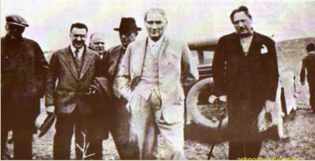
Atatürk, Milli Eğitim Bakanı Dr.Reşit Galip ile Ahlatlıbel Kazısı'nda 5 Mayıs 1933