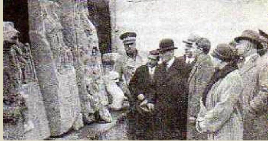
İstanbul Arkeoloji Müzesi, 10 Şubat 1933