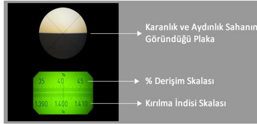
Şekil 1. Abbe refraktometresinden elde edilen görüntüler

Abbe refraktometresi en uygun ve en çok kullanılan refraktometredir. Abbe refraktometresinde iki prizmanın arasına kırılma indisi tayin edilecek madde sıvı film olarak yerleştirilir. Prizmalara gönderilen ışık ile, kritik açıdan daha küçük açı ile gelen ışınların oluşturduğu aydınlık bölge ve kritik açıdan daha büyük açıyla gelen ışınların oluşturduğu aydınlık bölge görülür.