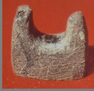
Şematik biçimli bukranium (Boğabaşı) motifi (kloritten)

Sürtmetaş buluntular arasında taş kaplar en genel buluntular arasındadır. Bunlar Hallan Çemi buluntularının neredeyse aynısıdır. Bunların kırık örnekleri yeniden şekillendirilip işlenerek üzerleri gravürlü levhalar haline getirilmişlerdir. Bunların kimisi de boynuz biçimli taşlara dönüştürülmüşlerdir.