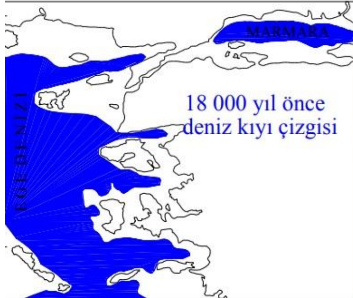
Küresel Soğuma (Buzul Çağı)