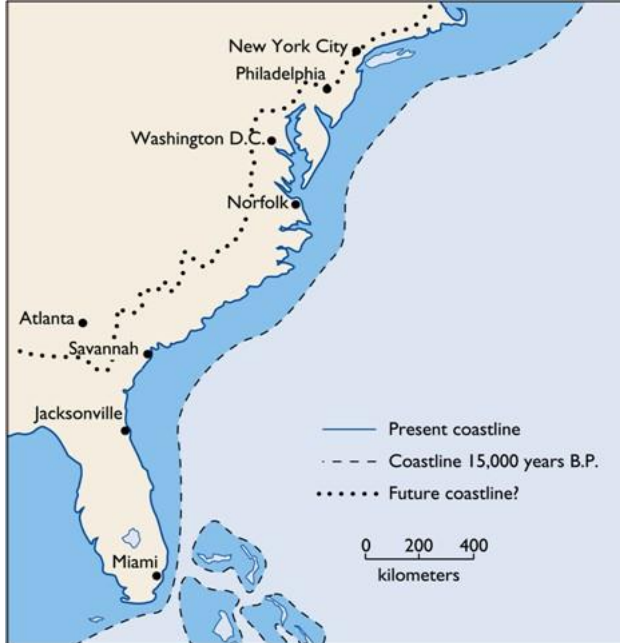
(a) COASTLINES PAST AND FUTURE