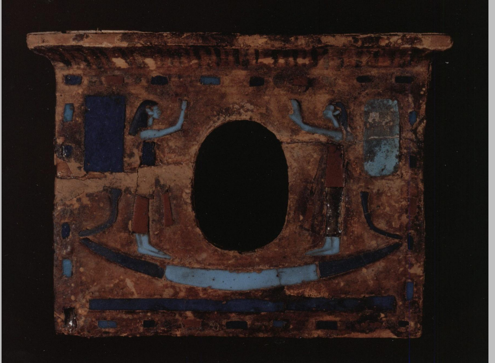
M.Ö. 10.-4.yy. h. 11.8 cm., gen. 15.7 cm.