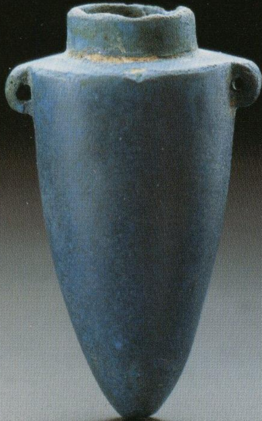
M.Ö. 8.-6.yy. h. 4.7 cm.