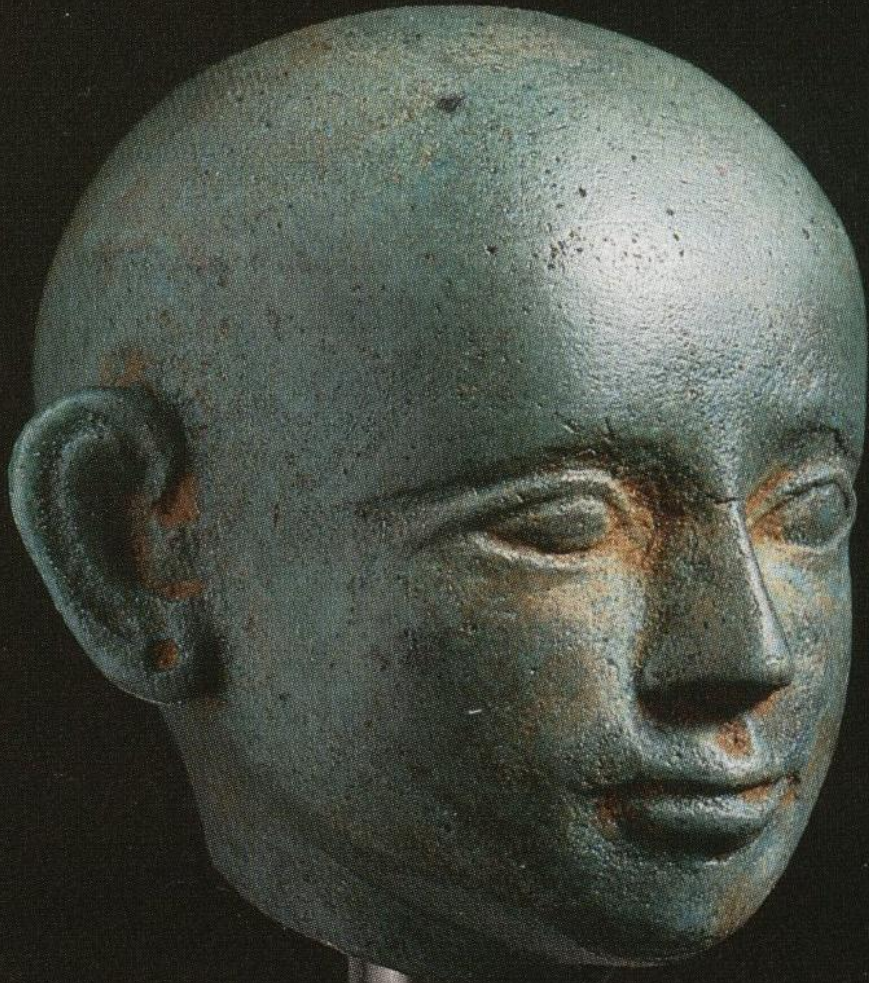
M.Ö. 10.-7. yy. h. 4 cm.