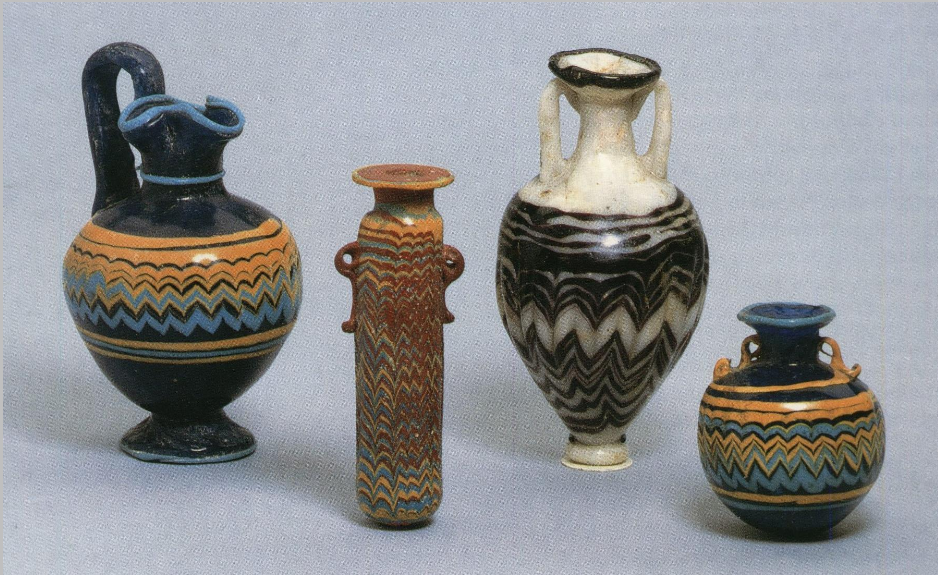
M.Ö. 6.-5. yy., Rodos