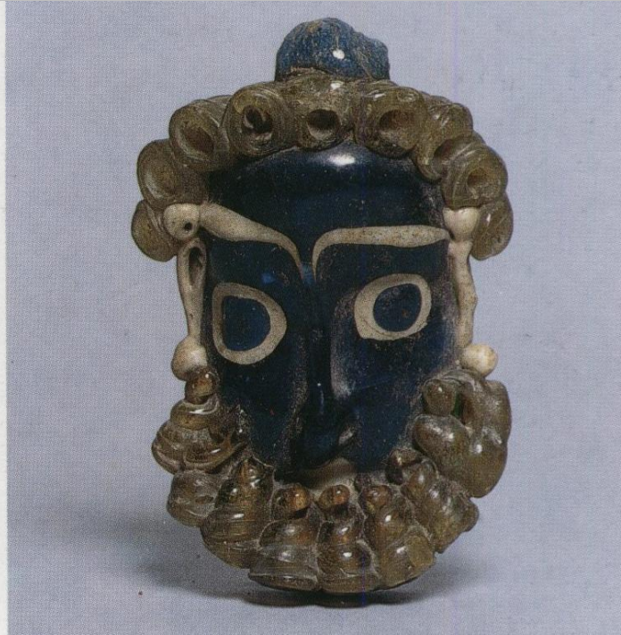
M.Ö. 4. yy. Fenike, Kartaca