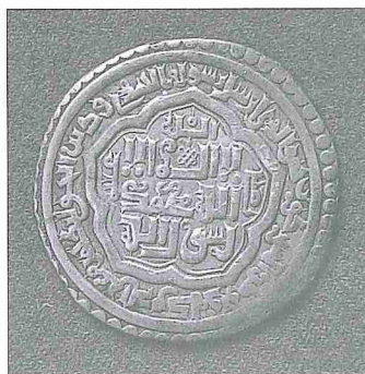
Gâzân Mahmud Han tarafından 701 (1302) yılında Bağdat'ta bastırılan gümüş sikke (İstanbul Arkeoloji Müzeleri, Teşhir, nr. 2219)

1316 yılında Olcaytu'nun ölümü üzerine tahta henüz çocuk yaştaki oğlu Ebü