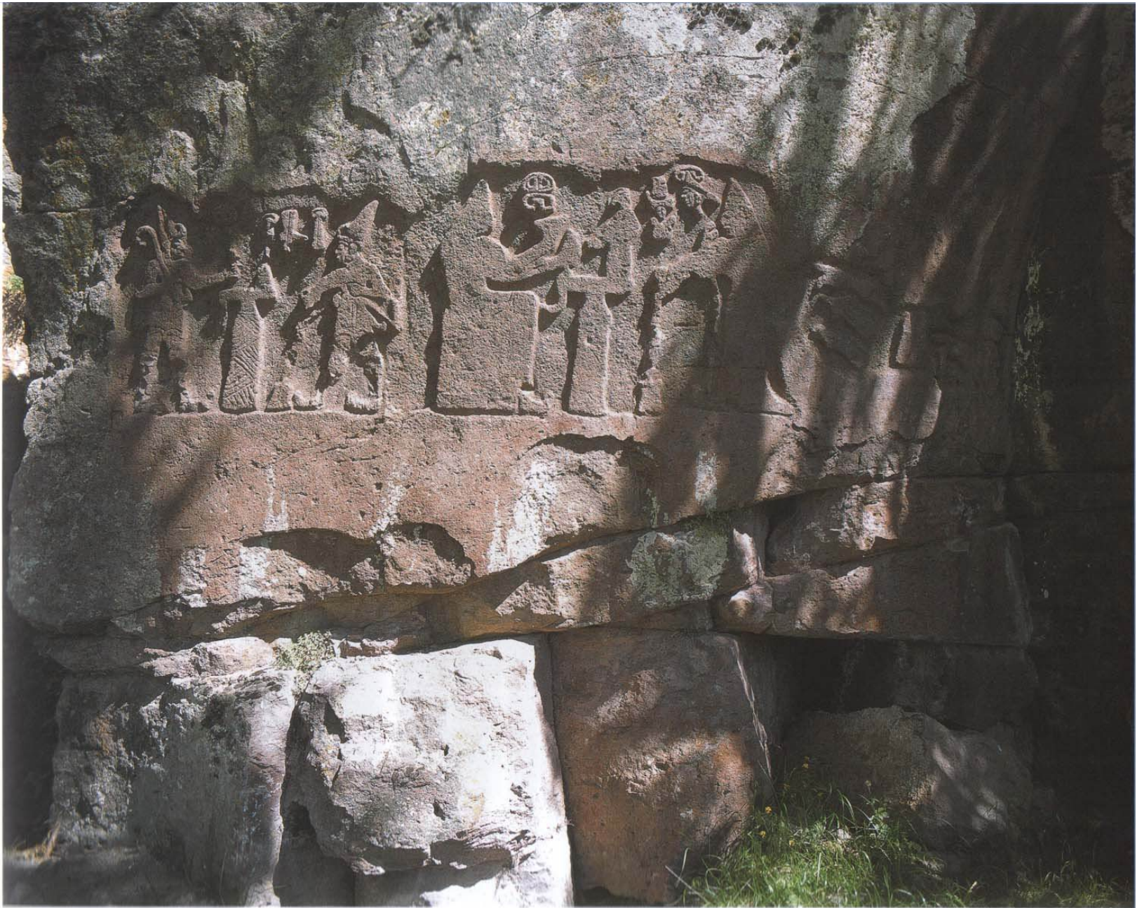
3 Das Felsrelief von Fraktin