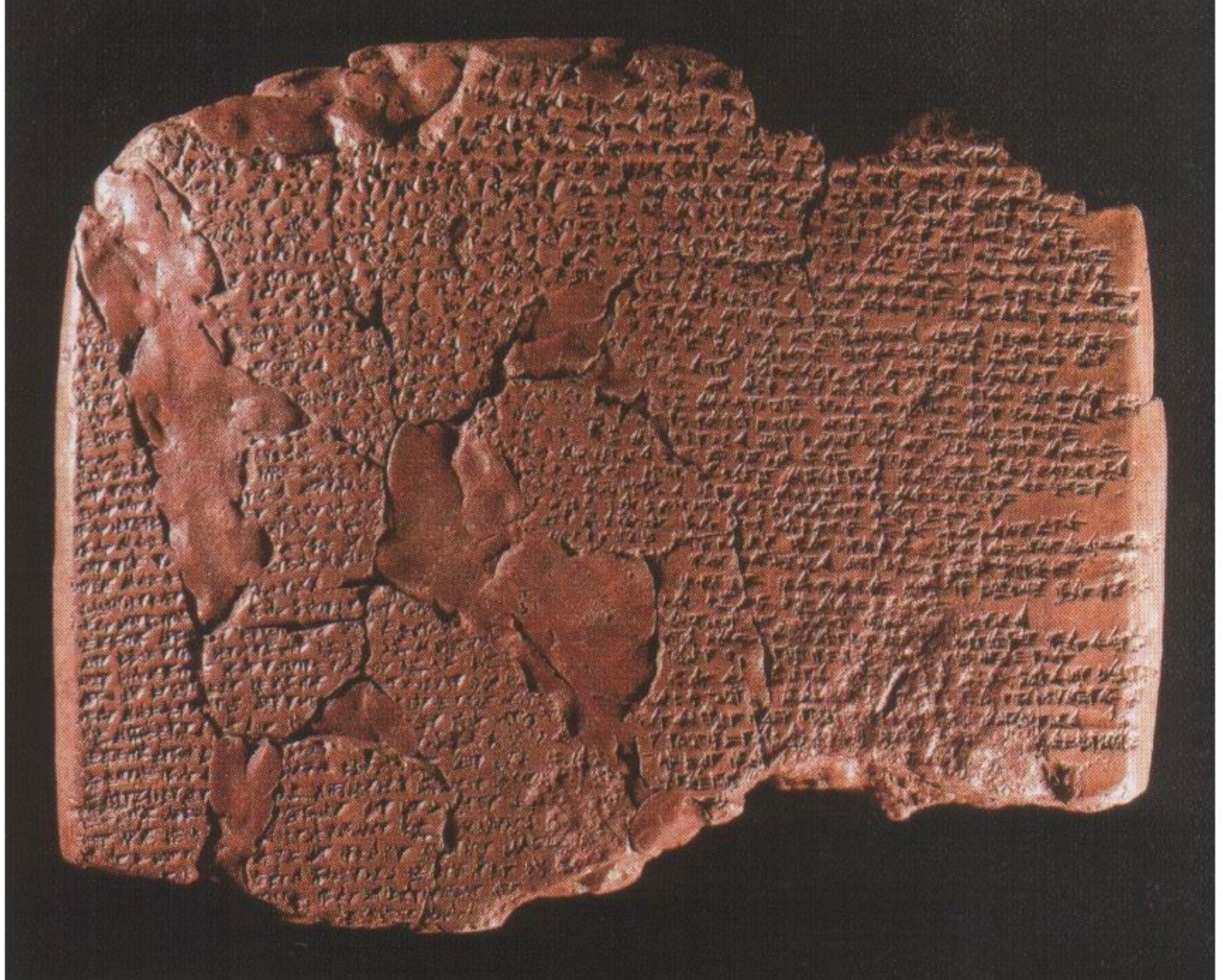
4 Der Vertrag, den Ḫattusili III. um 1259 v. Chr.