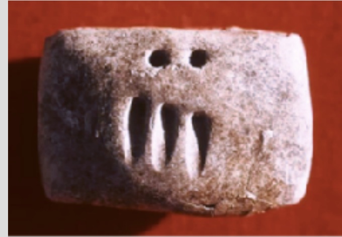
Godin Tepe, M.Ö.3200