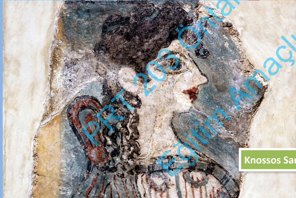
Knossos Sarayı, Kadın Figürü, Fresko