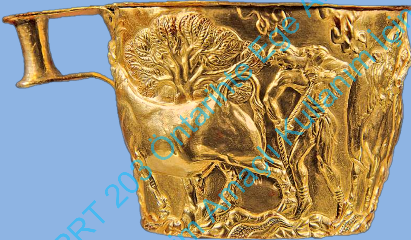
Girit, Altın 'Vahpeio Cup'