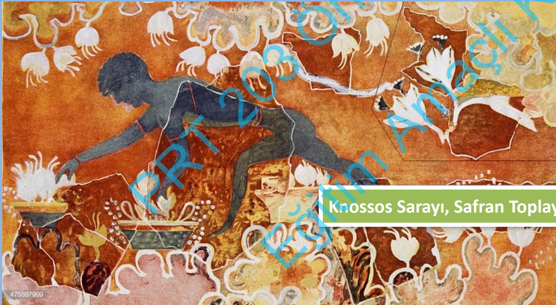
Knossos Sarayı, Safran Toplayanlar Freskosu