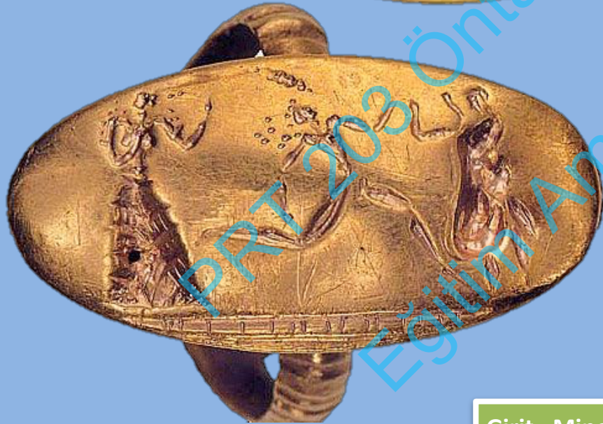
Girit , Minos Altın Yüzük Mühürleri