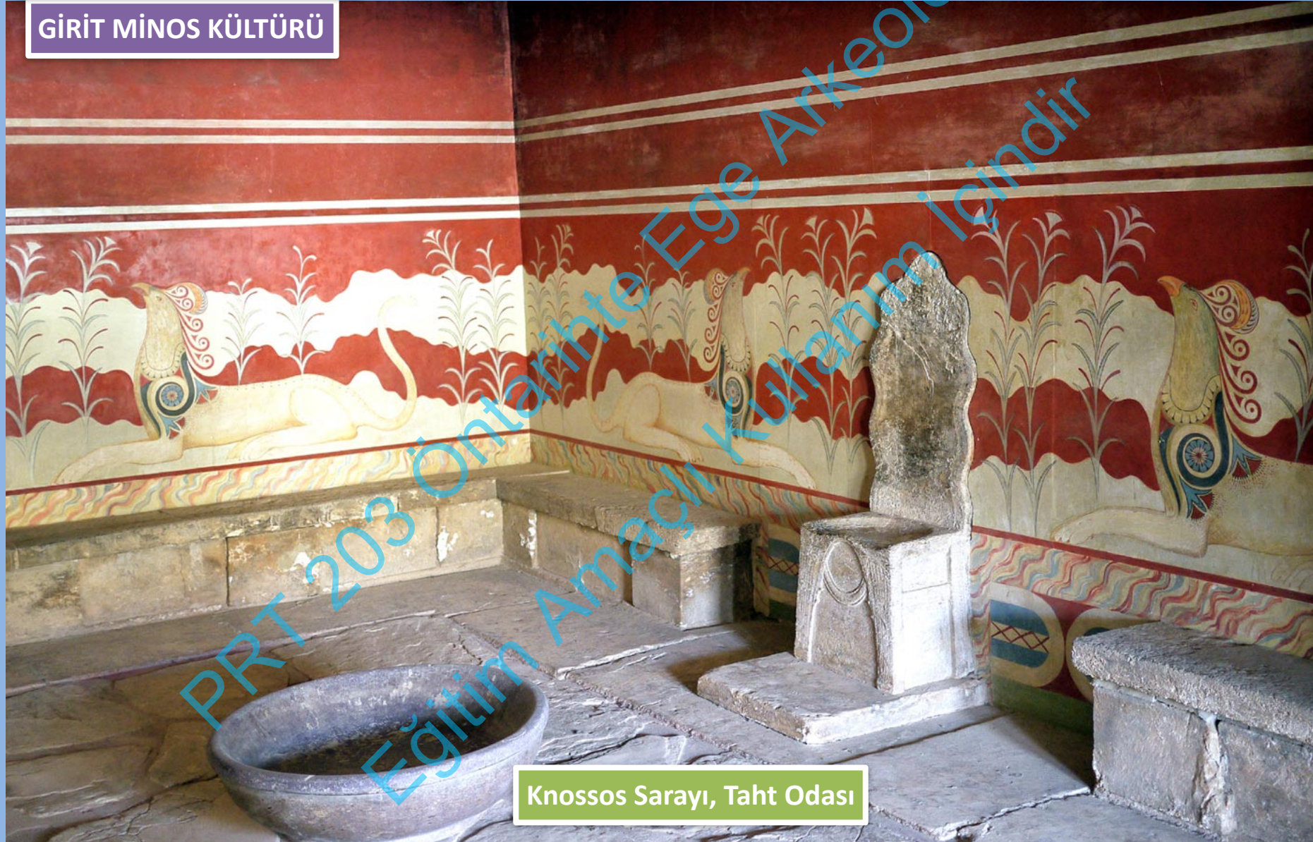
Knossos Sarayı, Taht Odası