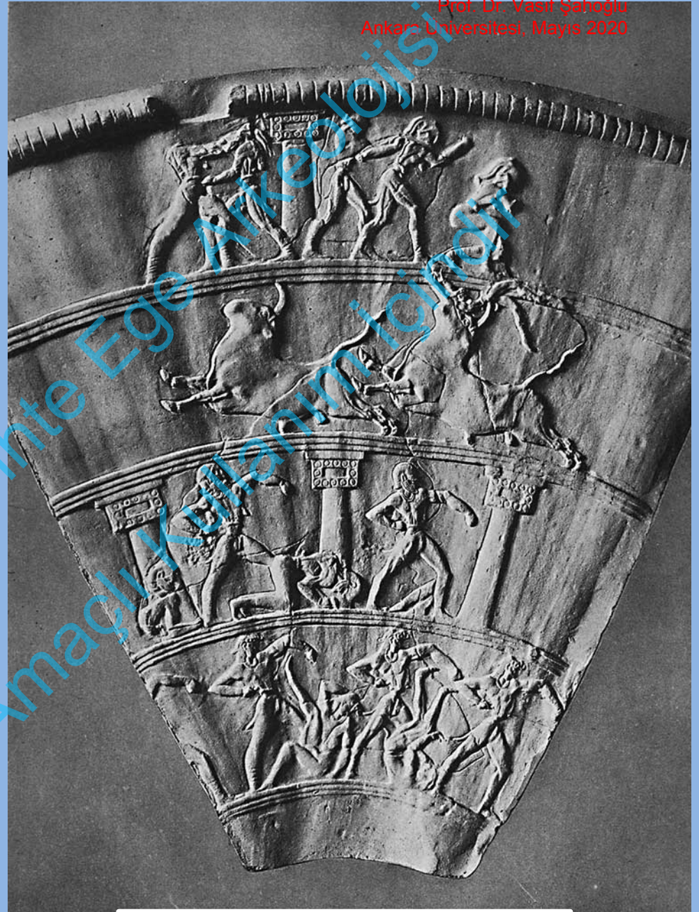
Ayia Trianda, Steatit Boxer Vazosu, GM I