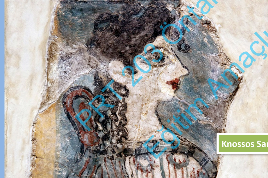
Knossos Sarayı, Kadın Figürü, Fresko