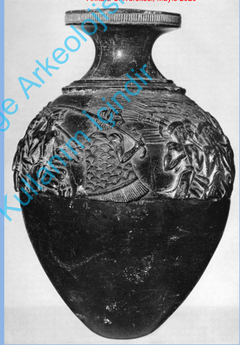
Ayia Trianda, Steatit Kap 'Hasat Vazosu', GM I