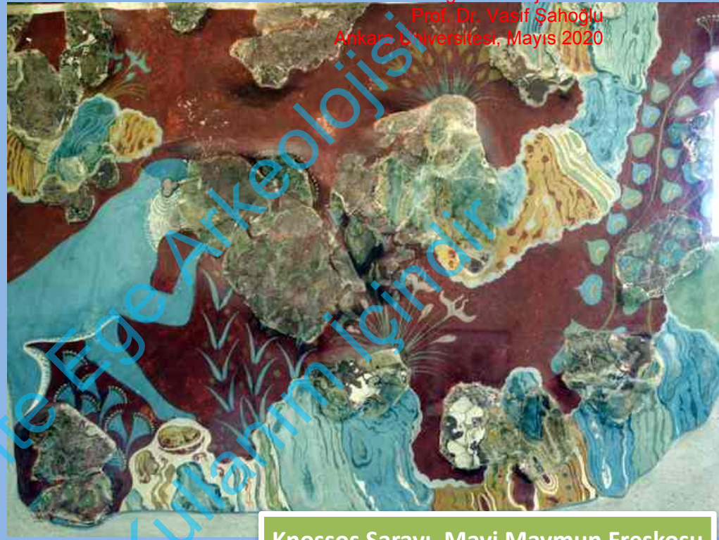
Knossos Sarayı, Mavi Maymun Freskosu