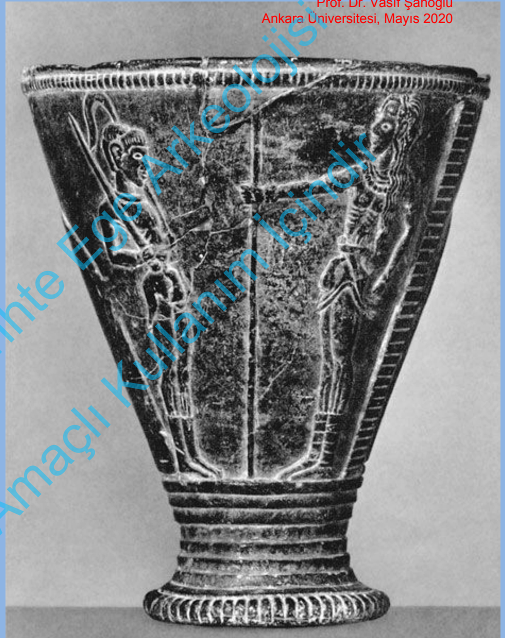
Ayia Triada, Steatit Kap 'Chieftains Vase', GM I