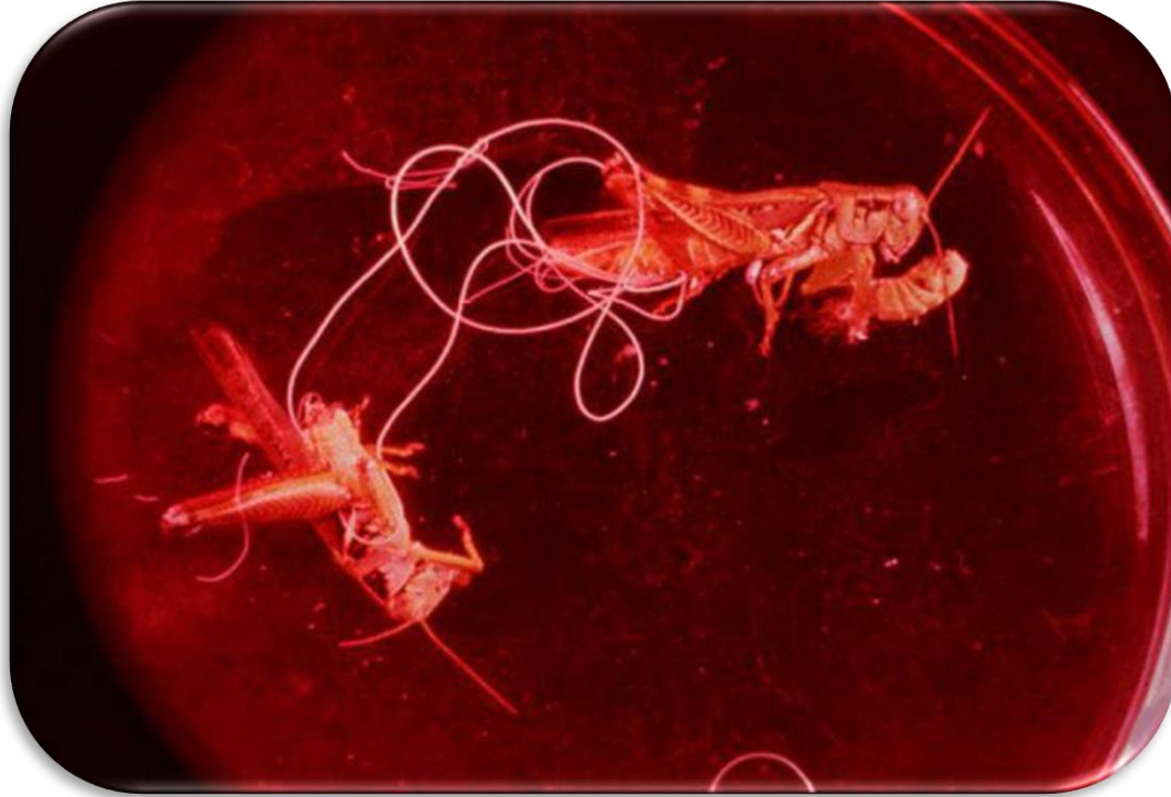
ekirge vcudunda i parazit nematodlar

Nematodlardan Mermis sp. ve Agamermis sp. ekirge vcudunda i parazit olarak bulunmuřtur.