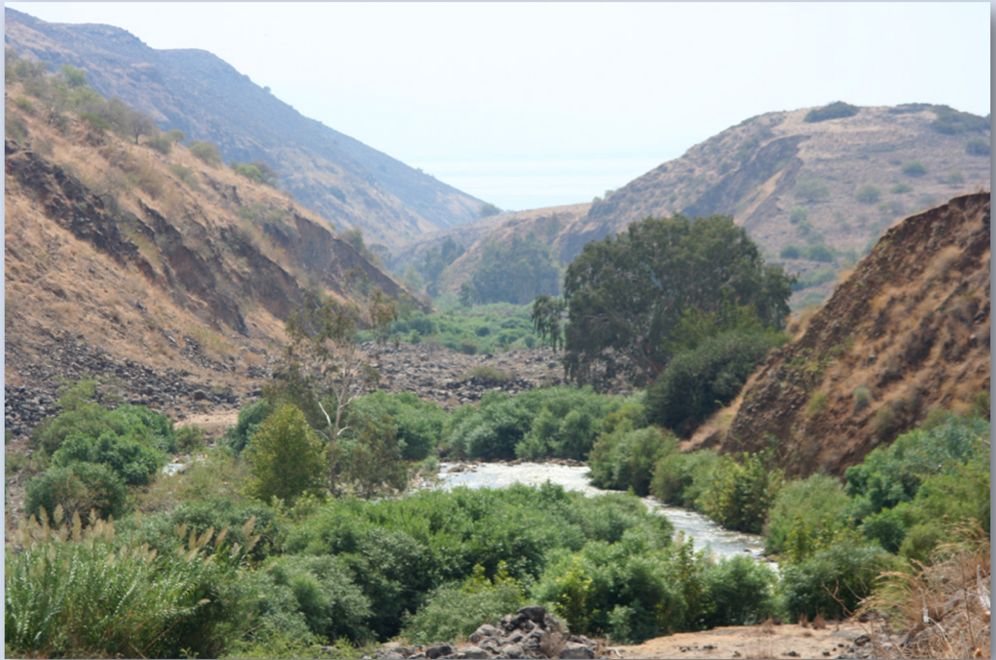
Ürdün, Rift Valley