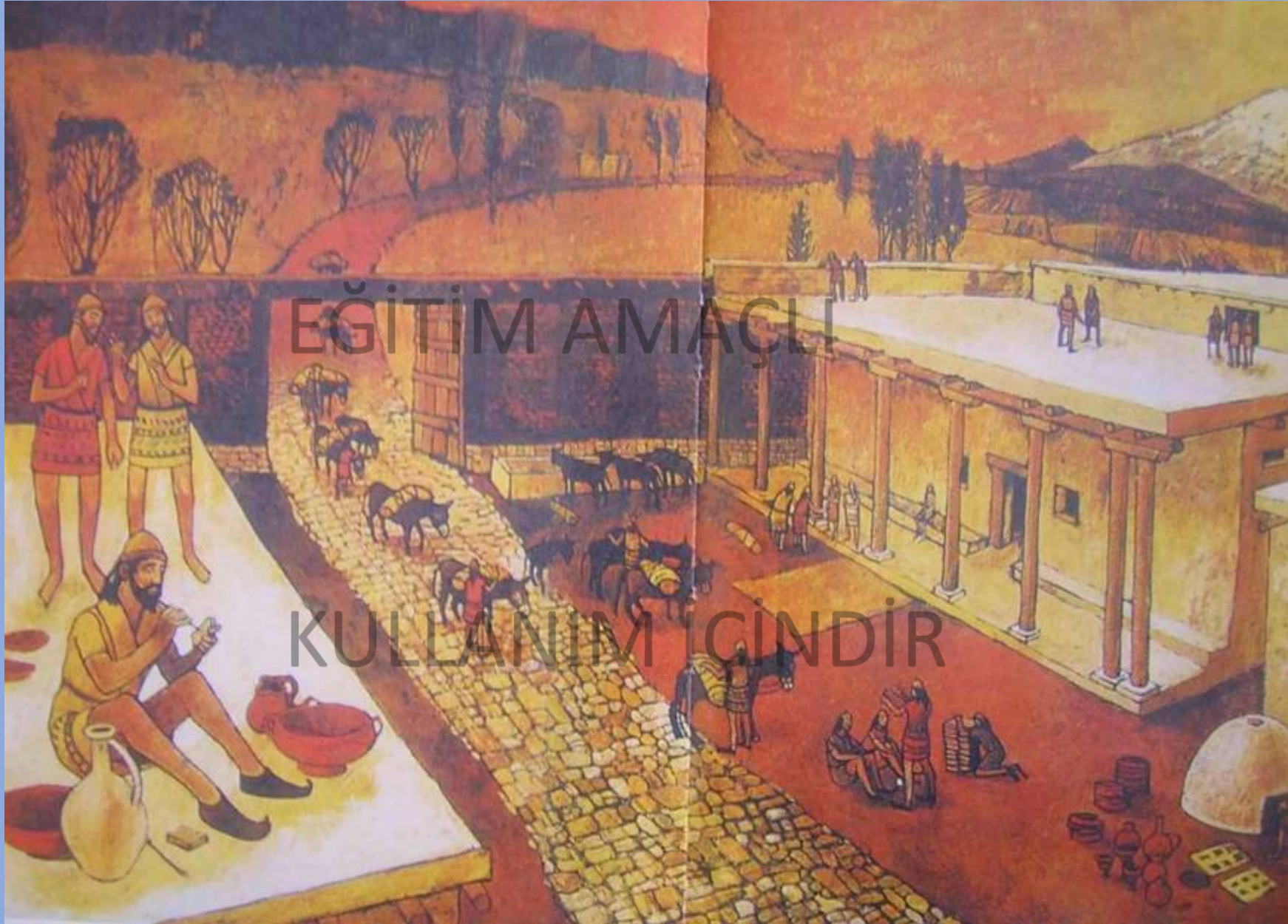
Kultepe Karumu'nun Temsili Görünümü