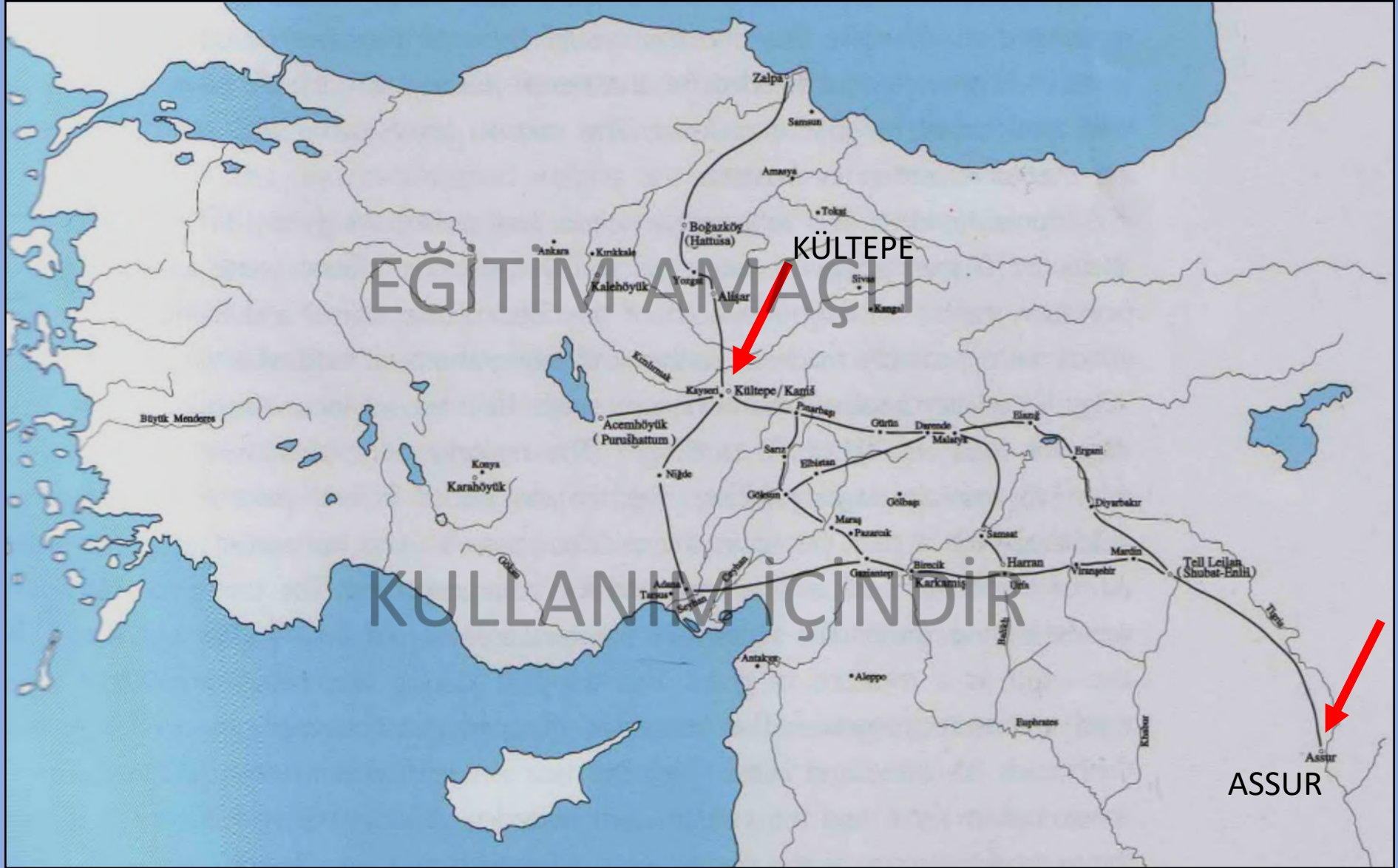
KOLONİ DÖNEMİ TİCARET YOLLARI