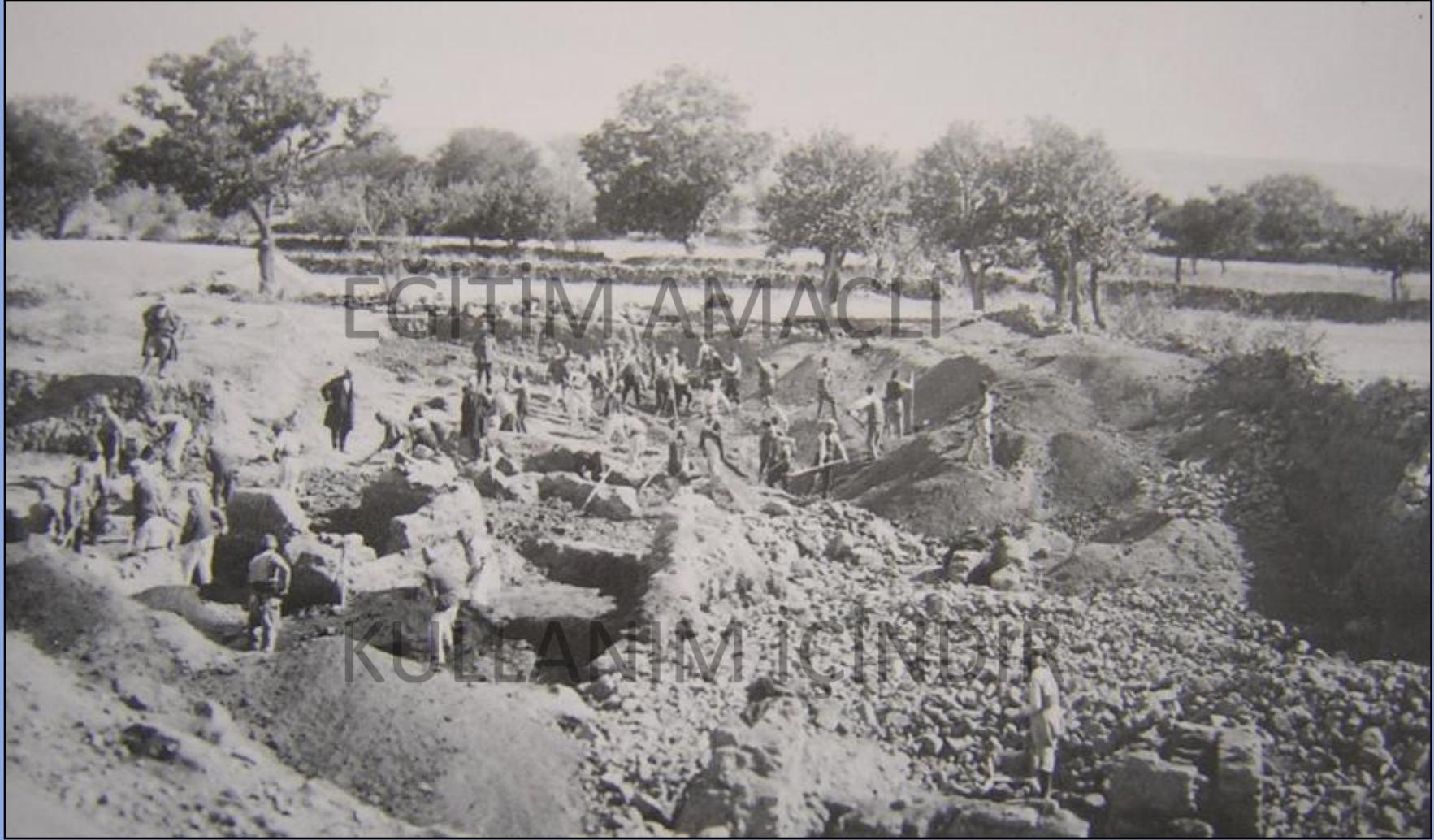
Hrozny'nin Kazısından Görünüm