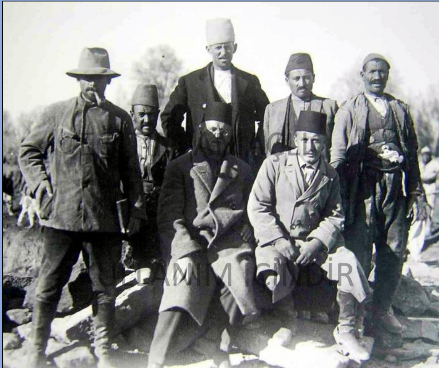
Hrozny ve Ekibi