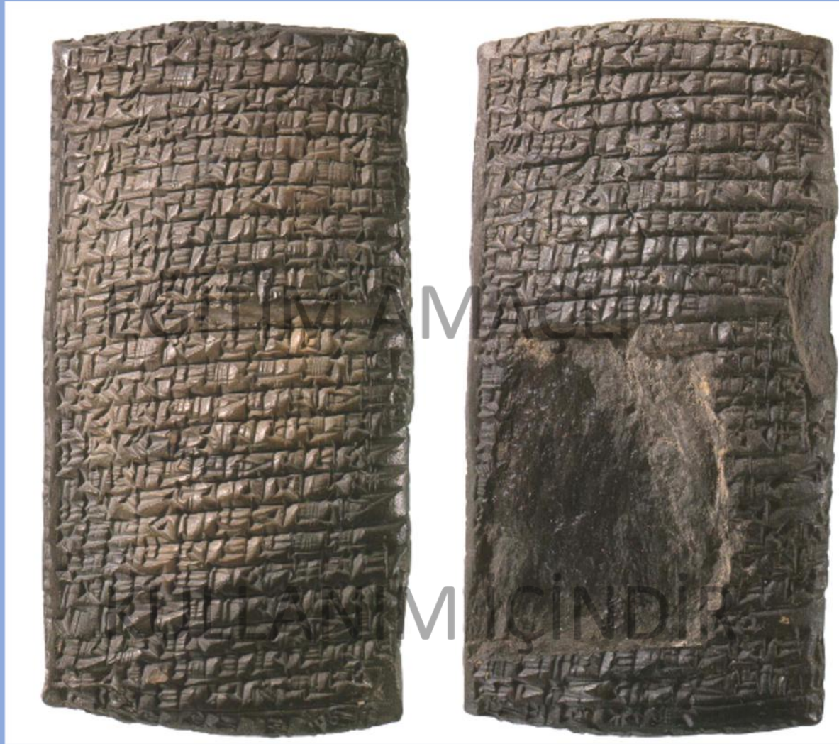
Mama Kralı Anum-Hirbi'nin Kaniş Kralı Warşama'ya Mektubu