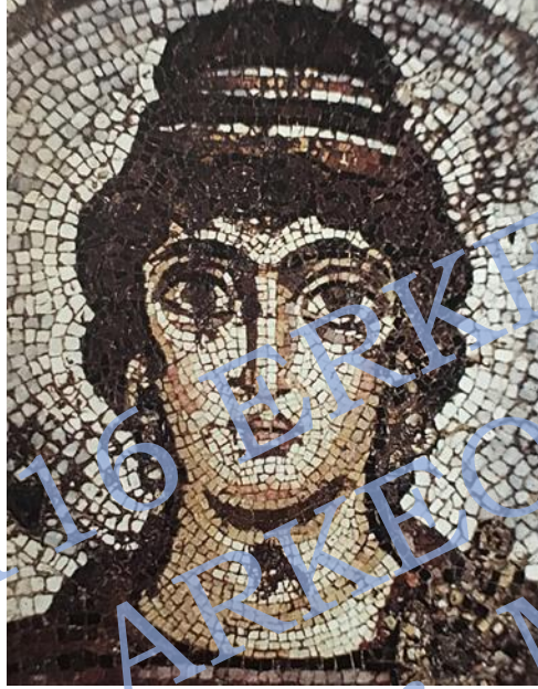
Kartacalı antik kenti, 6.yy