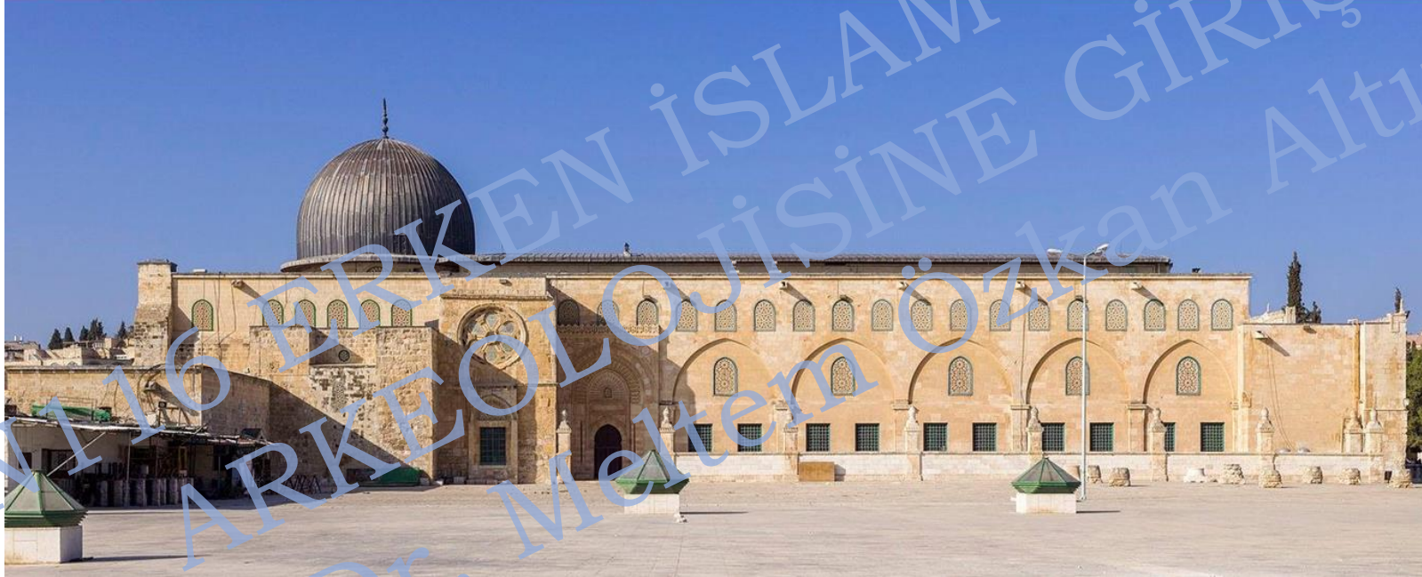
Mescidü'l - Aksa 685-715, I. Velid Dönemi