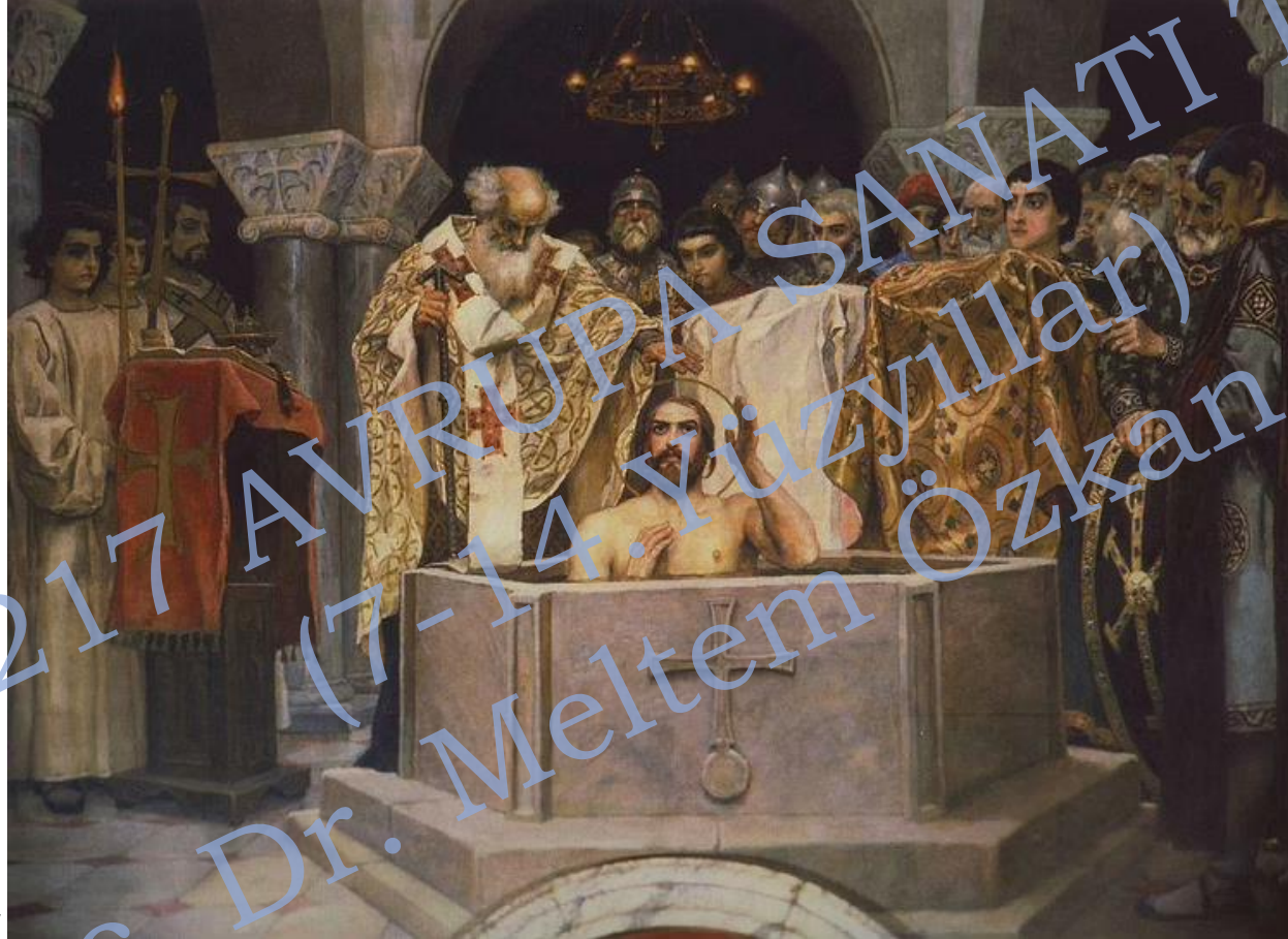
Viktor Mikhailovich Vasnetsov, Saint Prince Vladimir'in Vaftizi (r. 980-1015 CE)

Kaynak: https://www.worldhistory.org/Medieval_Church/