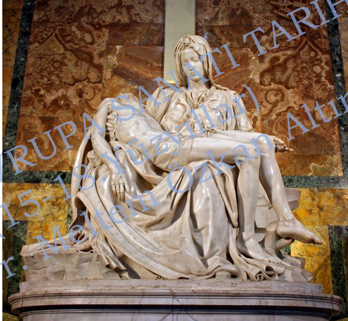
Aziz Petrus Bazilikası, Ağıt, Michelangelo 1498–1499 Pietà del Vaticana 174 cm × 195×69 cm