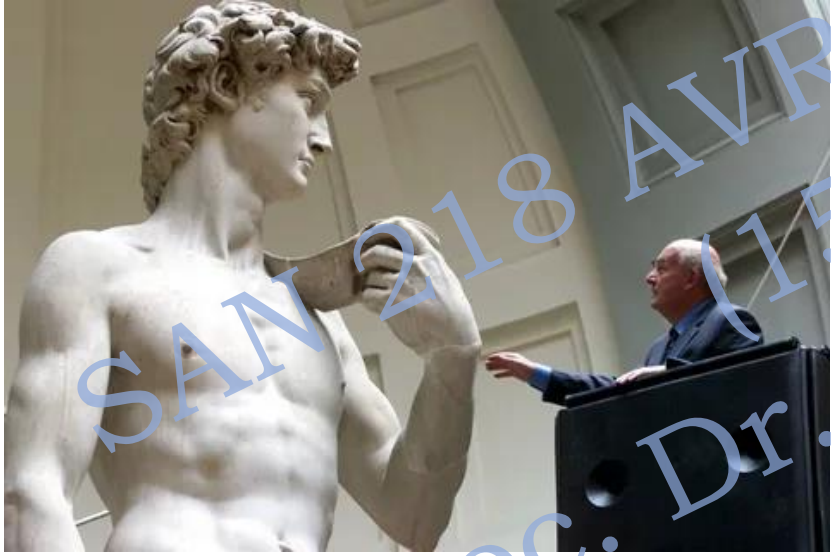
David, Michelangelo, 1501-1504