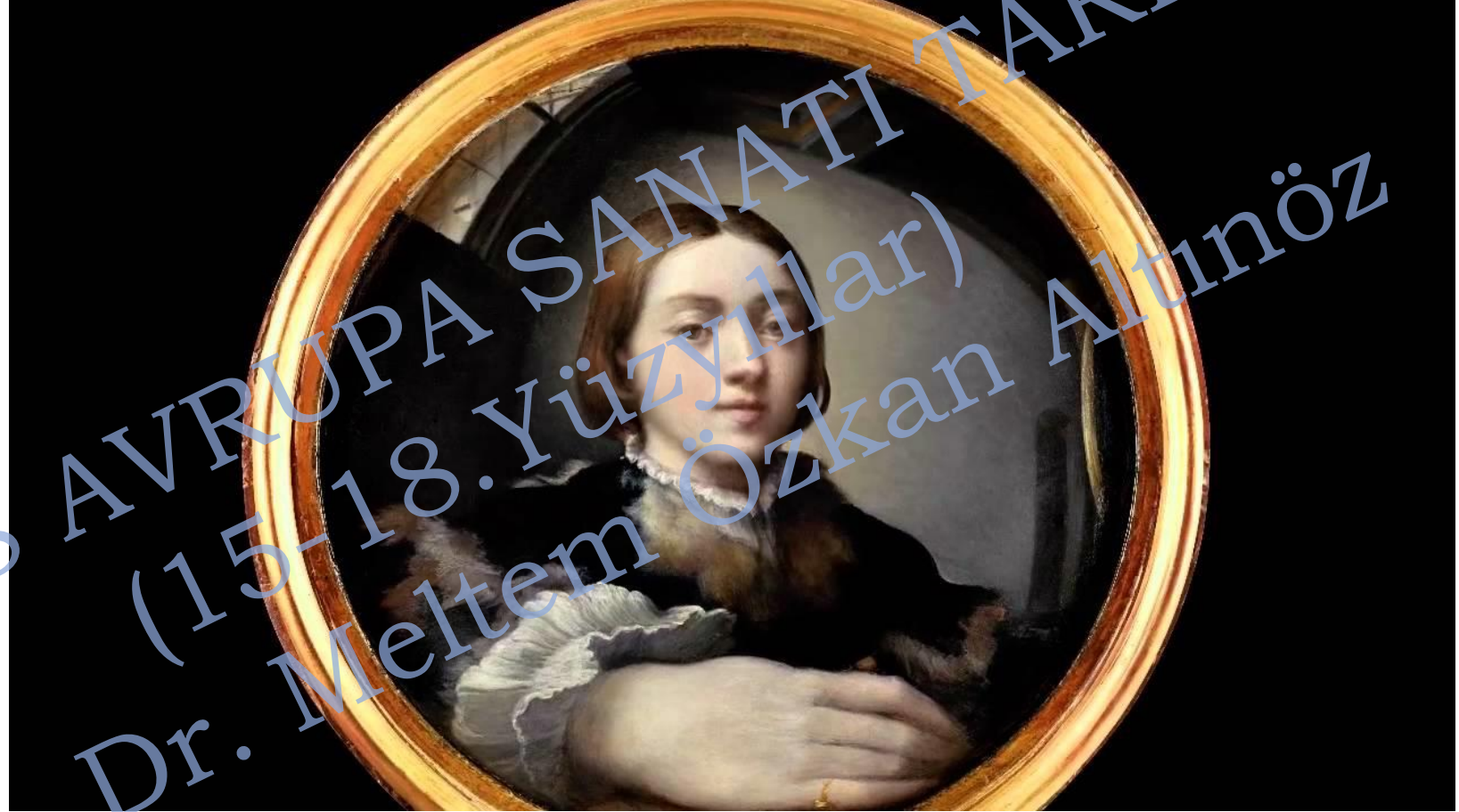
Parmigiannino, Kendi Portresi, 1523/24