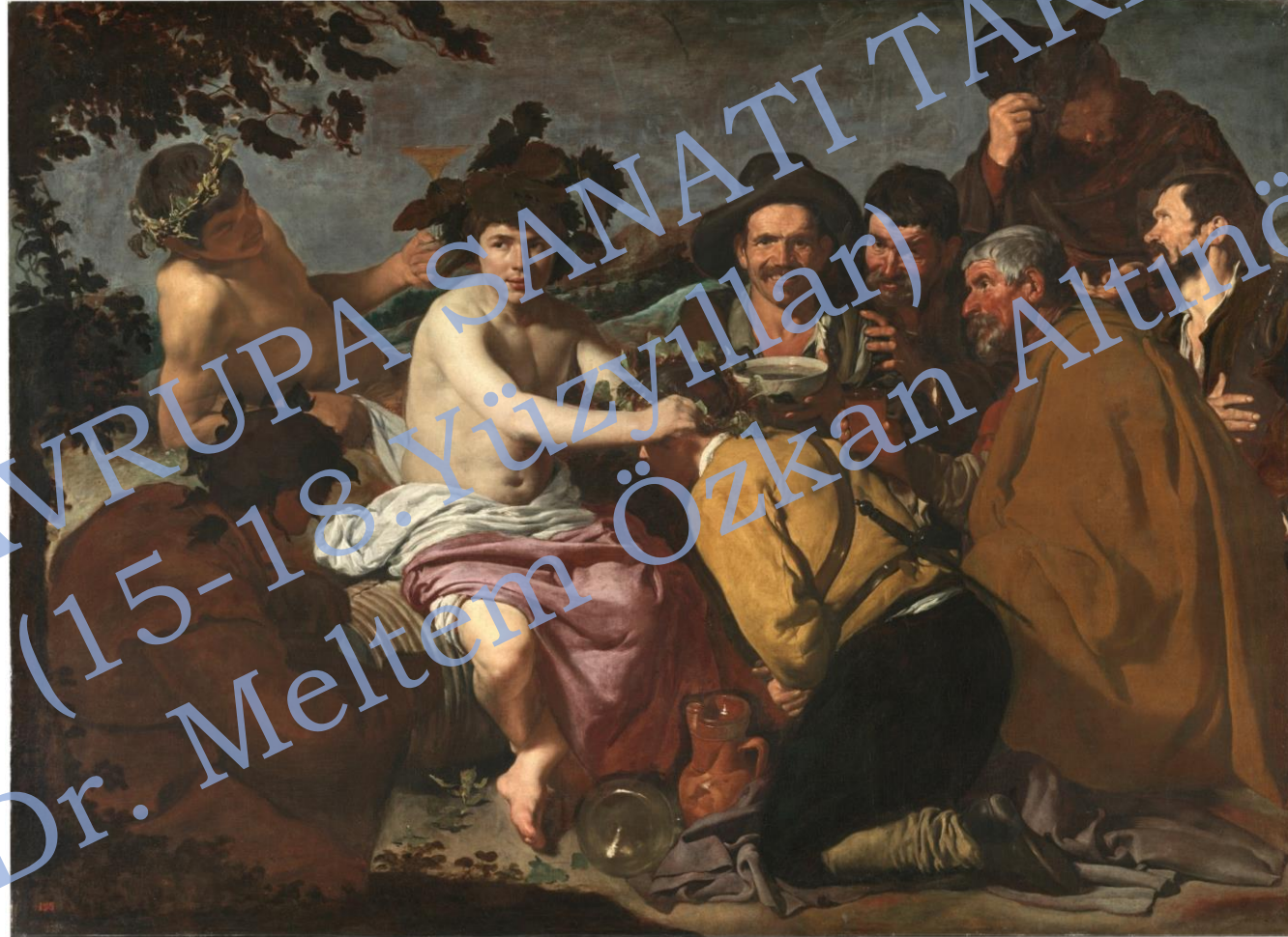
Sarhoşlar, Velazquez (The Triumph of Bacchus, 1629)