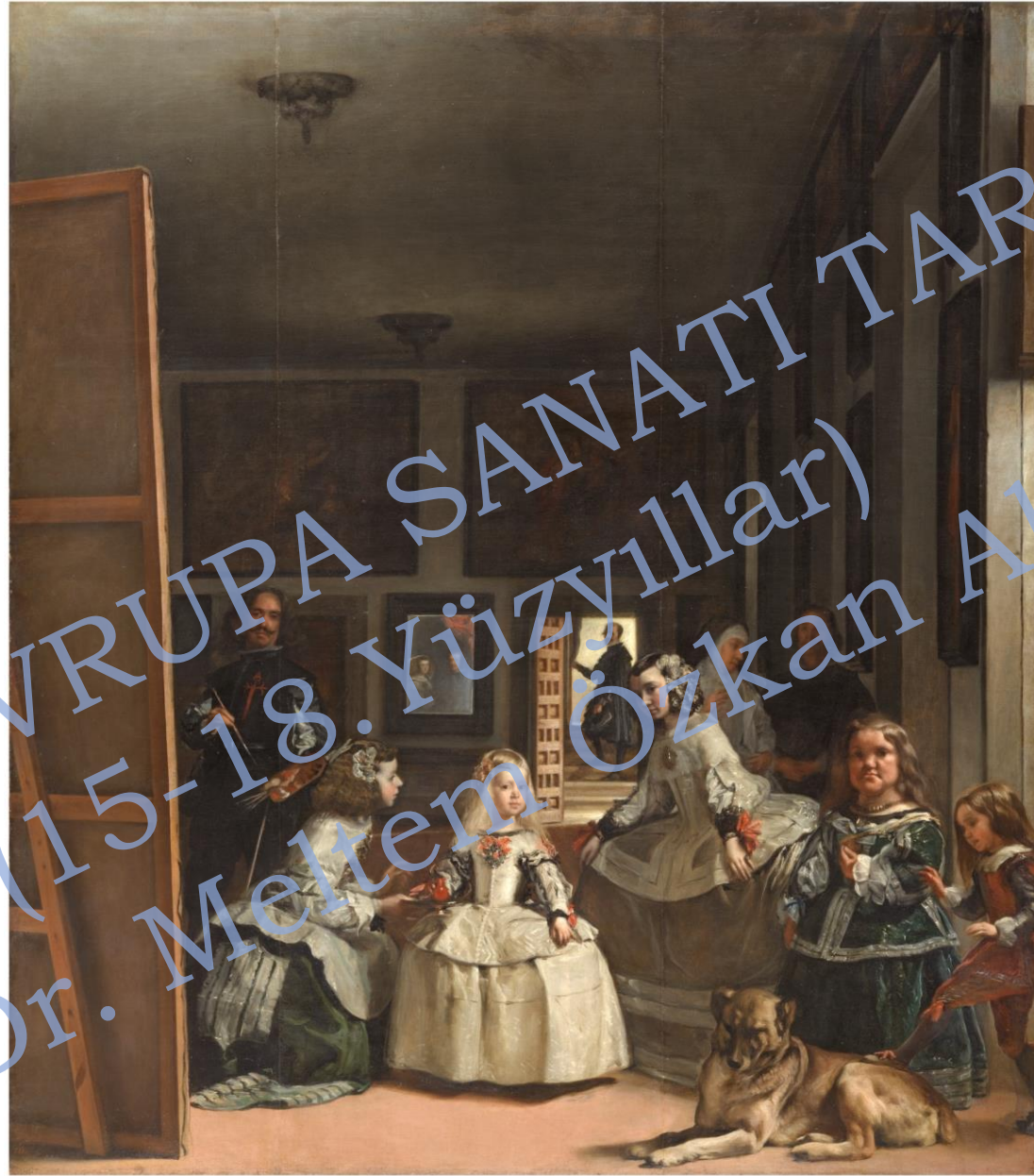
Velazquez, Las Meninas, 1656