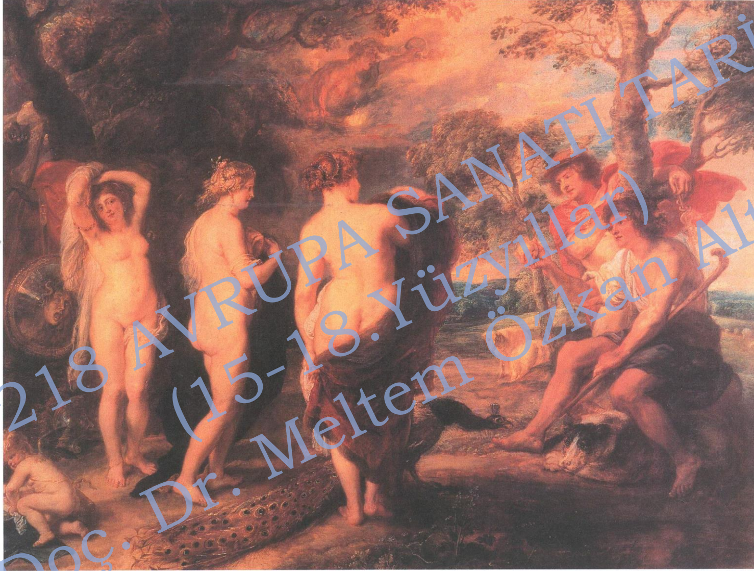
Peter Paul Rubens, Paris'in Seçimi. 146.5 x 195.5 cm.