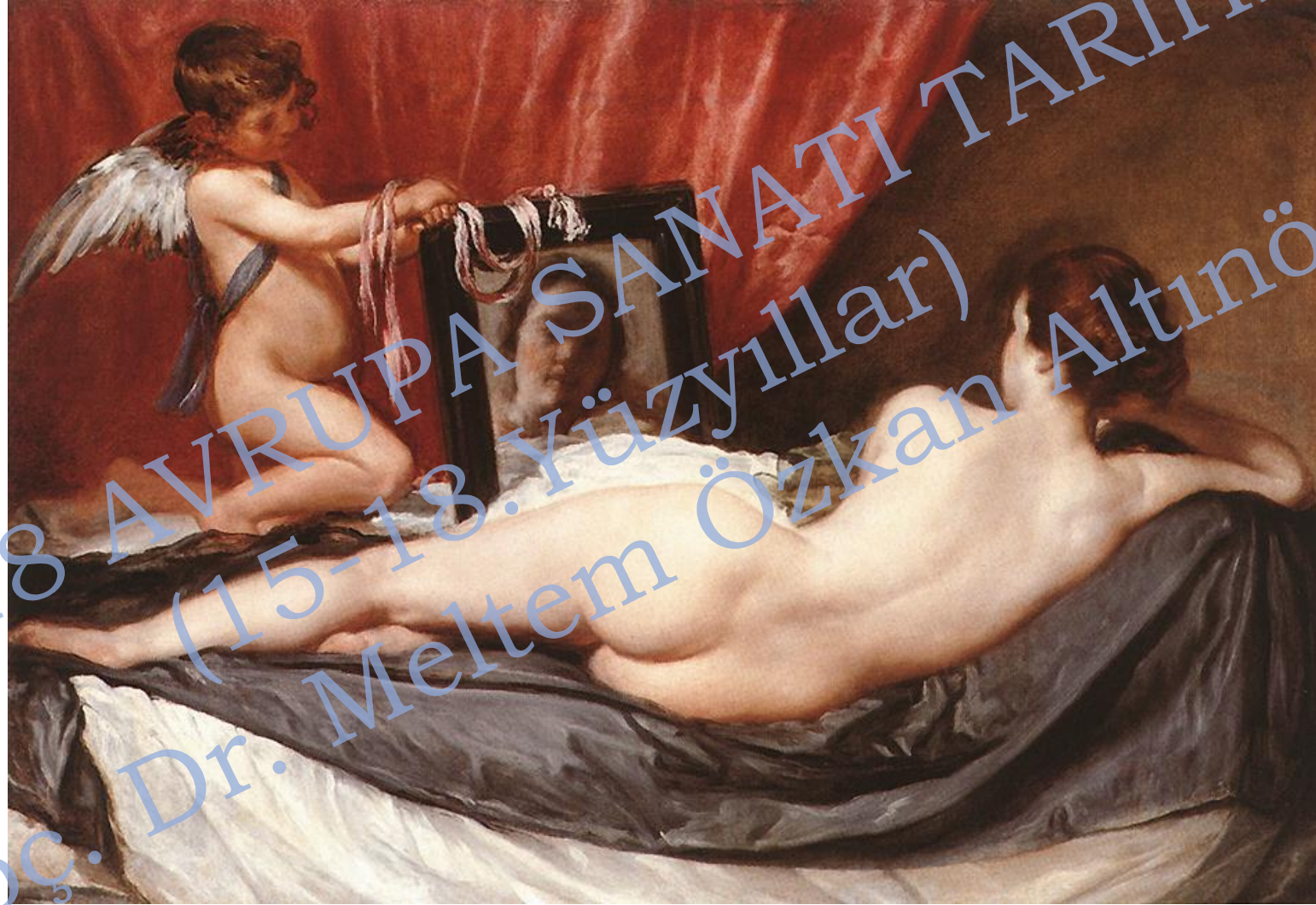
Velazquez, Rokeby Venus (Venus with a Mirror), c. 1648, yağlıboya kanvas