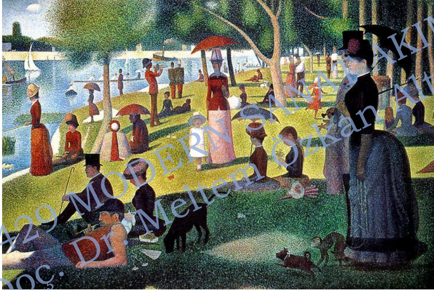
Sunday Afternoon on the Island of La Grande Jatte, 1884–1886, Georges Seurat