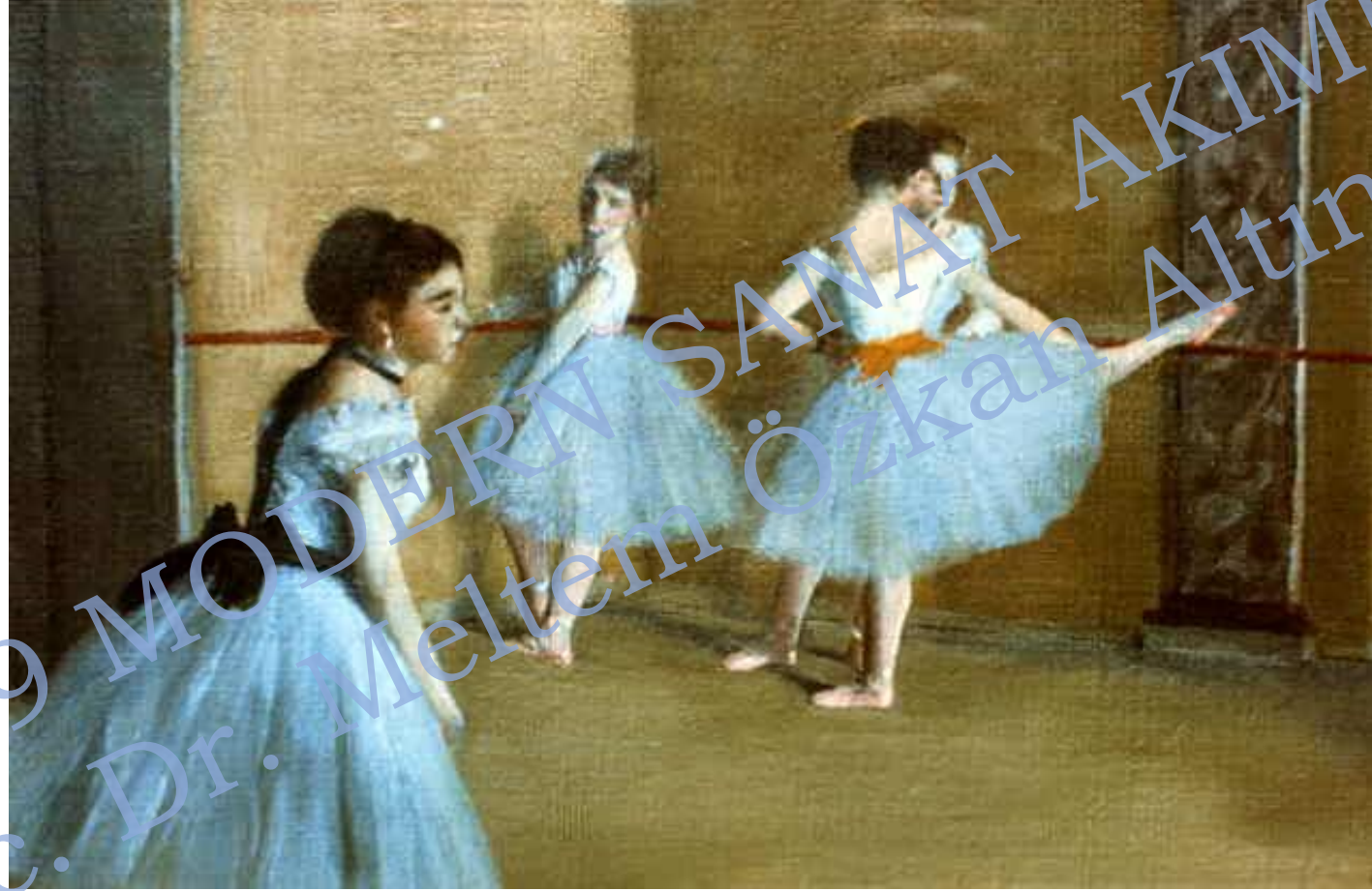
Edgar DEGAS, Operada Dans Sınıfı, 1872