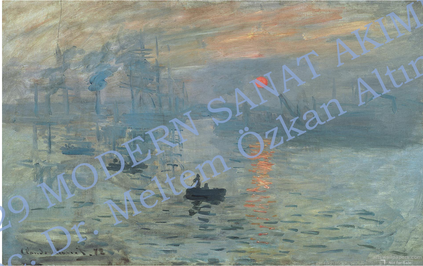
Claude Monet, Impression,, soleil levant, İzlenim (Impression, Sunrise), Gün Doğumu, 1872