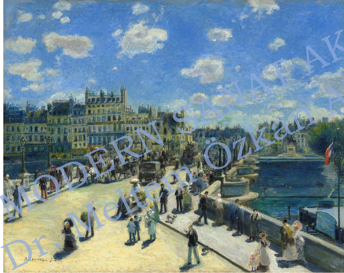
Pierre-Auguste Renoir, Pont Neuf, Paris, 1872