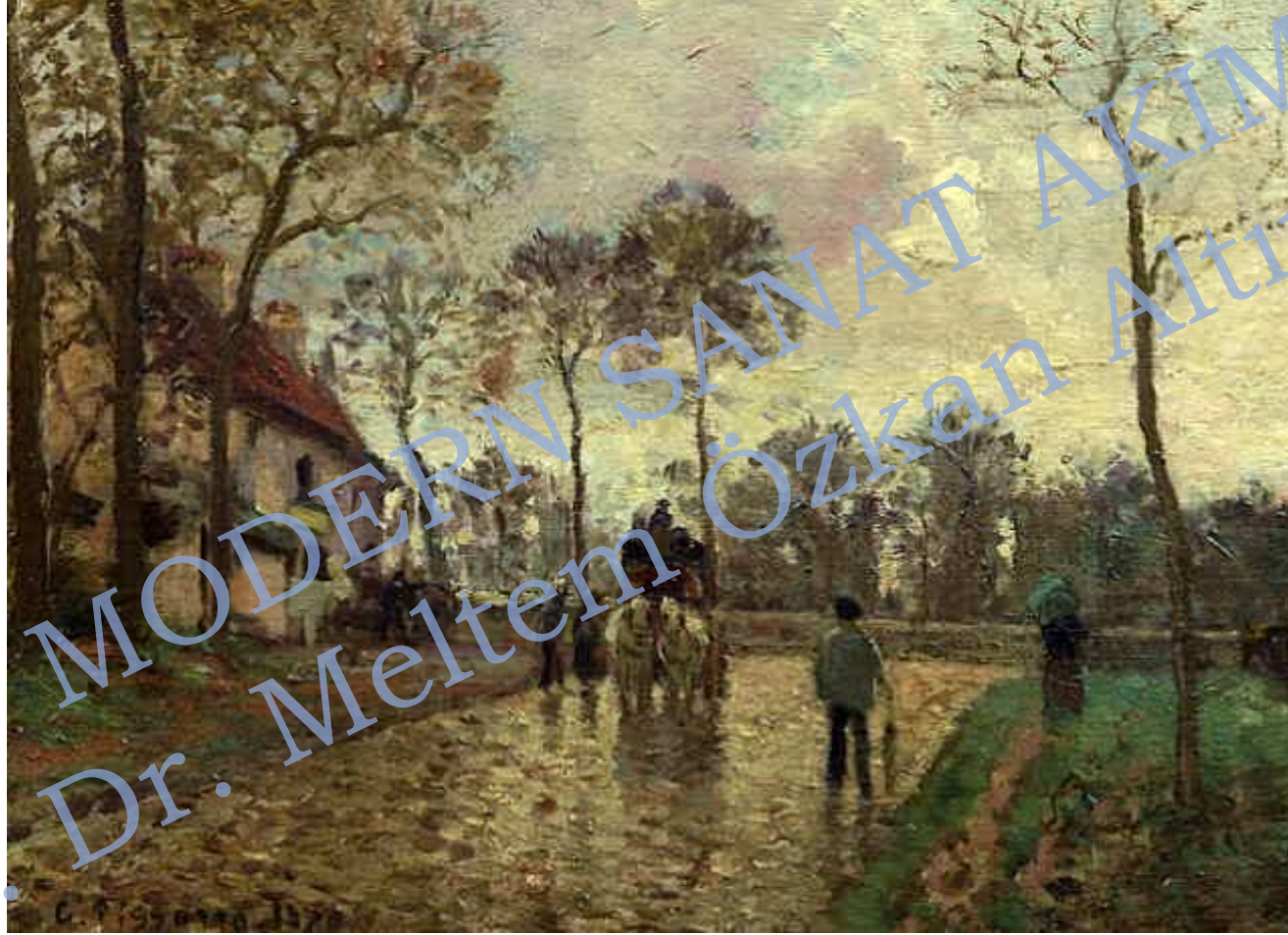
PISARRO, Arabalı Cadde,1870