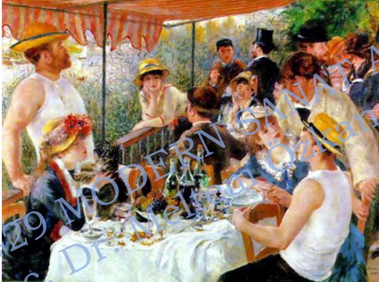
Pierre Auguste Renoir, Luncheon of the Boating Party/Eğlence Partisi 1881Eğlence Partisi