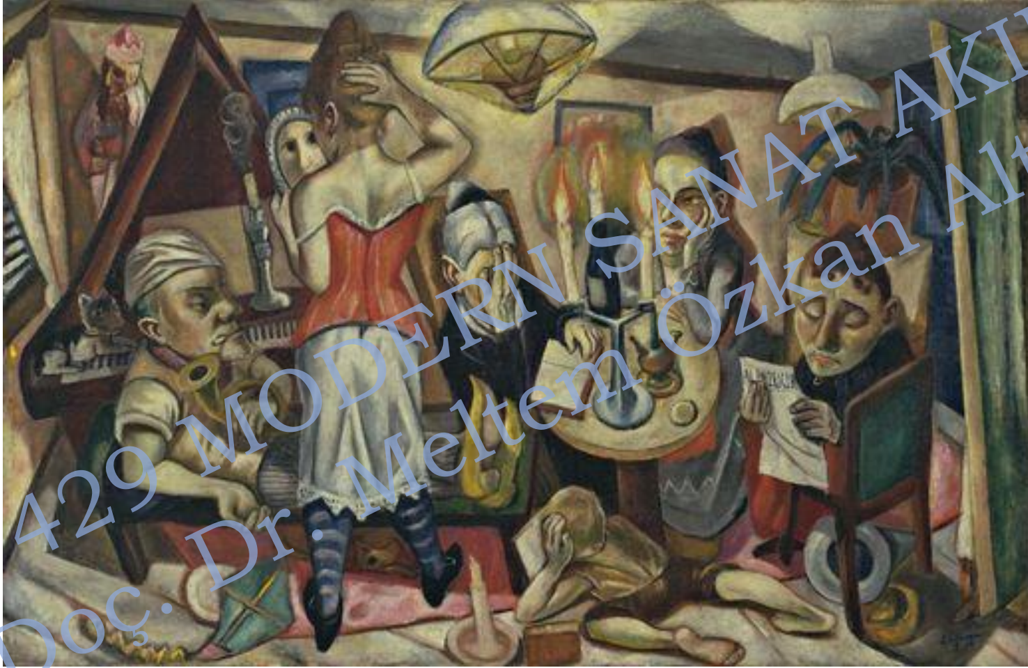
Max Beckmann,Aile Resmi