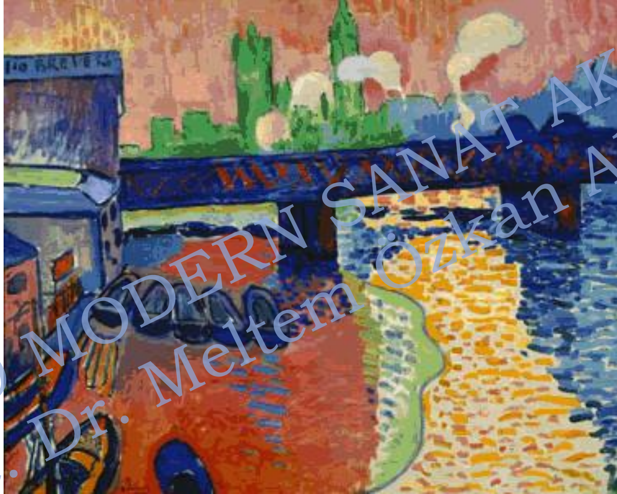
Charing Cross Bridge, London (1906). Derain

SAN 429 MODERN SANAT AKIMLARI Doç. Dr. Meltem Özkan Altınöz