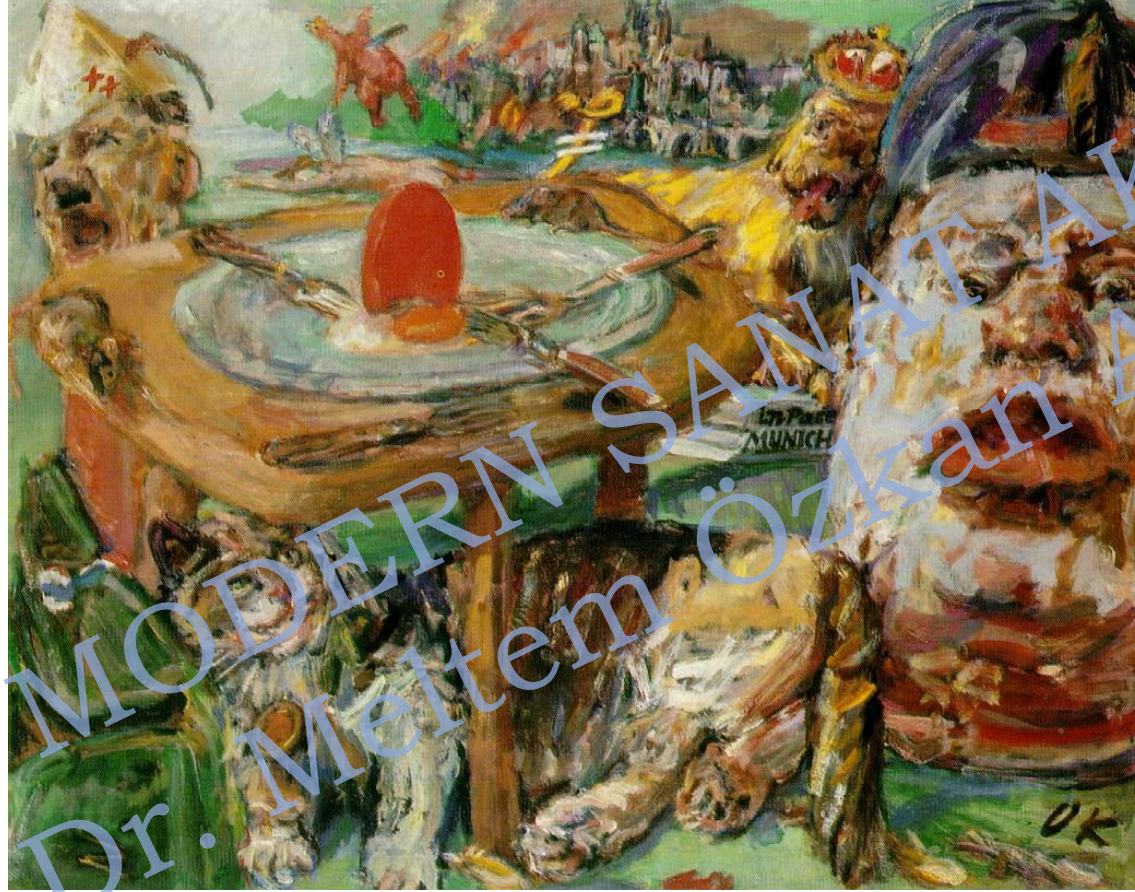
Oskar KOKOSCHKA, Kırmızı Yumurta