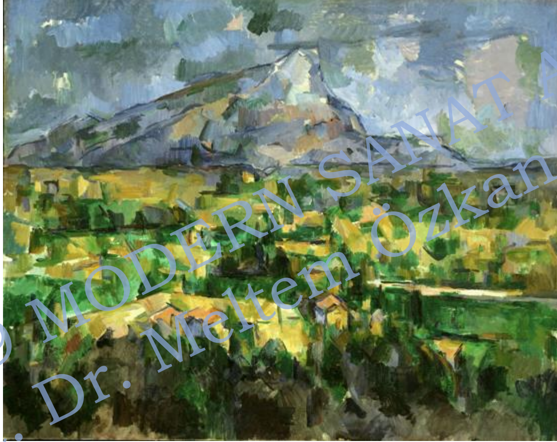
Paul Cézanne, Mont Sainte-Victoire , 1902-04, oil on canvas, 73 x 91.9 cm (Philadelphia Museum of Art)