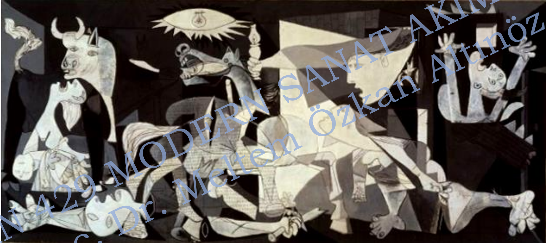
PICASSO, Guernica, 1937, 3.49 m x 7.77 m, Museo Nacional Centro de Arte Reina Sofía