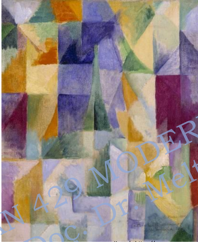
Robert Delaunay, Pencereleler, 1912 (79.9 x 70 cm)