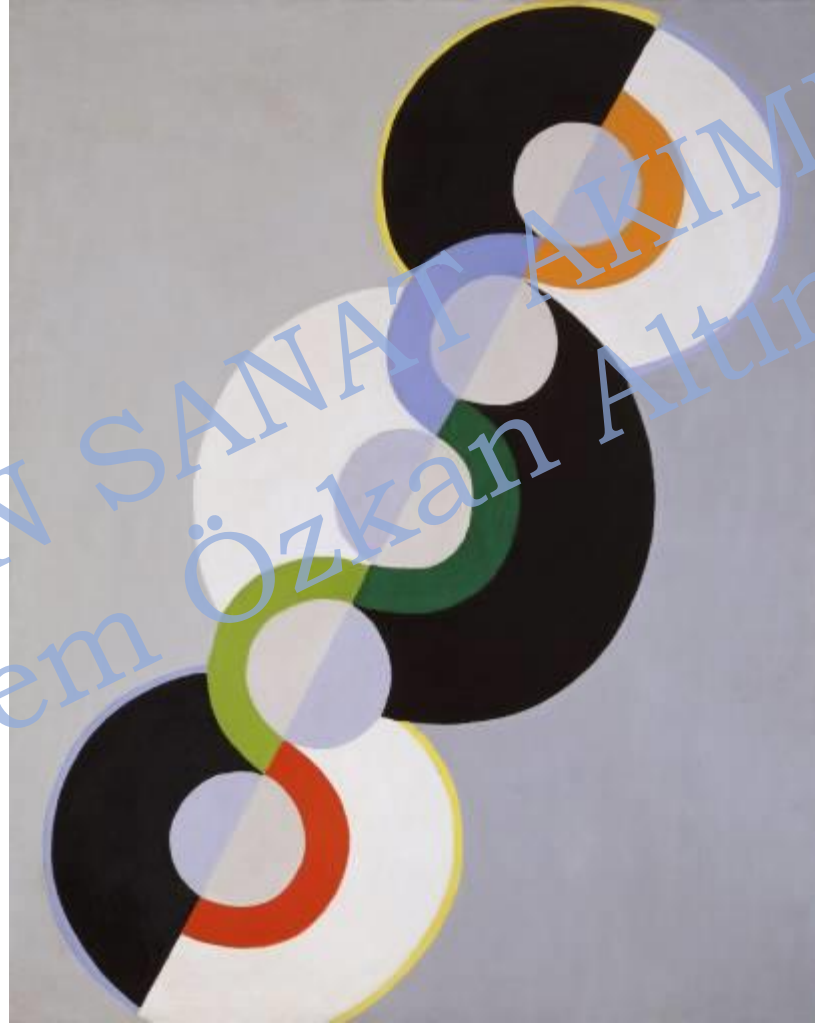
Robert Delaunay, Sonsuz Ritim, 1934