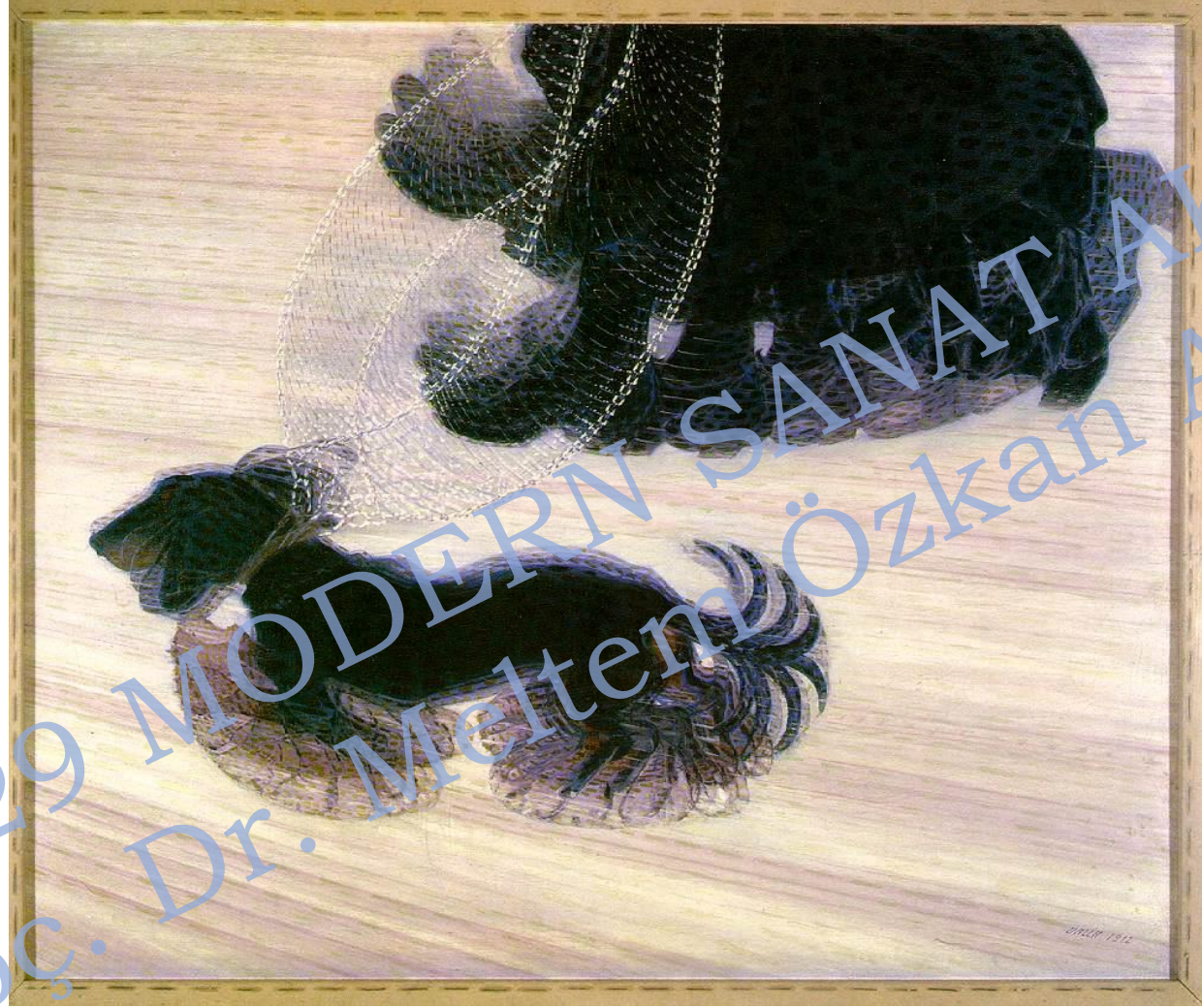
Giacomo BALLA, Bir Köpeğin Dinanizmi 1912