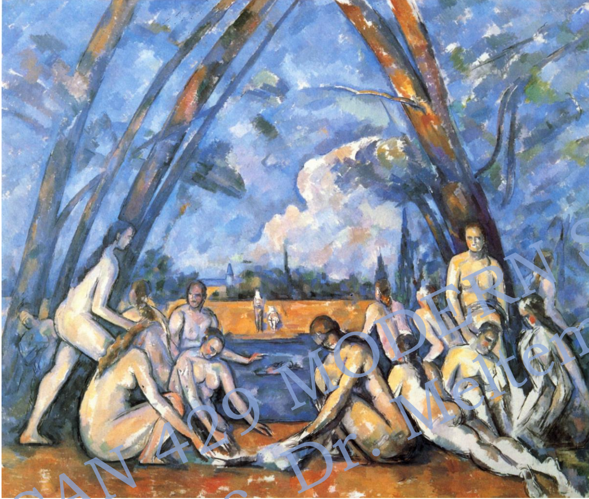
P.CEZANNE Yıkanan Kadınlar/ The Large Bathers, 1906

«Sanat hakkında hüküm vermem gerektiğinde, resmimi alıp bir ağacın ya da bir çiçeğin, Tanrı'nın yarattığı bir nesnenin yanına koyarım. Ortada bir uyum yoksa sanat da yok demektir»