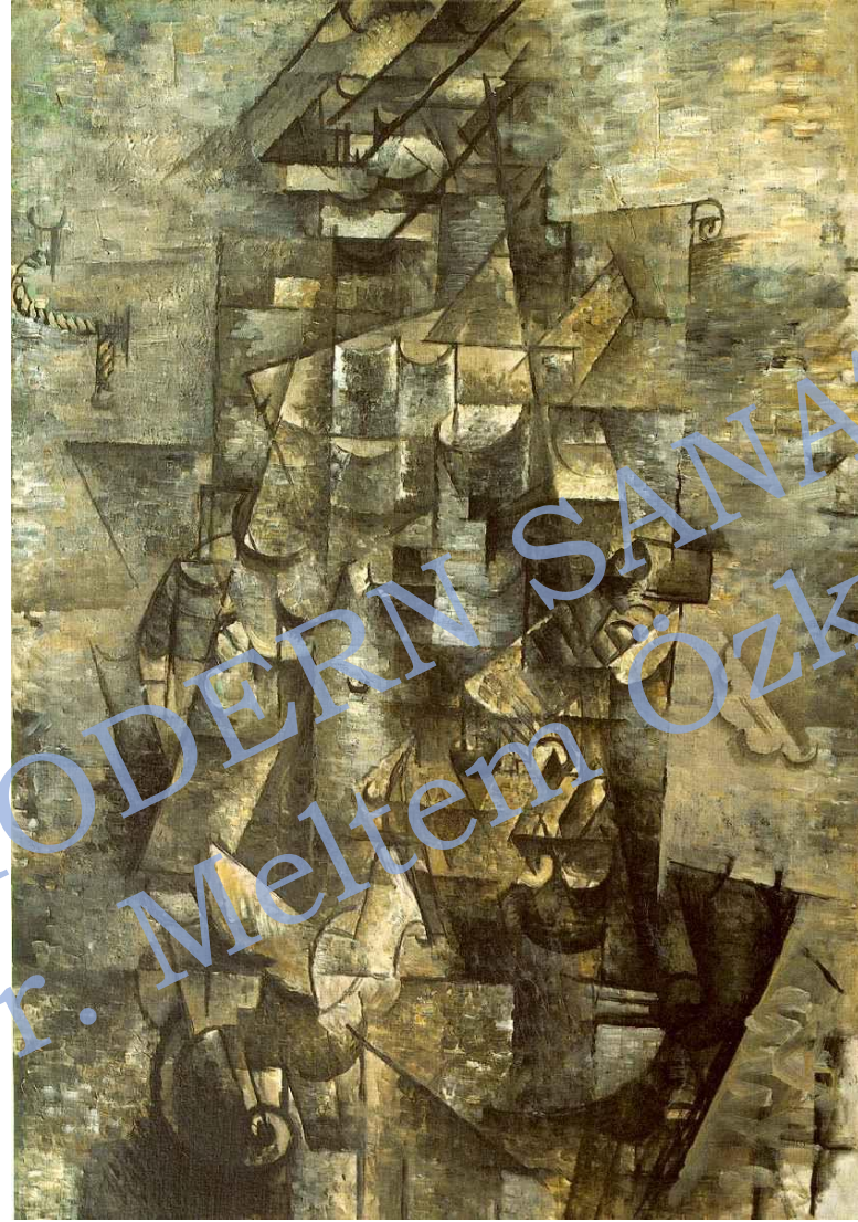
G. BRAQUE Gitarlı Adam, 1911