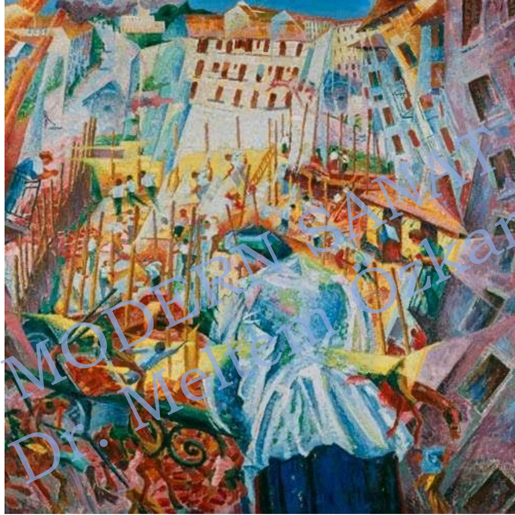
Umberto Boccioni, Sokağın Bütün Gürültüsü Evin İçinde, 1911