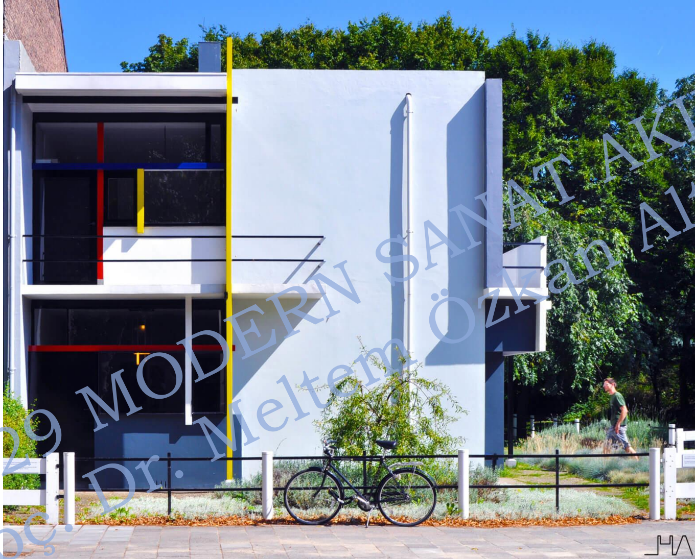
Gerrit Rietveld, Schröder Evi, 1924, Utrecht, Hollanda