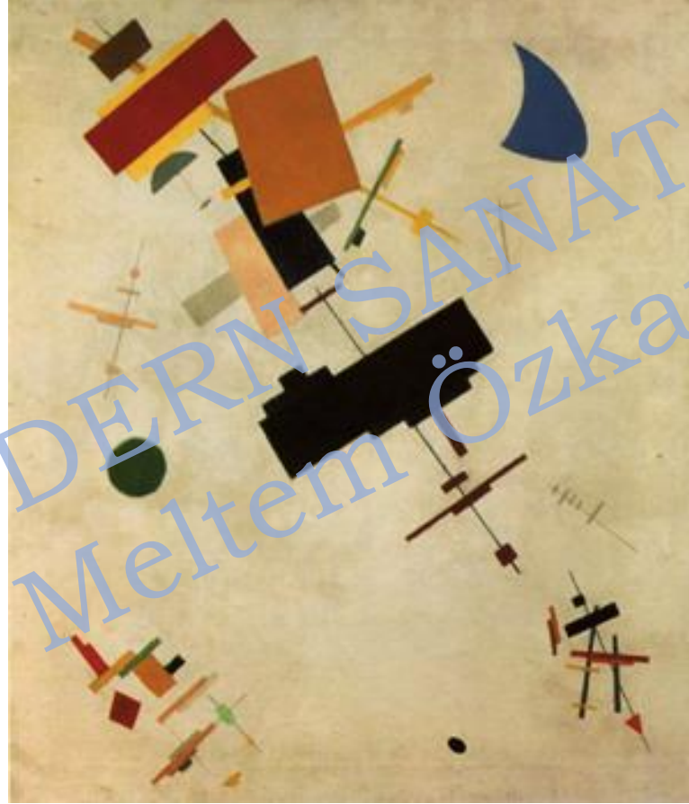
Maleviç, Supremus 56, 1916