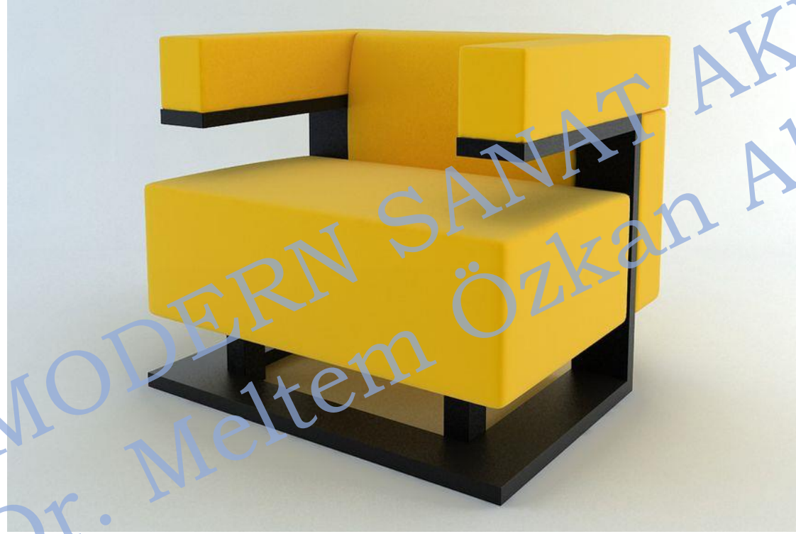
Walter Gropius - The Gropius Armchair