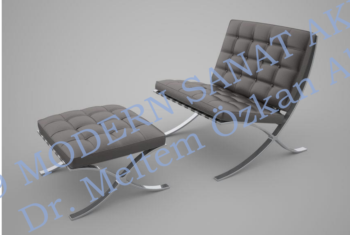
Ludwig Mies van der Rohe and Lilly Reich – The Barcelona Chair, 1929