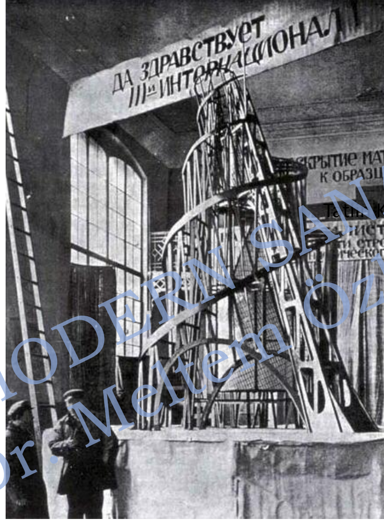
Таш Кulesi, 1919

SAN 429 MODERN SANAT AKIMLARI Doç. Dr. Meltem Özkan Altınöz