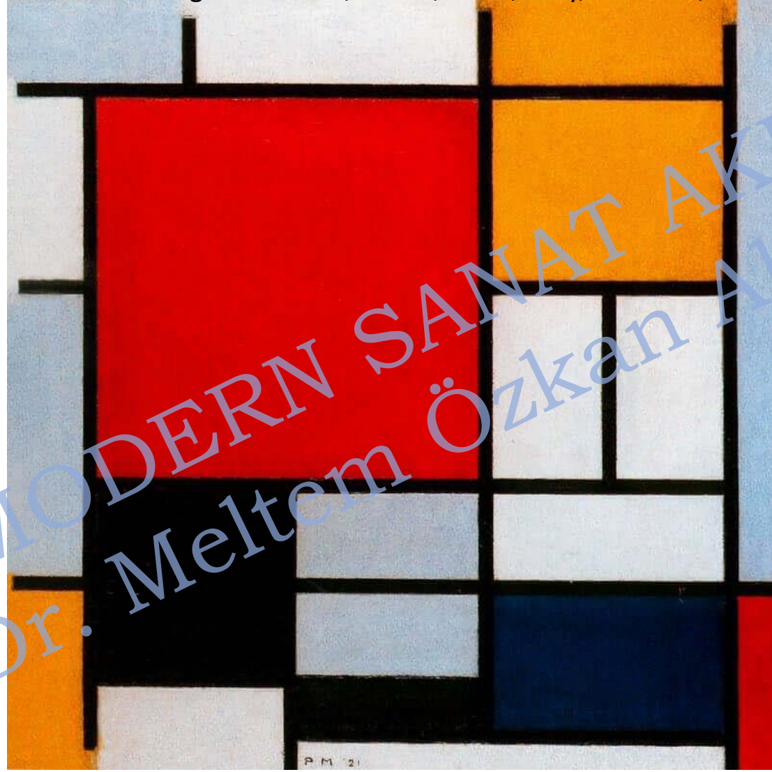
Composition with Large Red Plane, Yellow, Black, Gray, and Blue, 1921