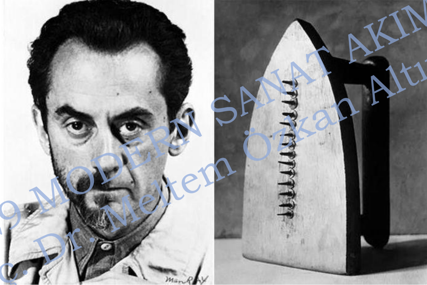
Man Ray, Hediye, 1921, Philadelphia Museum of Art