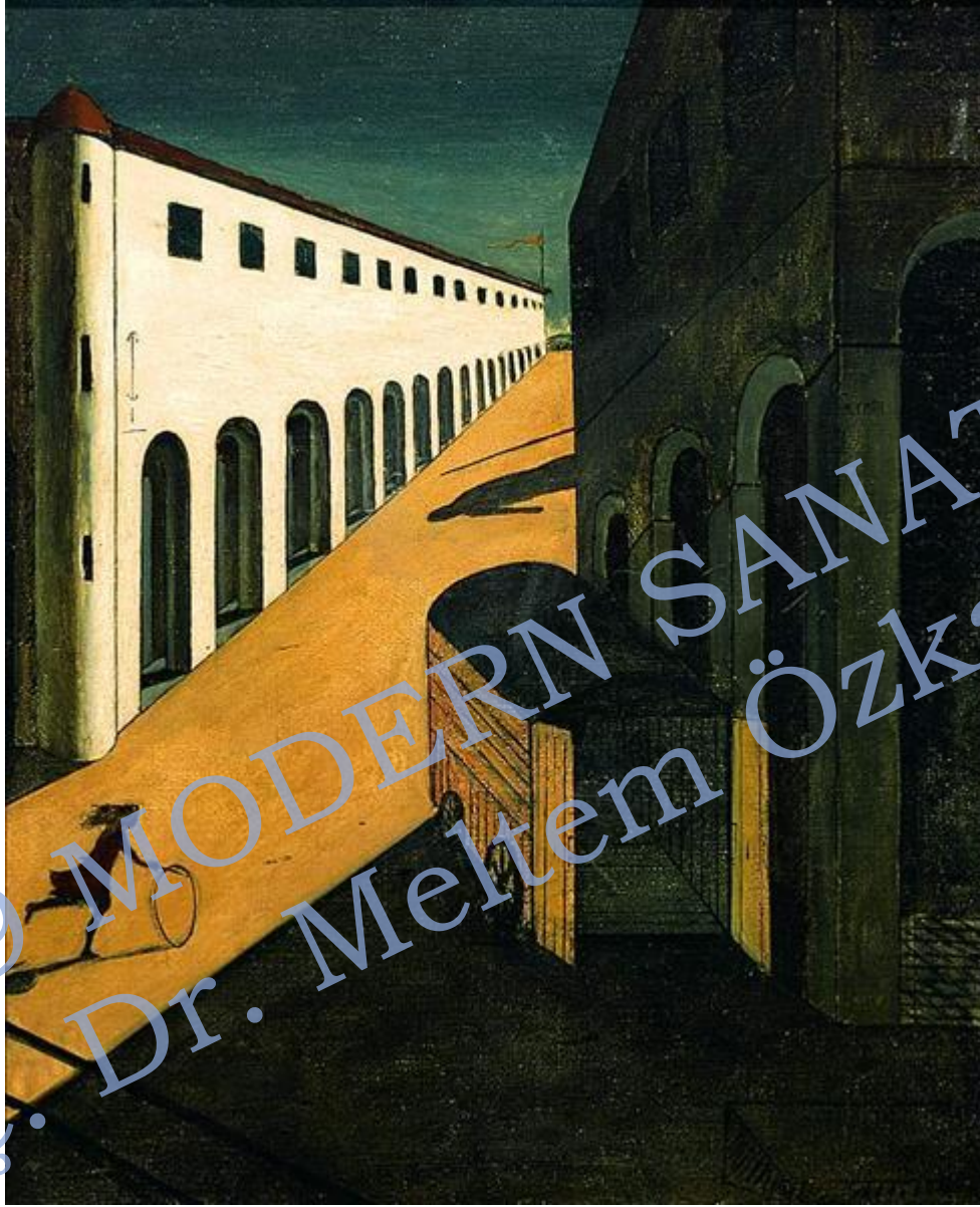
Giorgio de Chirico Sokağın Gizi ve Melankolisi, 1914 85 x 69 cm