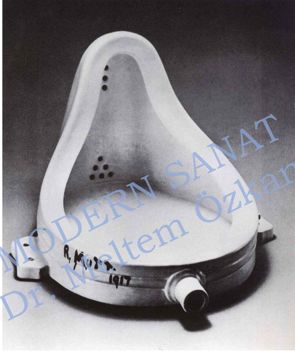
Marcel Duchamp, eşme, 1917