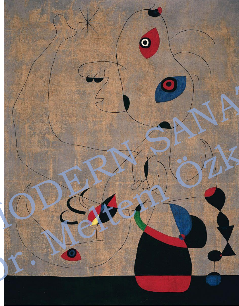
Joan Miró - Spanish Dancer, 1945