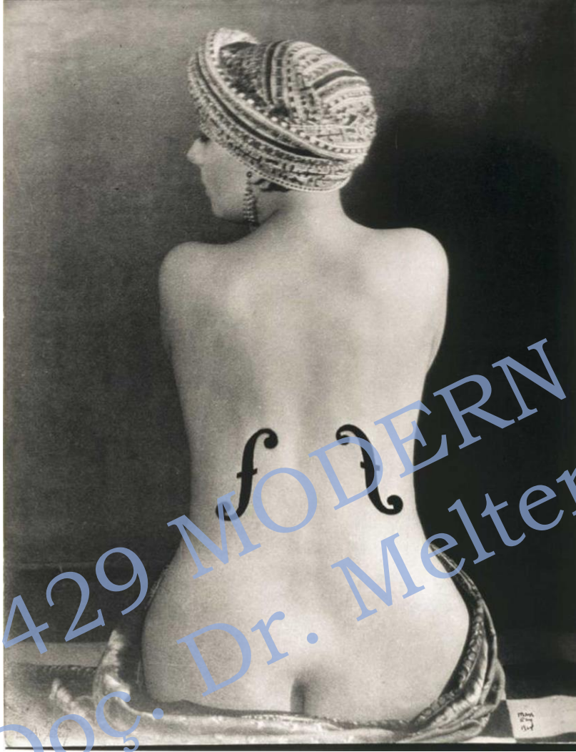
Ingre's Violin, 1924 - Man Ray