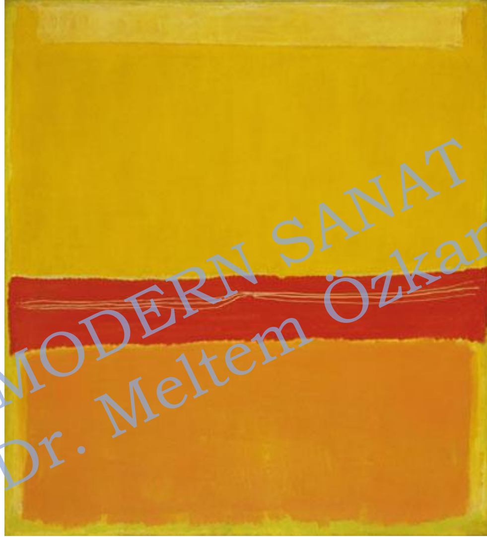
Mark Rothko , No.5, 1950