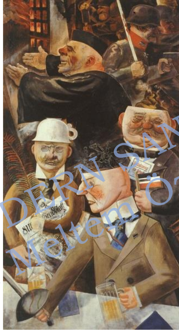
George Grosz, Toplumun Temel Direkleri (1926)