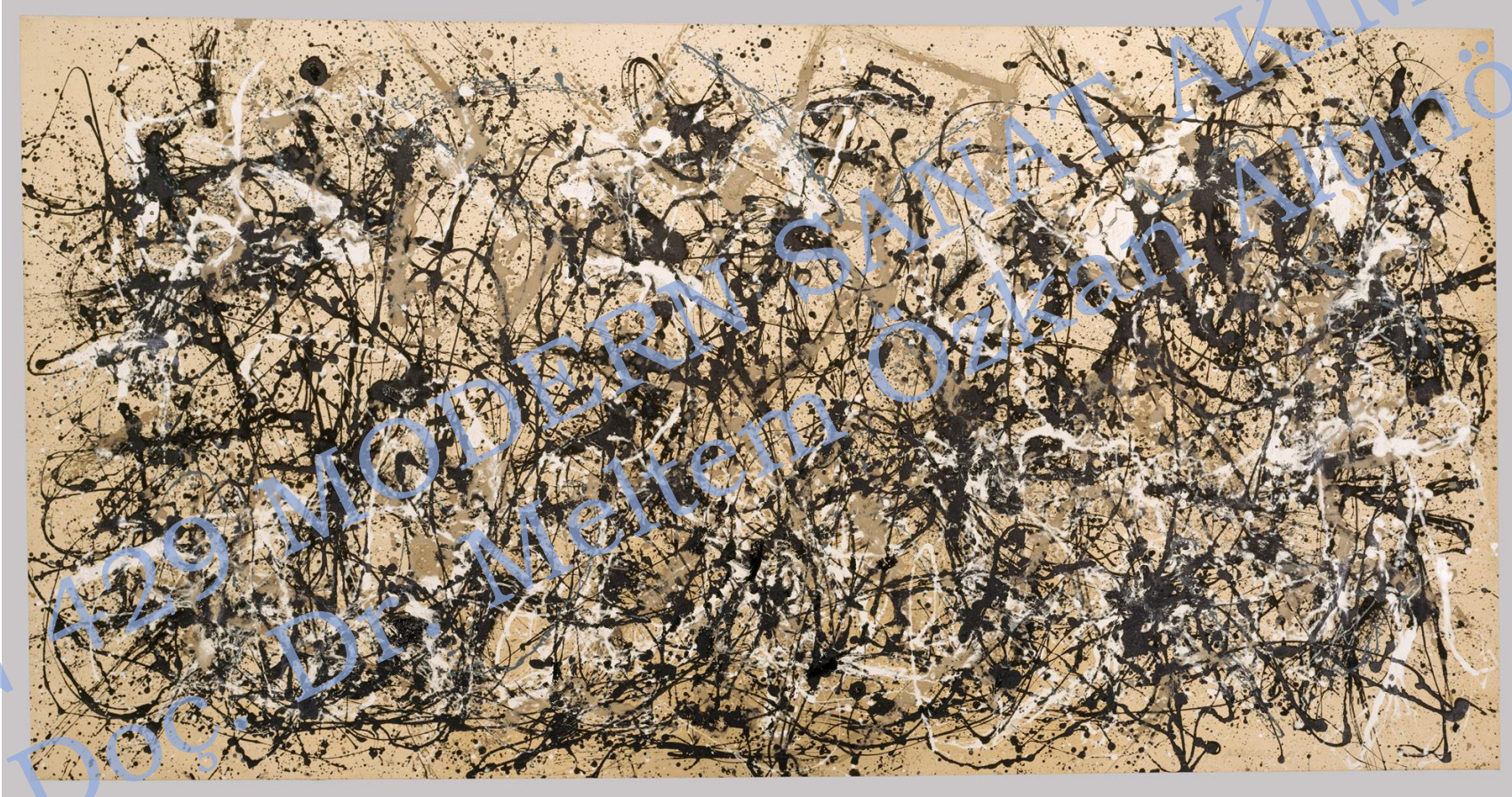
Jackson Pollock, Autumn Rhythm (Number 30) | Jackson(266.7 x 525.8 cm)