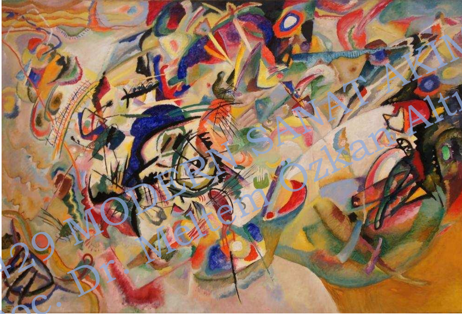
Wassily Kandinsky, Kompozisyon VII, 1913