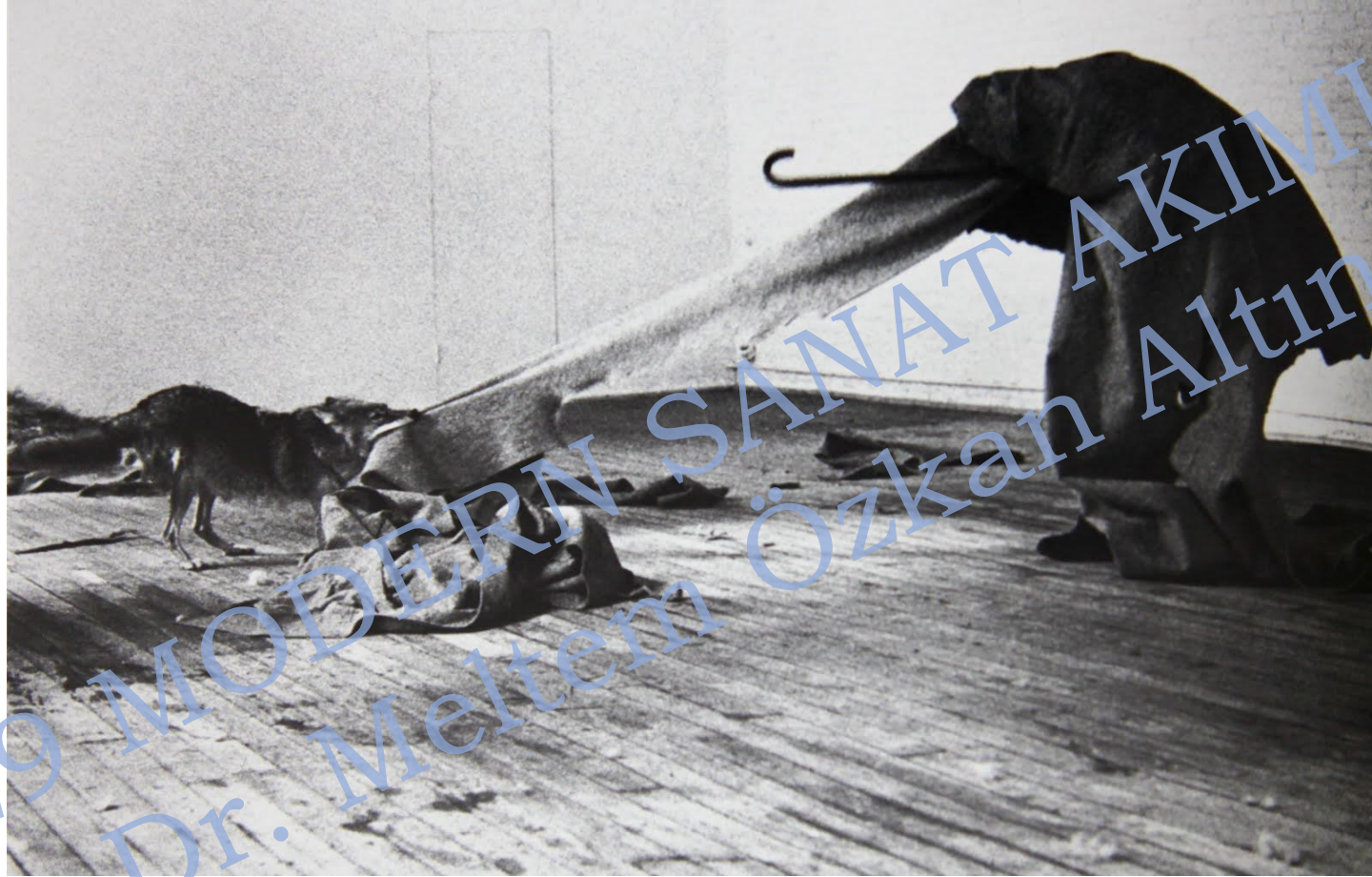
Joseph Beuys I Like America and America Likes Me, 1974