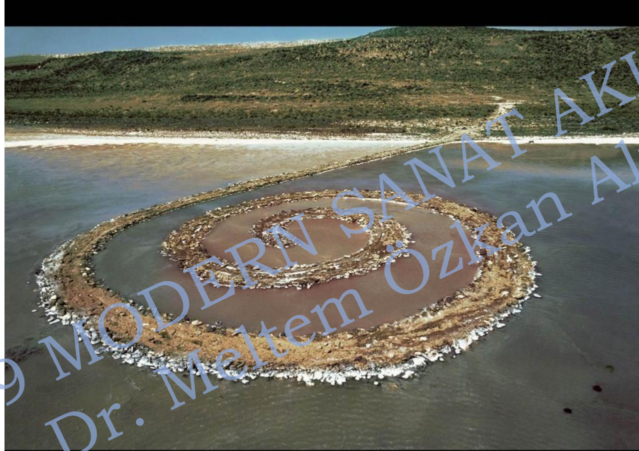
Spiral Jetty, Robert Smithson, 1970