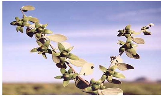
Şekil 2.27 Jojoba ( Simmondsia chinensis (Link) C. Schneider) ve meyveleri