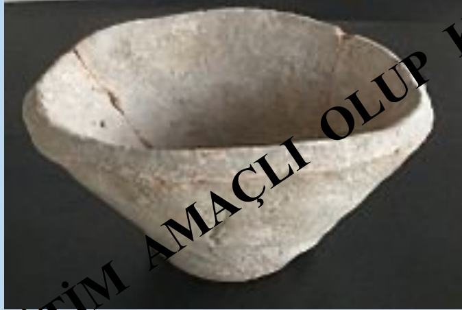
Habuba Kabira Mainz Universitesi