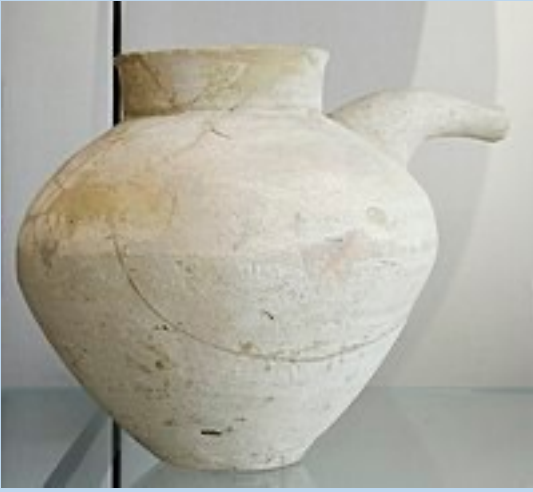
Tello/ Girsu Louvre