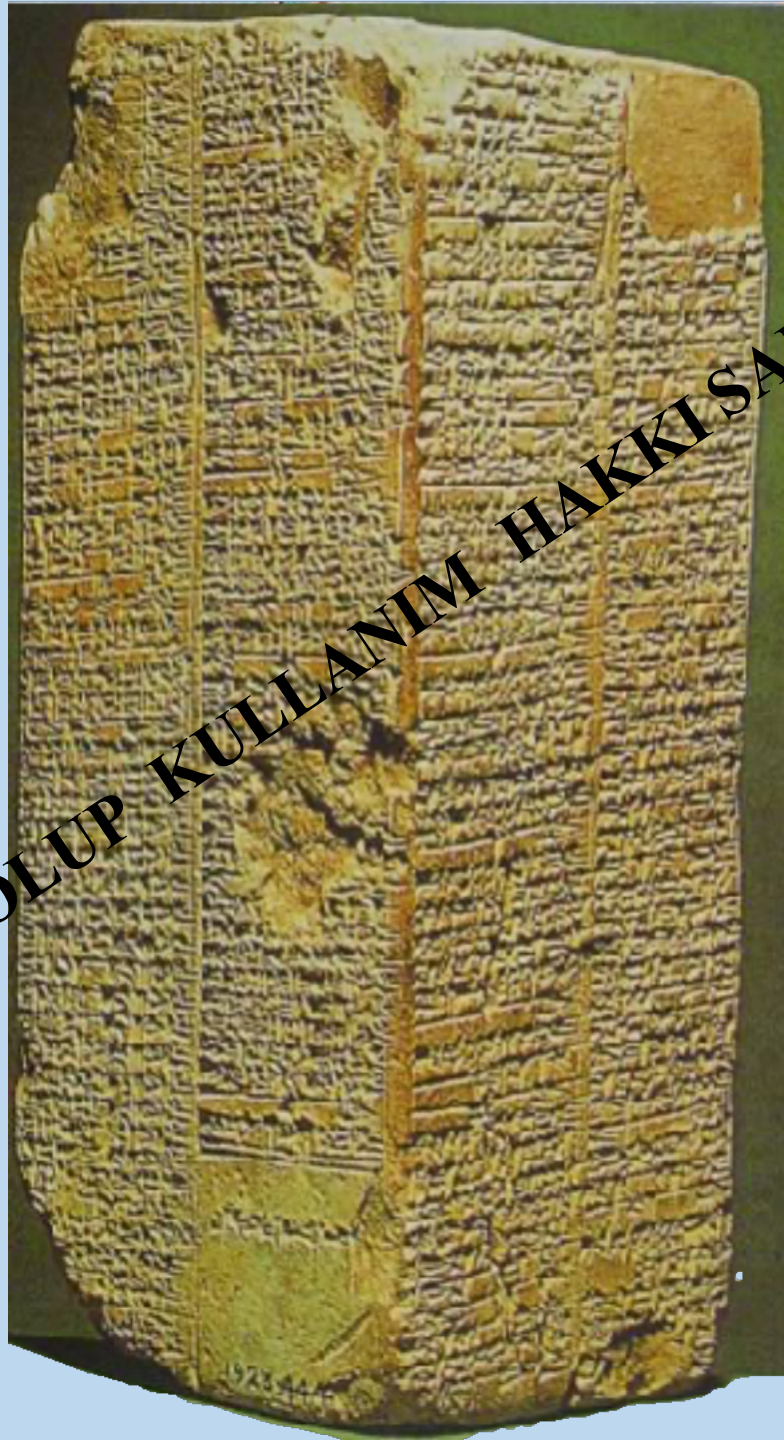
Sümer Kral Listesi Weld-Blundell Prizma Tableti 20X9 cm Ashmolen Müzesi

EĞİTİM AMAÇLI OLUP KULLANIM HAKKI SAKLIDIR