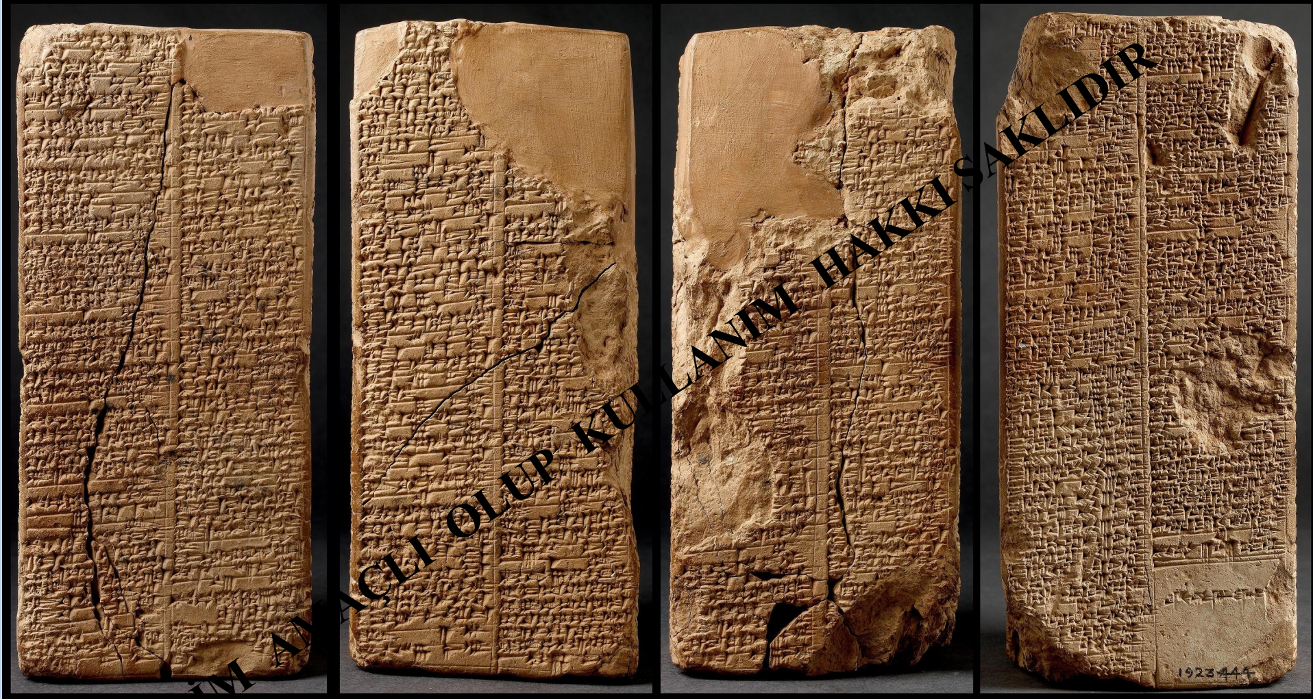
Sümer Kral Listesi Weld-Blundell Prizma Tableti 20X9 cm Ashmolen Müzesi

EĞİTİM AKADEMİSİ OLUP KULLANIMI HAKKI SAKLIDIR