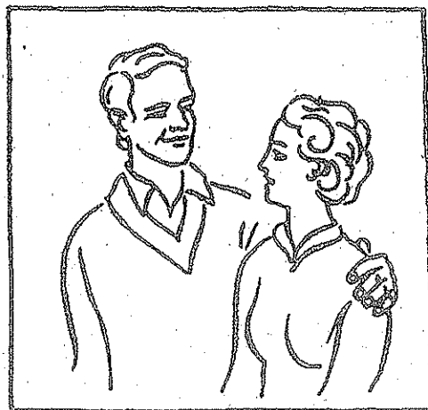
Мы с женой.