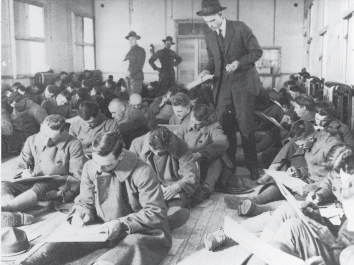
İdeal Olmayan Test Etme Koşulları