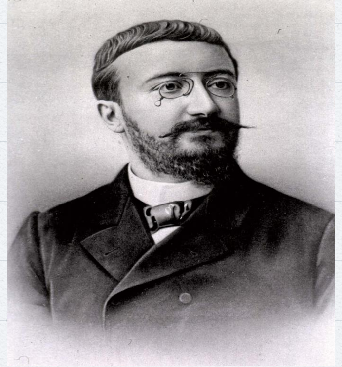
Alfred Binet Zeka testlerinin "babası"