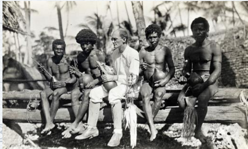
Bronisław Kasper Malinowski